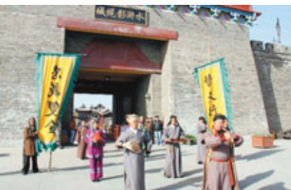
泰安市東平縣水滸影視城已正式對外營業。

其中,總投資2.6億元的大型山水實景演出項目——中華泰山,封禪大典、總投資20億元的第四代高科技文化主題公園——泰山方特歡樂世界,自5月1日開業以來,分別實現收入2,883.7萬元和1.7億元。目前泰安市正在重點推動泰山文化產業園項目,總投資121.6億元,以中華泰山,封禪大典大型實景演出項目為龍頭,建設以秦漢風情區、唐宋風情區、泰山古鎮、泰山東街等為主要內容。目前,一期投資12億元的泰山古鎮項目正在建設之中。下轄東平縣水滸文化產業園總投資20億元,以水滸文化為主題,主要建設水滸影視城、六工山、山泉水寨、千年宋城、聚義島等項目,目前水滸影視城項目(水滸文化主題公園)已正式對外開放。