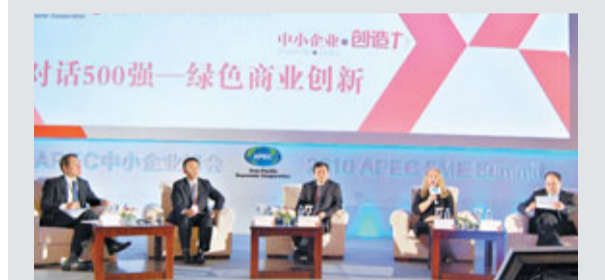
2010 APEC中小企業峰會上,英特爾、HP等500強企業就綠色商業創新與參會嘉賓進行探討。

APEC中小企業峰會作為亞太地區最受關注和重視的國際性會議之一,今番首次在中國西部城市舉辦,也是希望通過這個平台,圍繞中小企業的創造力為主題,探索出如何在中國實施「西部大開發戰略」等所帶來的大好商機和新挑戰。