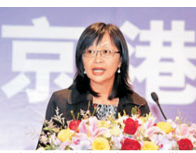
財經事務及庫務局副局長梁鳳儀。

香港文匯報訊 中國國家統計局周六公布了11月份宏觀經濟數據。其中,居民消費價格(CPI)同比上漲5.1%,創28個月以來新高。據港電子媒體引述財經事務及庫務局副局長梁鳳儀指出,若通脹超出可承受範圍,相信人民銀行及內地相關部門會採取措施,加強收緊銀行信貸,有助舒緩本港通脹。