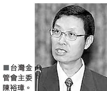
台灣金管會主委陳裕璋。

香港文匯報訊 據台灣《經濟日報》報導，台灣金管會加快兩岸金融開放，金管會主委陳裕璋10日指出，近期將放寬兩岸基金相互投資額度與上限，內容包括：島內投信基金與全權委託投資資產，投資陸股的限制，將從基金淨資產價值的10%提高到30%。至於大陸來台投資(QDII)部分，整體上限仍然維持5億美元，但個別上限從8,000萬美元提高到1億美元。他透露，正在會合相關部會意見，等「行政院」拍板之後就可以上路。