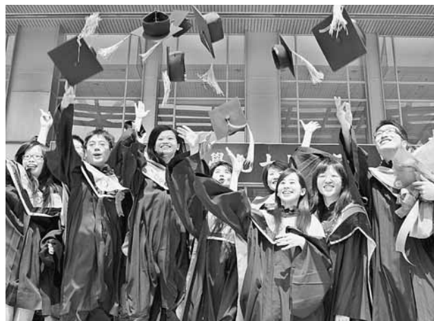
畢業生6月甫離開校園進入社會，馬上就面臨就業問題。