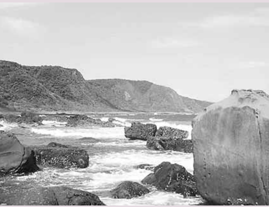
位於屏東縣的出風鼻段。