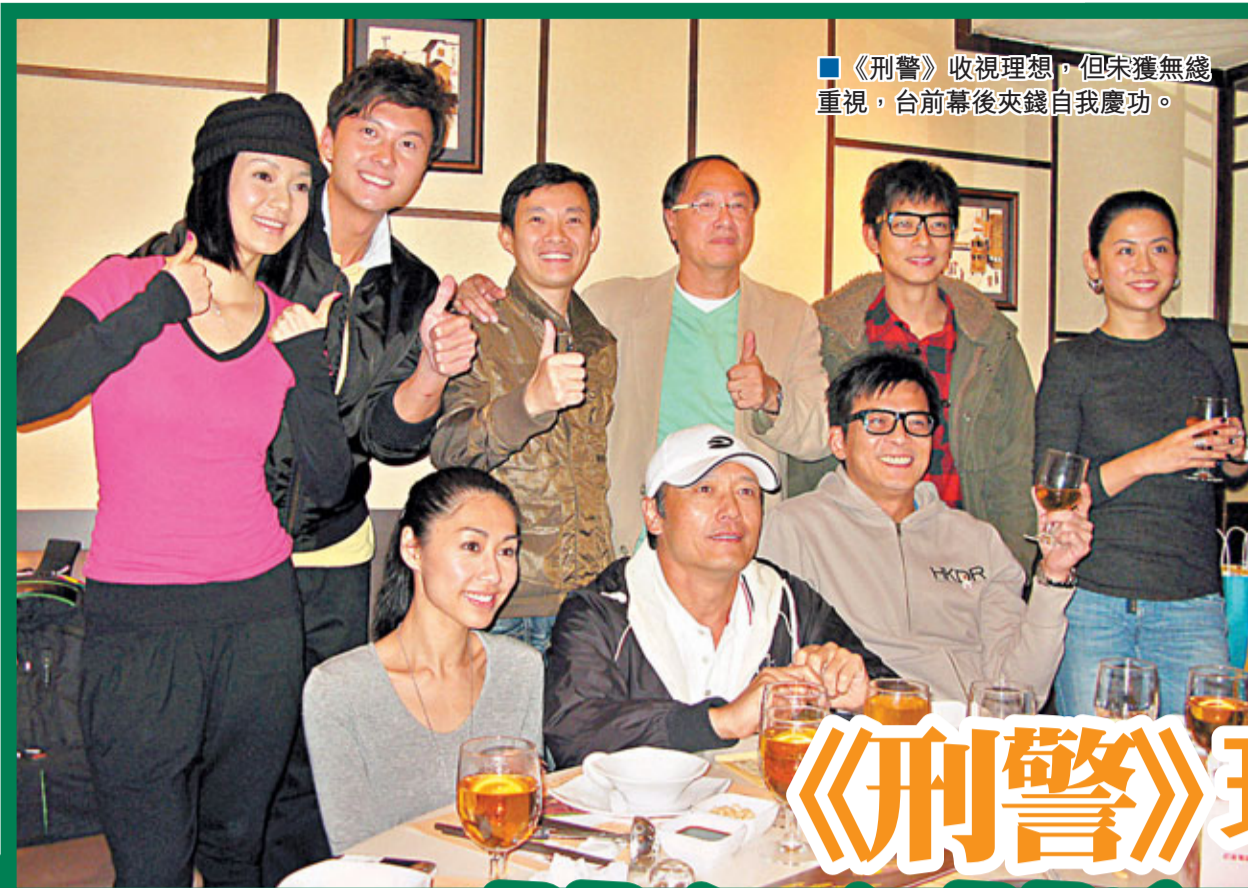
《刑警》收視理想，但宋灑無綫重視，台前幕後夾錢自我慶功。