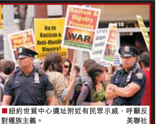
■紐約世貿中心遺址附近有民眾示威，呼籲反對種族主義。