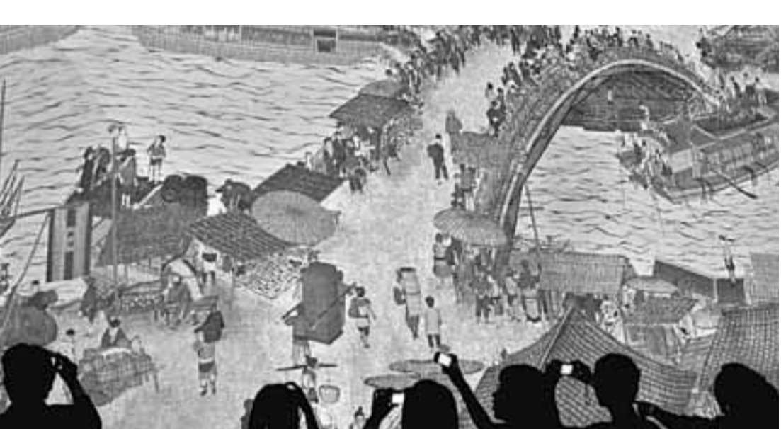
日前，上海世博會中國國家館中以現代多媒體技術演繹的《清明上河圖》吸引了大量遊客目光。

「清明上河圖」是中國十大古畫之一，描繪了北宋都城汴京的繁華景象。最近發現了一幅與之極為相似的「雙胞胎」畫作，引發了藝術界對其真實性的質疑。