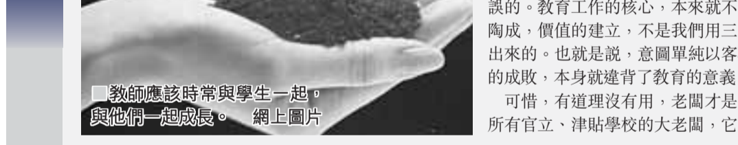
教師應該時常與學生一起，與他們一起成長。

十年前，自己初出學院，在某連鎖集團的中學一任職。工作兩三年後，對校長多有抱怨，而且，不是我一人如此，而是眾人皆然。大家的共識是：校長不如去做CEO啊！