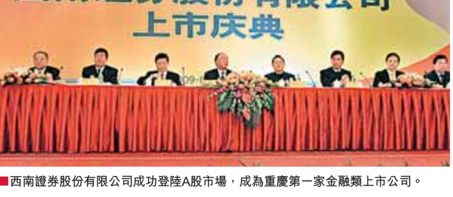
■西南證券股份有限公司成功登陸A股市場，成為重慶第一家金融類上市公司。