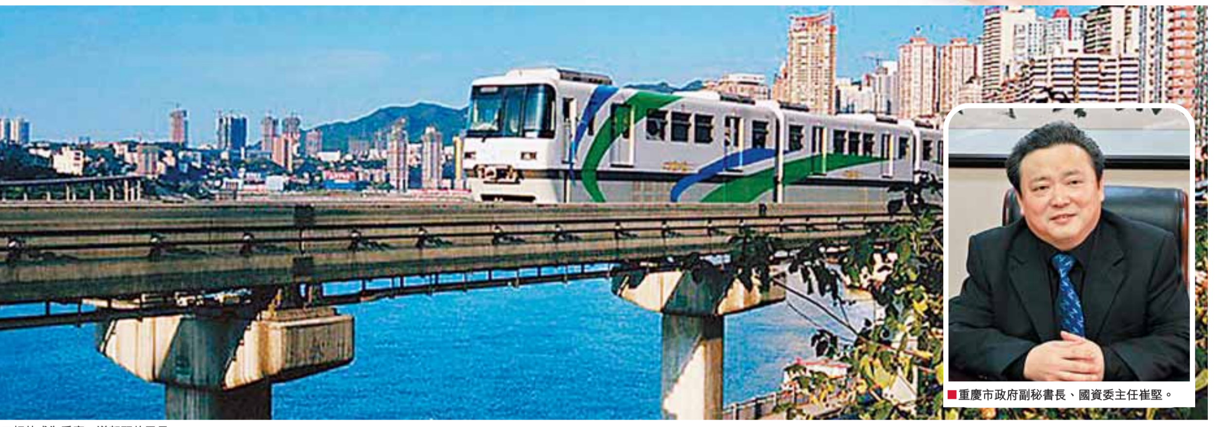
■輕軌成為重慶一道靚麗的風景