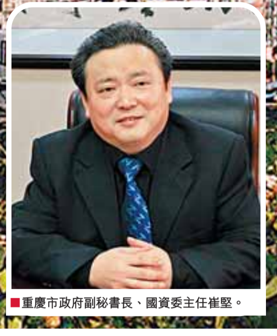
■重慶市政府副秘書長、國資委主任崔堅。