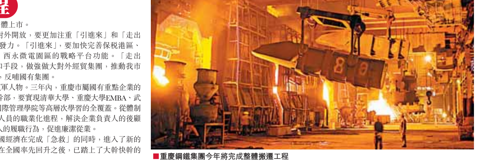
■重慶鋼鐵集團今年將完成整體搬遷工程