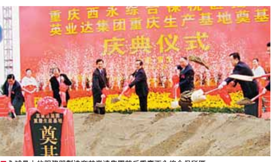
■全球最大的伺服器製造商英業達集團落戶重慶西永綜合保稅區