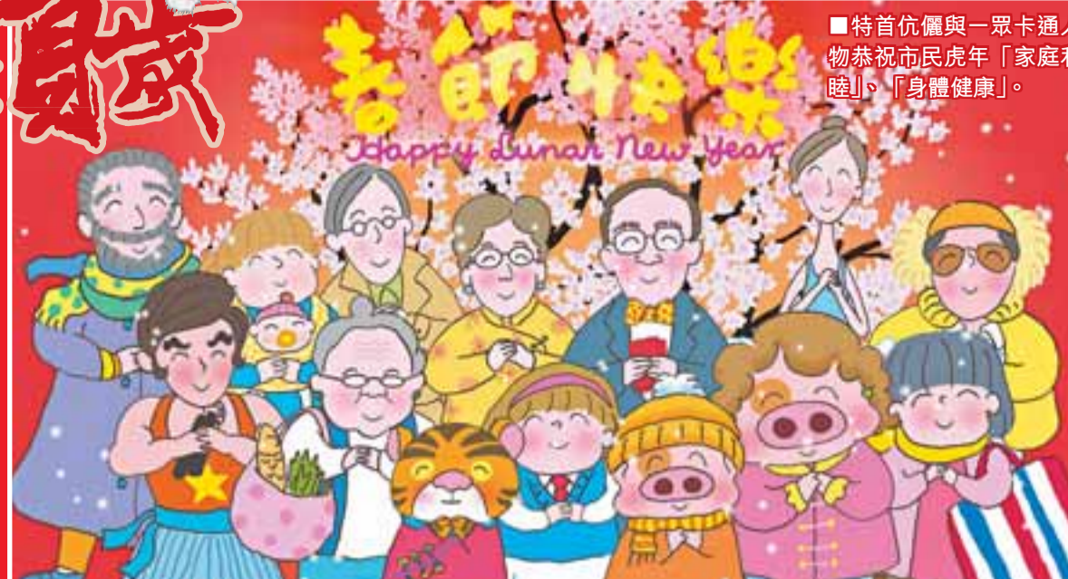
■特首伉儷與一票卡通人物恭祝市民虎年「家庭和靚」、「身體健康」。