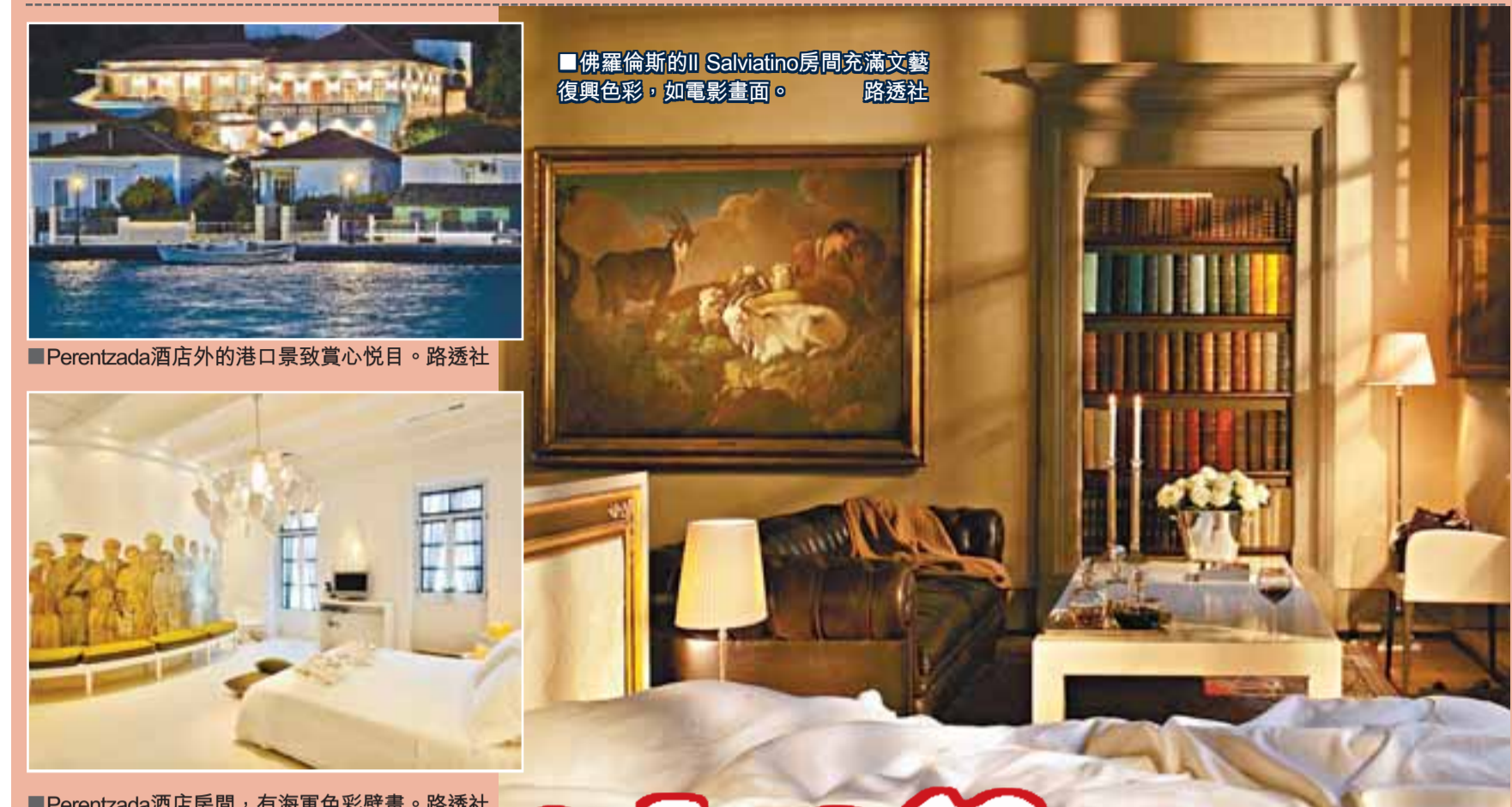
■佛羅倫斯的Il Salsvatiino房間充滿文藝復興色彩，如電影畫面。