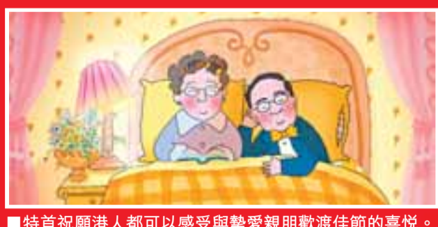
■特首祈願港人都可以感受與摯愛親朋歡度佳節的喜悅。