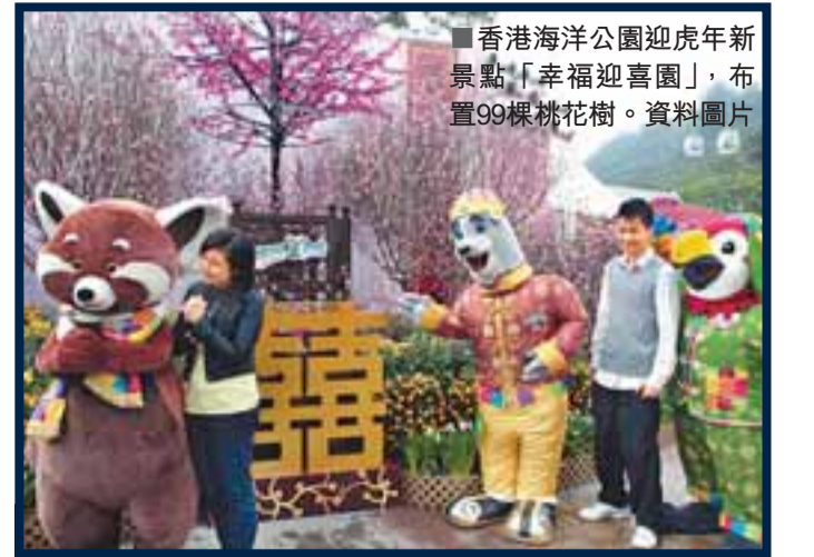
■香港海洋公園迎虎年新景，「幸福迎喜園」，布置99棵桃花樹。資料圖片

情人節前夕，英國男子最愛買哪種物品？當地零售商Debenhams發現，過去一周內，一款每條售價18英鎊(約219港元)的「假狗底褲」銷量增加70%。這種內褲的設計有如女性的「神奇胸圍」，生產商在內褲前部位置加入厚墊，令男性下身看來更「有雄偉」。 Debenhams男士用品部主管笑稱：「這意味著男士在這個熱情日子毋須再嘆『眾生不平等』。不過內褲脫掉後會發生什麼事，我們恕不負責。」 假如未被女伴捨棄，男士們當然得準備另一款「道具」。在紐約，一項安全套包裝設計比賽正進行得如火如荼，大會日前從600個投稿中選出最後5強，當中最吸引目光的莫過於一個模仿電腦開關按鈕的設計。勝出的設計將會製作成實物，於紐約市各大商場所免費派發。 紐約避孕套包裝設計比賽入圍作品之一。網上圖片 「假狗底褲」在英國熱賣。網上圖片 「假狗底褲」在英國熱賣。網上圖片