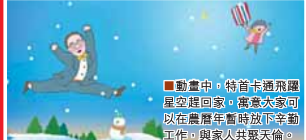
■動畫中，特首卡通飛躍星空趕回家，寓意大家可以農歷年暫時放下辛勤工作，與家人共聚天倫。