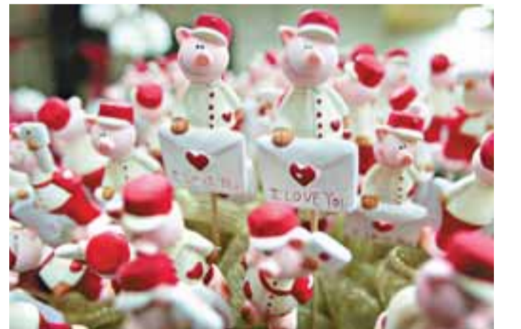
■貝魯特商店售賣情人節禮物。路透社

全球最浪漫的單字是什麼？英國一個機構調查發現，「Amour」(法文，解作「愛」)被語言學家公認為全球最浪漫單字。其次則是同樣解作愛的意大利文單字「Amore」。但意大利愛好者毋須擔心，因為英文被選為全球最浪漫的語言。 調查訪問了320多名語言學家。「Bellissima」(意大利和西班牙文中「非常美麗」之意)在浪漫單字中排第3，第4則是意文和西文中解作「歡愉」的「Tosco」。至於法文則被選為浪漫語言第2位，西文和英文并列第3。 被問及全球最難聽的「我愛你」版本，專家一致認為日文「我愛你」最難聽，其次則是威爾斯語和科林電影《星空奇遇記》中虛構語言「克林崗語」。 ■路透社