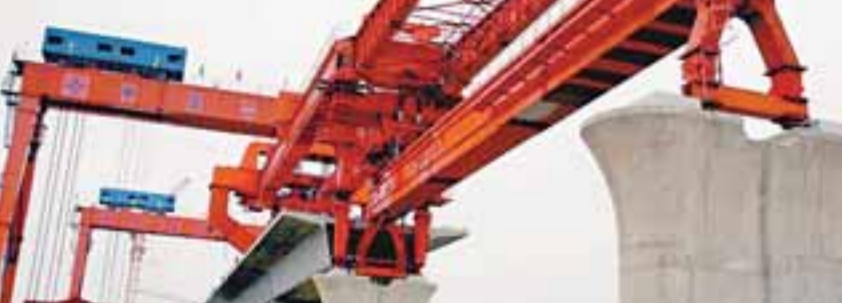
滬杭鐵路客運專線工程進展順利,有望在今年上海世博會期間投入運營。

風格和國際影響的動漫形象和動漫品牌,佔領國內主流市場,積極開拓國際市場。今後,要積極發展網路動漫、手機動漫等新興業態,鼓勵發展與國際市場展開交流的動漫作品。 文化部、工業和信息化部、共青團中央、湖南省人民政府主辦的「第四屆中國原創手機動漫遊戲大賽」閉幕式暨頒獎晚會近日在湖南長沙落幕。台灣青禾動漫設計有限公司的手機動漫作品《老舍謝謝您》獲得是次大獎金獎,開創兩岸三地動漫領域交流的新紀錄。 是次大賽以「動漫新時代·G3新生活」為主題,致力於挖掘創才,打造動漫遊戲原創精品,為創才人才提供更多的發展平台和就業崗位。據悉,該大賽自去年6月啟動以來,僅個月時間內,大賽參賽單位(企業、工作室)達1,181家;徵集作品總數為逾10萬件;參與大賽活動的客戶數近2,000萬;參賽作品下載次數超過3,000萬次。 主辦主辦方相關負責人透露,將於今年啟動的第五屆大賽賽事範圍將擴展到「兩岸四地」,充分凸顯兩岸四地動漫資源,通過手機動漫遊戲增加兩岸四地的文化溝通和市場互補,進一步擴大動漫產業和原創手機動漫遊戲大賽的影響力。 文化部文化產業司司長劉玉珠介紹稱,國家鼓勵創造具有中國