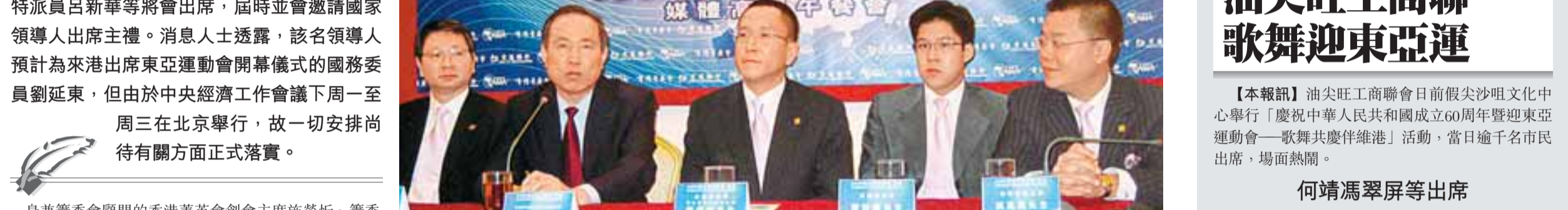
博鰲青年論壇將於下周一首次在香港舉行，籌委會舉行發布會。

【本報訊】(記者 郭曉樂)博鰲亞洲論壇及香港菁英會聯合舉辦，交通銀行贊助的「2009博鰲青年論壇(香港)」首次衝出海南島，於下周一(7日)首次在香港舉行。據悉，行政長官曾蔭權、中聯辦主任彭清華、外交部駐港特派員呂新華等將會出席，屆時並會邀請國家領導人出席主禮。消息人士透露，該名領導人預計為來港出席東亞運動會開幕儀式的國務委員劉延東，但由於中央經濟工作會議下周一至周三在北京舉行，故一切安排尚待有關方面正式落實。