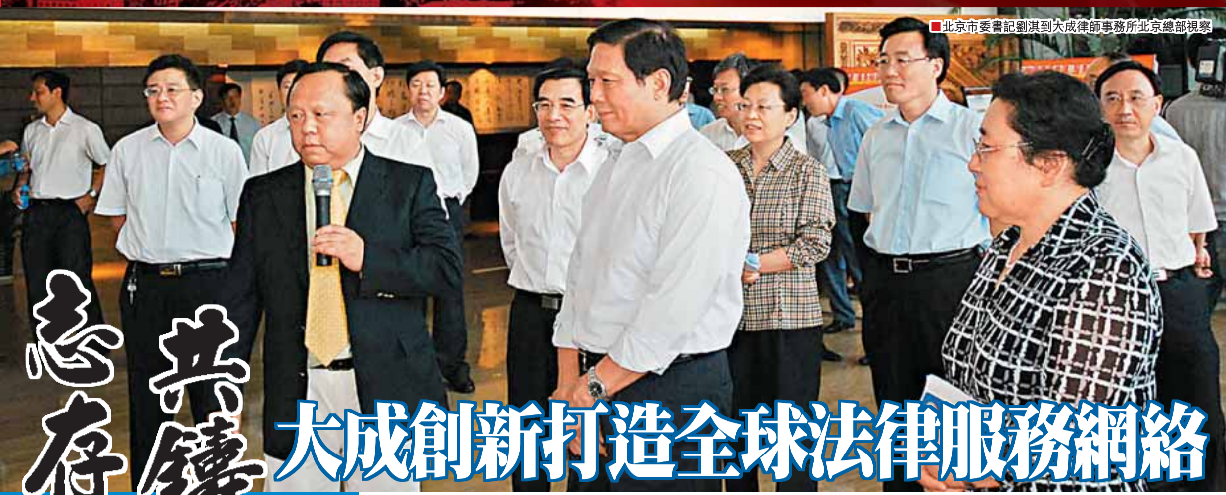
北京市委書記劉淇到大成律師事務所北京總部視察