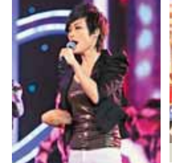
張靚穎加入新公司即取好成績。