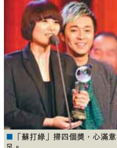
「蘇打綠」掃四個獎,心滿意足。