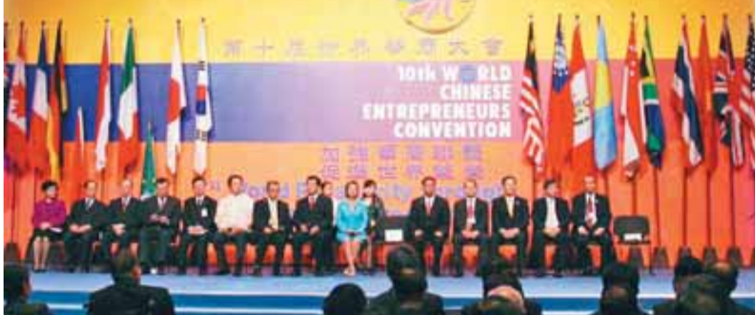
兩年一度的世界華商大會在菲律賓開幕，吸引了全球及菲律賓當地的華商精英約3千人參加。