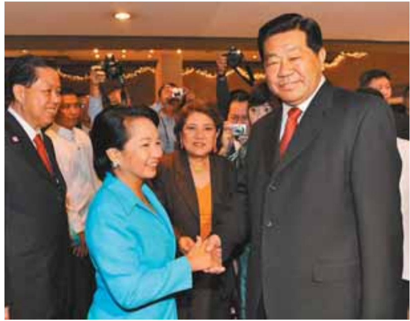
全國政協主席賈慶林在第10屆世界華商大會開幕式前，與菲律賓總統阿羅約夫人握手。

【本報記者解玲馬尼拉20日電】雲集全球3千華商的第10屆世界華商大會，今日在菲律賓首都馬尼拉隆重開幕。菲律賓總統阿羅約夫人，中共中央政治局常委、全國政協主席賈慶林等親臨開幕式並致辭。香港旅港福建商會等多個團體派出代表團出席大會，來自20多個國家和地區、逾300個華人社團的企業家精英聚首一堂，出席全球華商年一度的盛事。