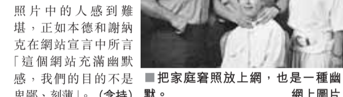
把家庭容照放上網, 也是一種幽默、刻薄。網上圖片

對一般人來說, 分享家庭的容事是一種直洩方式, 但也不會令照片中的人感到難堪, 正如本德和謝納克在網站宣言中所言「這個網站充滿幽默感, 我們的目的是不是把家庭容照放上網, 也是一種幽默、刻薄。」(念特) 圖