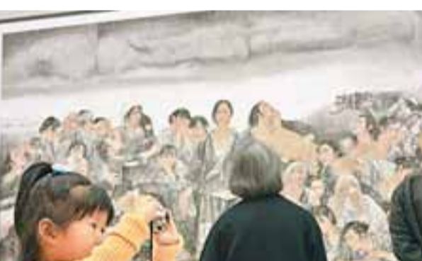
上海美術館中的展覽與觀眾

傳統的水墨到最當代的裝置，都要在上美術館展出。這種「多角色扮演」的情況在廣東美術館和中國美術館也一樣。