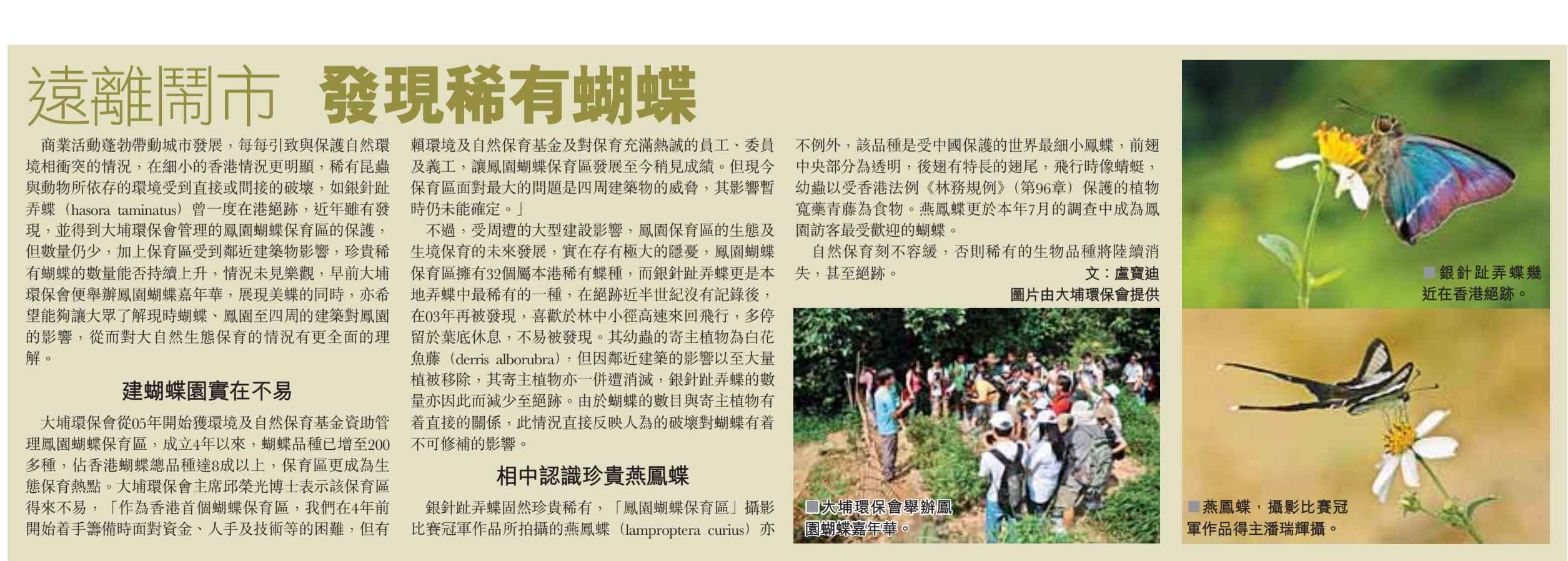
鳳凰蝶保育區蝴蝶保育區，成立4年以來，蝴蝶品種已增至200多種。

大埔環保會從05年開始獲環境及自然保育基金資助管理鳳凰蝴蝶保育區，成立4年以來，蝴蝶品種已增至200多種。佔香港蝴蝶總品種三成以上，保育區更成為生態保育熱點。