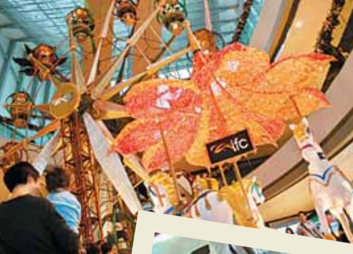
在商場辦的藝術展覽。