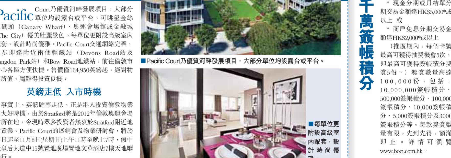
Pacific Court乃優渥河畔發展項目，大部分單位均設露台或平台。

英國著名地產發展商Berkeley Homes推出Caspian Wharf全新一期住宅單位Pacific Court。位於Zone 2的Pacific Court，位置優越，毗鄰金融中心金絲雀碼頭(Canary Wharf)。