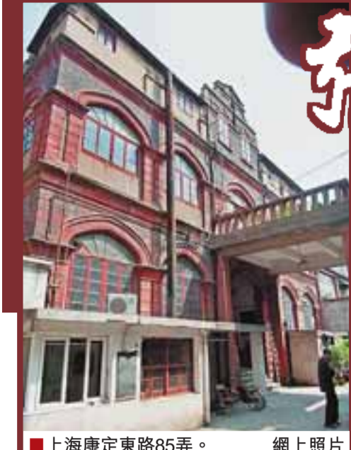
上海康定東路85弄。網上照片