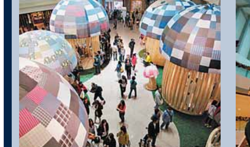
藝術創作與商業發展，是對立，還是共融，視乎藝術家與商人如何達到共贏的局面。

參加中銀信用卡「即抽即中」大抽獎，可隨時贏高達「10,000,000」簽帳積分獎賞。由即日起至2010年2月28日，卡戶憑中銀信用卡作本地零售簽帳、現金分期、月結分期或現金分期息分期交易，即可致電抽獎熱線進行「即抽即中」大抽獎。