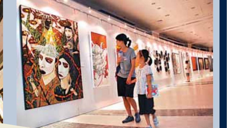
在商場辦的藝術展覽。

在政府早前公布的施政報告中，提及致力發展六大產業之一的文化創意產業。要把「創意」跟「產業」扯上關係並不容易，藝術與商業兩者融合，近期比較引人注目的合作例子，當屬Pacific Coffee與本地藝術家合作展覽藝術作品。