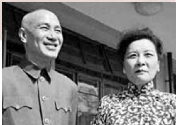
晚年蔣介石與宋美齡。網上照片