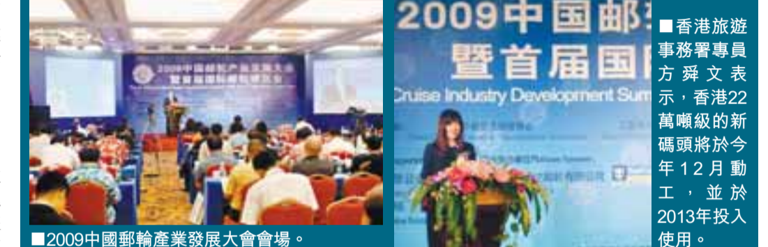
2009中國郵輪產業發展大會會場。