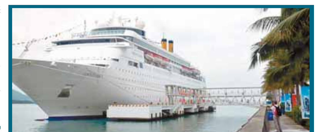
停靠三亞鳳凰島的歌詩達「麗光」號郵輪。

【本報海峽西岸新聞中心記者林蓉、蘇榕蓉3日專電】第5屆兩岸林業博覽會暨投資貿易洽談會今日揭幕, 東道主福建三明市利用當地林業資源優勢, 盡攬230個簽約項目, 總投資145.73億元(人民幣, 下同), 擬利用外資及外資13.11億元。其中, 投資億元以上項目有台商聯誼會國際公司投資3.6億元的莆田牛樟樹系列開發項目、鴻源公司投資3.5億元的清流購物休閒項目等24項。大田牛樟樹系列開發項目相關負責人許先生表示, 該項目將分3期完成, 第一期計劃投資7000萬元用於生產區的建設, 做好牛樟芝的研發與生產; 第二期計劃投資1.2億元用於加工區的建設, 做好牛樟芝系列產品的深加工; 第三期計劃投資1.7億元用於觀光體驗區建設, 搞好現代精緻農業觀光體驗園的建設。該項目建成投產後, 年創產值預計達10億元以上。此外, 香港鑫宇科技集團和福建華泰聯合總投資7800萬元的營養食品生產項目, 擬建設多功能化生產線一條和一個生產檢測中心, 項目建成後, 年耗原輔料助料4274噸, 年產值可達1億元, 帶動農業產業化基地10萬畝。本屆林博會展館面積2萬平方米, 共有435家企業參展, 其中台灣40家、香港4家, 還首次設立台灣阿里山高山館, 吸引到眾多內地採購商。據悉, 林博會舉辦4年以來, 三明市已引進台灣新品種、新技术200多個, 推廣面積15.8萬畝, 並借鑒台灣產銷班模式, 建立精緻農林合作經濟組織26個。