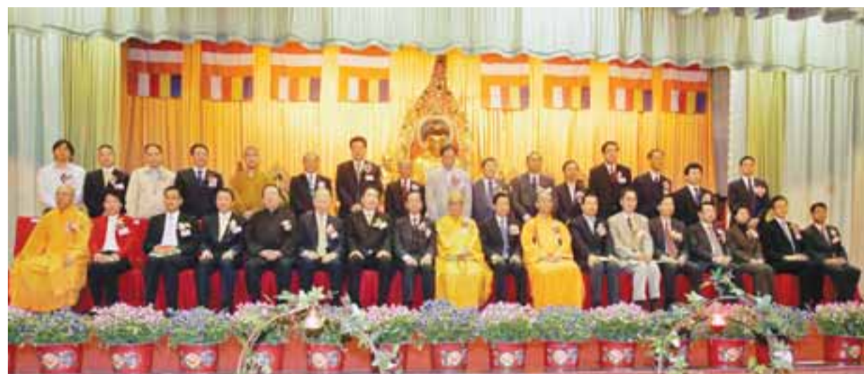
▲寶蓮禪寺為一年一度的浴佛節典禮舉行開幕式，賓主合照。

【本報訊】(記者 沈清麗)為慶祝釋迦世尊降生2553年誕辰紀念，寶蓮禪寺一年一度、為期7天的浴佛節慶典和佛誕法會於昨日開幕。國家宗教局副局長蔣堅永、中國佛教協會副會長學誠大和尚、行政會議成員劉皇發、中聯辦新界工作部部長陳卓等擔任主禮嘉賓，並在寶蓮禪寺主持釋智慧陪同下浴佛。