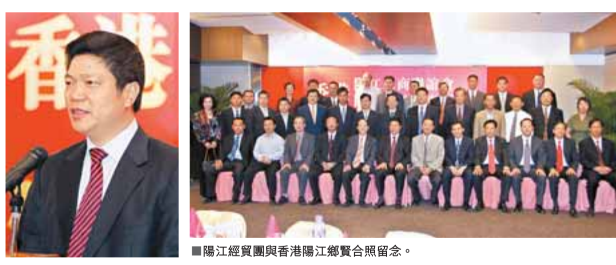
▲陽江經貿團與香港陽江鄉會合照留念。

【本報訊】香港陽江工商聯會及陽江鄉會日前假九龍灣展覽3樓善善酒樓，舉行歡迎陽江經貿代表團聯歡晚宴。陽江市市長魏安廣(小圖)表示，市政府踴躍到港開展投資促進活動，主要為推動陽江與香港的經貿交流和合作，歡迎香港工商界朋友到陽江投資興業。