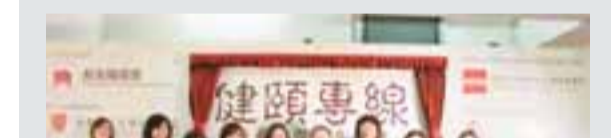
▲嘉賓出席「健腦專線」流動中醫養生服務開展禮，並為體態醫療服務場開幕剪綵。

剛出版的《東莞美食地圖》是第一本較全面反映東莞美食資源的書籍，匯集了東莞32個鎮區的地方特色餐飲，以及50多家高星級酒店的經典美食。