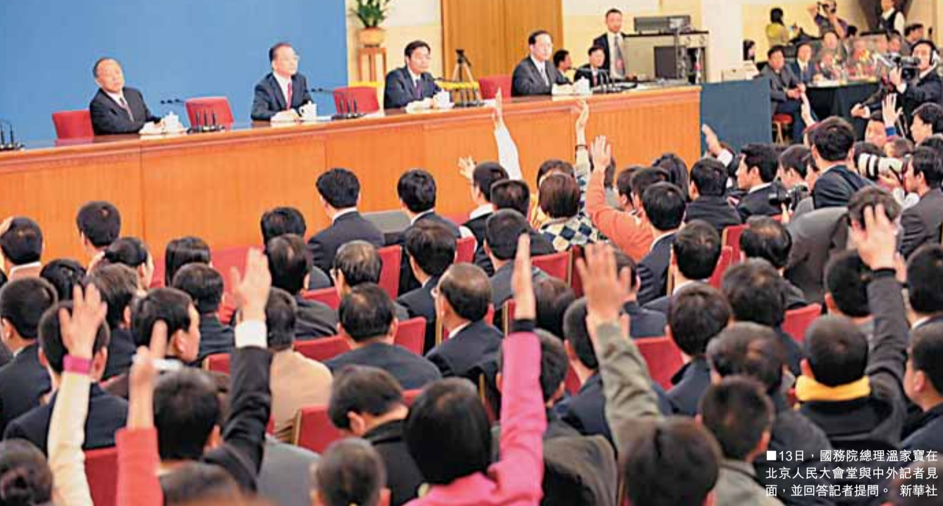
13日，國務院總理溫家寶在人民大會堂與中外記者見面，並回答記者提問。