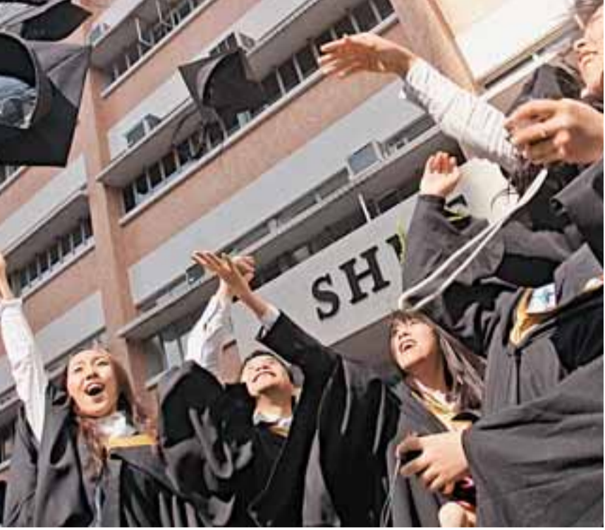
勞工處將在8月推出「大學畢業生實習計劃」，並強調各院校絕不會容許學生成為廉價勞工。

【本報訊】(記者 聶曉輝)勞工處將於8月推出「大學畢業生實習計劃」，向應屆畢業的本科生提供3,000個本地實習及1,000個內地實習的名額，涉款1.4億元。勞工處強調，4,000元只是在本地實習的畢業生月薪下限，並由各院校把關篩選職位，相信院校絕不會容許學生成為「廉價勞工」。此外，如在內地企業實習的畢業生不獲住宿安排，當局會在原有3,000元實習津貼之外，額外向畢業生提供1,500元住宿津貼。