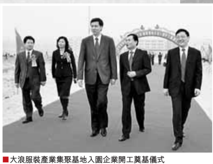
■大浪服裝產業集聚區入園企業開工奠基儀式