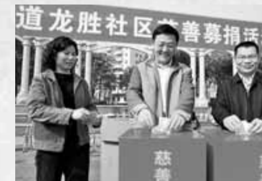
■送一份愛心,展一種情懷。