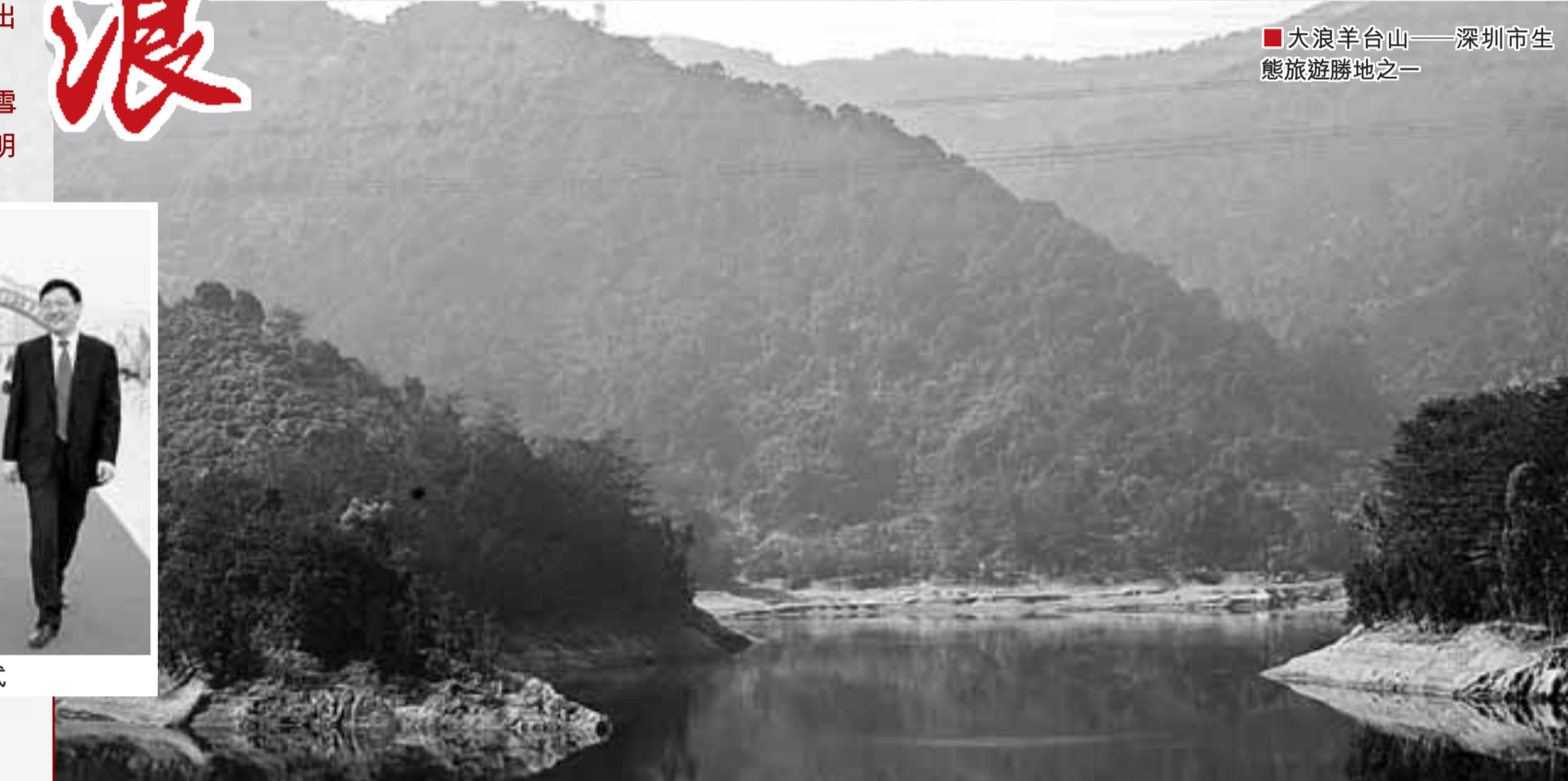
■大浪羊台山——深圳市生態旅遊勝地之一

大浪街道堅定不移走科學發展的道路,以產業結構調整和升級帶動經濟的全面發展,充分發揮區域經濟優勢,形成了以服裝產業、電子、鞋業、傢具等優勢產業為重點,現代服務業逐步發展的產業結構佈局。