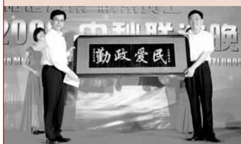
■萬眾公司向大浪街道贈送「勤政愛民」牌匾。

大浪街道牢固樹立「發展是政績,穩定更是政績」的執政理念,三年來,以查違、安全、維穩三大工作為重點,以綜合執法為依托,嚴格、規範、精細、長效管理,城區環境有了顯著改善。