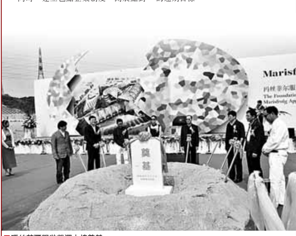
■瑪絲菲爾服裝營運大樓奠基

大浪街道現有人口近40萬,其中來深建設者有35萬人。大浪內同富裕工業園是大龍華外來勞務工建設深圳的「坐標」建築,這裡不僅有數十家企業聚集,更是近十萬外來工的安居家園。