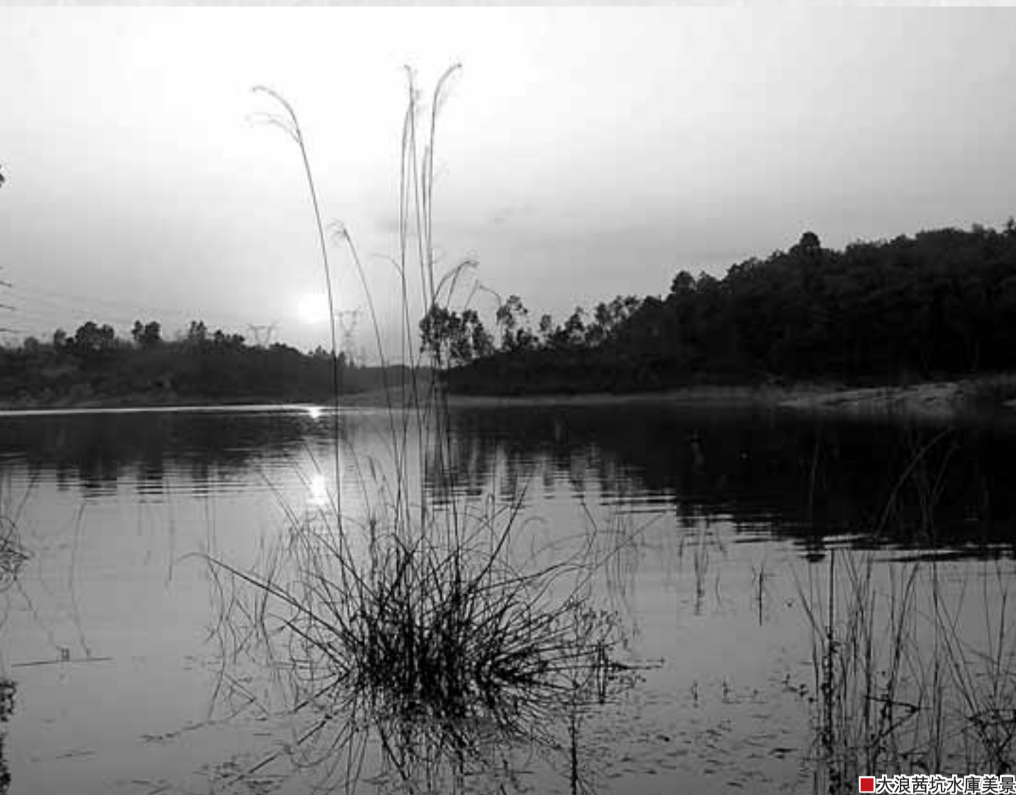
■大浪青山水庫風景