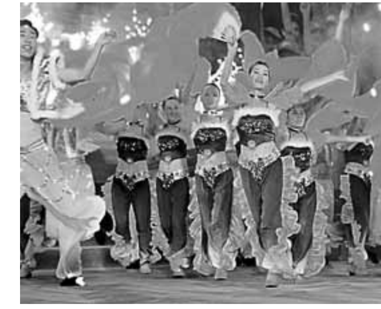
■大浪街道社區文化豐富多彩。

大浪街道還將依托羊台山人文、歷史、自然資源,特別是作為東江縱隊戰鬥過的地方和「文化名人大眾教」的歷史,實施修建「文化名人大眾教」圖畫碑林、雕塑等舉措,與客家人文精神結合,與新街遊、新形象、新夢想的主旨相結合,將其作為提升居民精神家園來培育,進一步提升羊台山文化內涵。