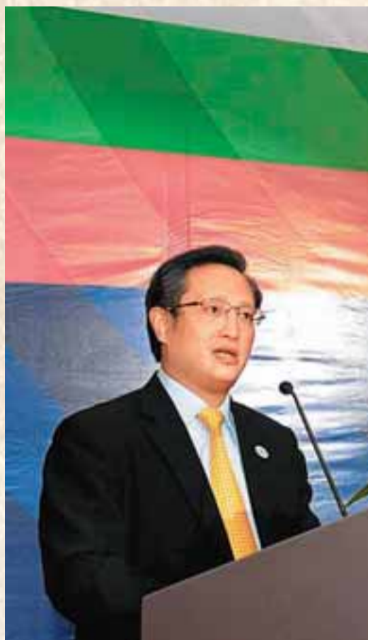
福田區委書記、區長李平表示要站在珠三角全局來謀劃推動福田發展。