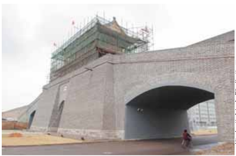
■河北近年致力修復歷史古跡，當中包括始建於明洪武年間的古化古城大門。

同時兼任河北省文聯主任的白石續表示，該省組織實施《河北省公共文化扶貧工程》，去年投資逾2億元(人民幣，下同)，累計投入10.6億元，建成44個縣級宣傳文化中心。並於今年春節期間組織省「心連心」藝術團深入全省偏遠山區農村為群眾表演，組織省市縣3,000多名書