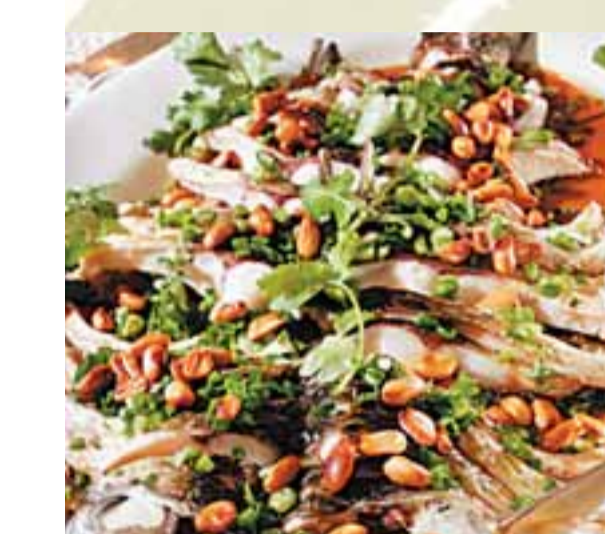
■簡單的蒸鮭魚，配合師傅神乎其技的刀法，頓時鮮香四溢。$138/條 (a)

馮師傅以順德名區獨家代理的德國香檳啤酒Urbanus燻西江鮰，絲毫不覺膩膩。香檳啤酒$15/兩，10兩起 (a)