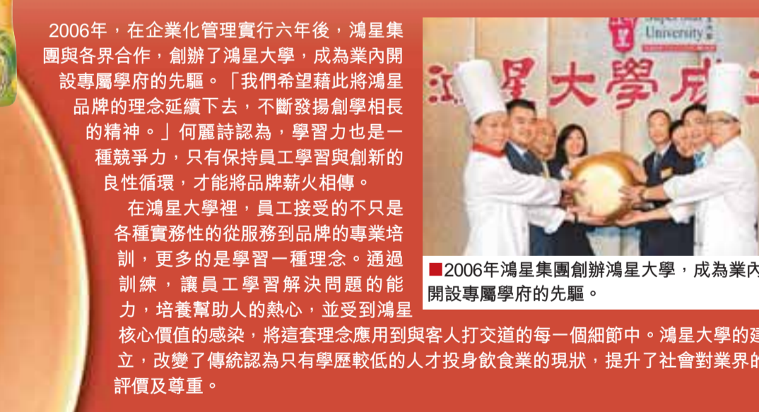
2006年鴻星集團創辦鴻星大學，成為業內開設專屬學院的先驅。