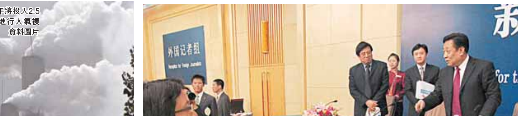
全國人大會議11日舉行環境保護問題的專題採訪。圖為分管污染防治工作的環境保護部副部長張力軍(上排右一)在採訪活動結束後受到眾多傳媒追訪。

【本報兩會報道組北京11日電】環境保護部副部長張力軍今日就「當前環境保護形勢和任務」接受採訪時指出，中國城市污染的重點區域依然集中在珠三角、長三角和京津冀3個地區，環保部正在與這3個地方的省級政府和環保部門進行協調，準備編制區域的污染防治規劃。另據了解，中國將斥資2.5億元在珠三角地區首先進行大氣複合污染研究。