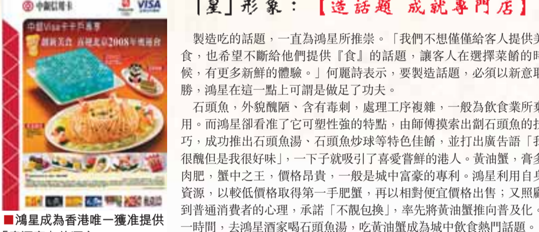
鴻星成為公認的石頭魚專門店。