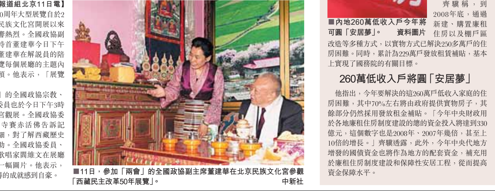
11日，參加「兩會」的全國政協副主席董建華在北京民族文化宮參觀「西藏民主改革50周年展覽」。