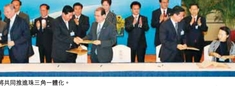
■粵港澳將共同推進珠三角一體化。

據悉，廣東將圍繞加快建設現代化產業體系的總體要求，大力發展現代服務業，加快提升傳統服務業，優先發展高新技術產業，培育新興戰略產業，制定實施鋼鐵、汽車、造船、石化、紡織、輕工、有色金屬、裝備製造、電子信息、建材等10個重點產業振興規劃，支持建設一批市場前景好、產業關聯度大、帶動作用強的先進製造業項目。