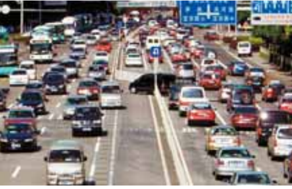
■珠三角將以交通設施為突破口，加快一體化進程。

在廣東今年3,030億安排的200項重點項目中，新開工項目78個，較2008年1,280億重大項目預算，增長近2倍。為加快重點項目建設，有效拉動經濟增長，廣東省發改委明確提出：「爭取國家批准一批、提前開工建設一批、提早建成投產一批、規劃儲備一批重大項目。」 據了解，在廣東外需放緩、內需不旺的經濟形勢下，重大項目建設正成為「保增長、擴內需、調結構」的重要突破口。 據了解，由於今年重點項目計劃投資額較大，為加快項目進度，廣東還將在今年開展多渠道籌建建設資金，除爭取國家加大中央預算內和國債等投資對粵支持外，還將爭取發行基礎設施建設債券，並爭取中央批准設立「廣東高新技術產業投資基金」和「廣東空港產業投資基金」，以及在粵開展房地產信託投資基金試點等。