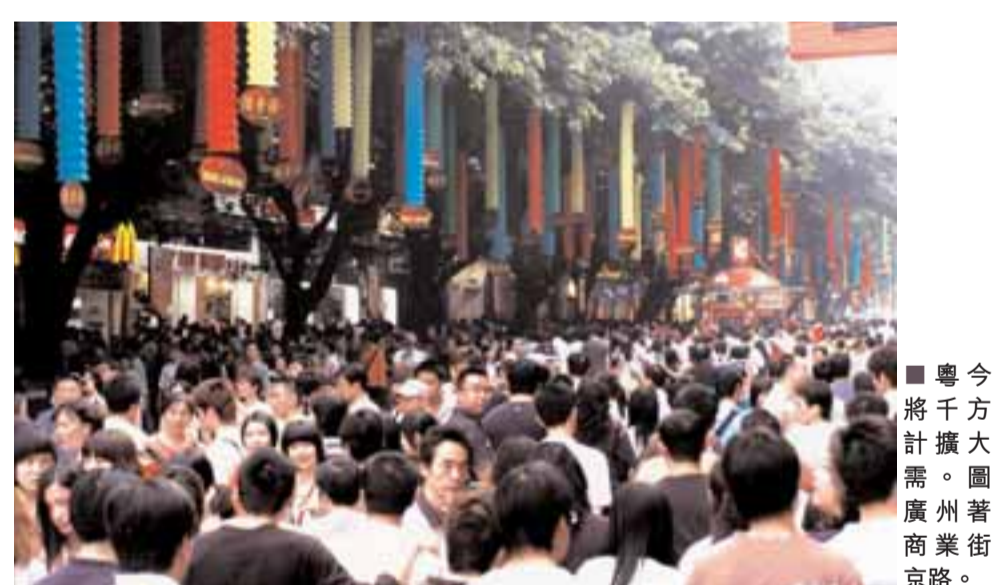
■粵今年將千方百計擴大內需。圖為廣州著名商業街北京路。

黃華華在談到綱要落實時表示，加快推進珠三角的一體化進程；充分發揮珠三角的輻射帶動作用，促進珠三角的科學發展。在區域發展中，粵東西北不發達的地區均被列入「環珠三角地區」。分析人士稱，一方面，廣東可在爭取《綱要》所提重大項目上馬時，爭取中央充分支持；另一方面，可充分利用「先試先行」的指導，在經濟體制改革方面有新的探