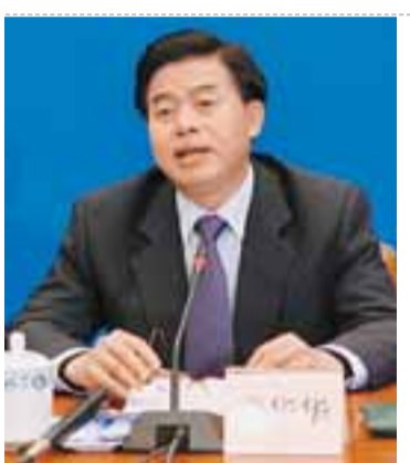
廣東省省長 黃華華