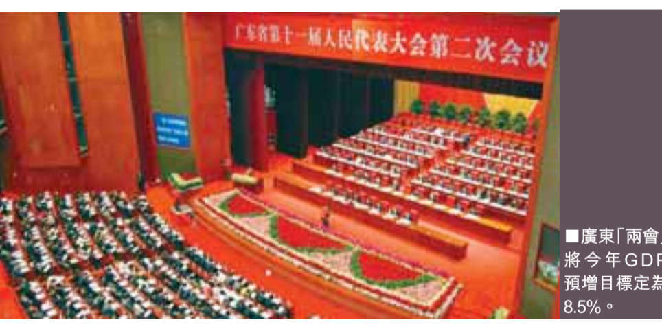
■廣東「兩會」將今年GDP預增目標定為8.5%。

故此，為拉動經濟增長，廣東省今年將加快「新十大工程」建設，全年初步計劃安排省重點項目