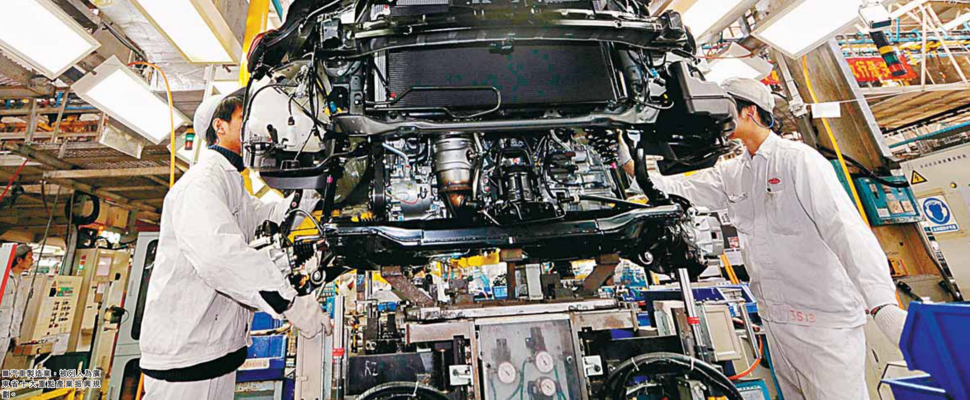
汽車製造業，被列為廣東今年十大重點產業振興規劃。

世界經濟衰退和國內經濟持續下行，外貿大省廣東倍感壓力。在今年2月的廣東「兩會」上，廣東省省長黃華華在《政府工作報告》中預計該省今年GDP增速為8.5%。黃華華表示，今年是「進入新世紀以來廣東發展最為困難的時期」，廣東省今年的首要任務即為「保持經濟平穩快速增長」。為了達成這目標，一系列投資計劃和經濟振興措施提上日程。被看作是打開廣東發展困局的「尚方寶劍」——《珠三角改革發展規劃綱要》也正加快落實。據了解，包括珠三角基礎建設、產業佈局、城鄉規劃在內的多項一體化規劃正在制定中。