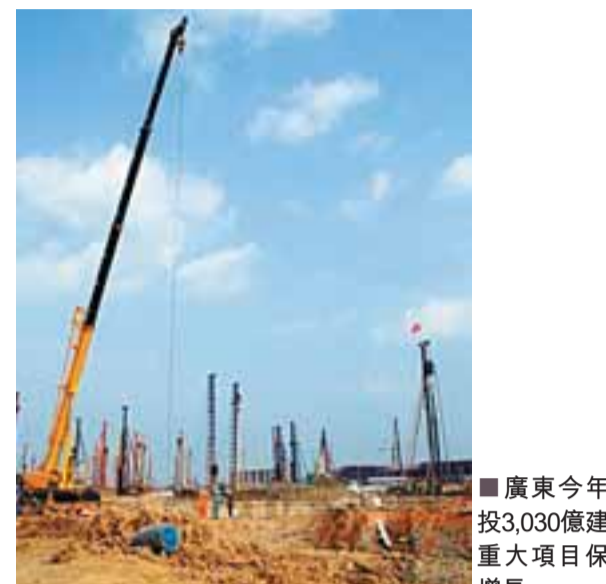
■廣東今年投3,030億建重大項目保增長。

為規劃儲備一批重大項目，廣東今年還安排前期預備項目65項，總投資約7,480億元。當中包括爭取去年底開工的港珠澳大橋、廣州至肇慶和清遠的城際軌道交通等。據了解，重點建設前期預備項目完成前期工作並按國家規定完善相關手續後，可轉列為新開工項目。