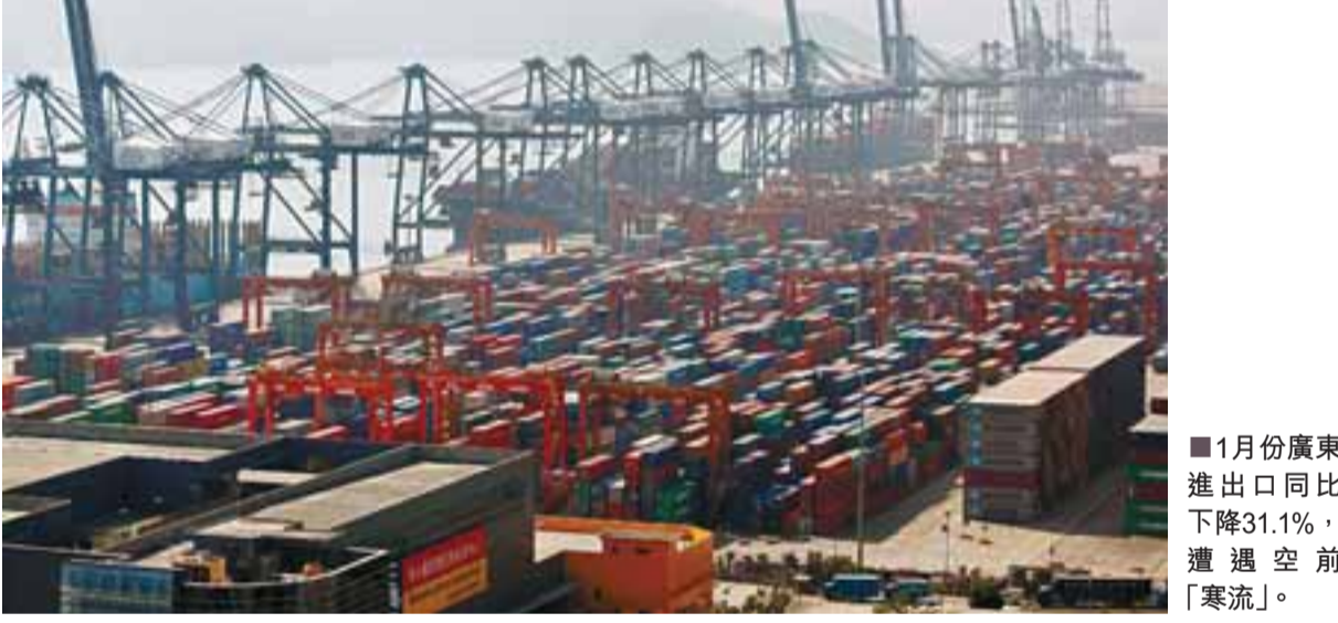
■1月份廣東進出口同比下降31.1%，遭遇空前「寒流」。

易週轉周期性特點，1月總值大幅下降表明未來3至4個月內相關產業的出口還將持續萎縮，後勁明顯不足。今年一季度乃至上半年廣東省進出口可能持續低迷。