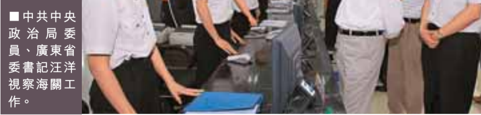
■中共中央政治局委員、廣東省委書記汪洋視察海關工作。

200項，總投資17,610億元，本年度計劃完成投資3,030億。 廣東省發改委今年有關重點項目的規劃文件中則明確提及，大項目建設將作為2009年固定資產投資的重點：「要着力支持重大基礎設施、產業發展、民生工程等關鍵領域和薄弱環節的建設。」廣東希望以3,030億的投資，帶動粵今年社會固定資產投資1.3萬億。