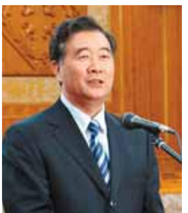
廣東省委書記 汪洋