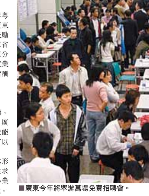
■廣東今年將舉辦萬場免費招聘會。

廣東今年大學畢業生也將面對嚴峻就業形勢。據統計，今年廣東約有50多萬名大學生畢業，再加上中等職業學校和技工學校的畢業生，今年將有90萬大專畢業生在廣東求職。