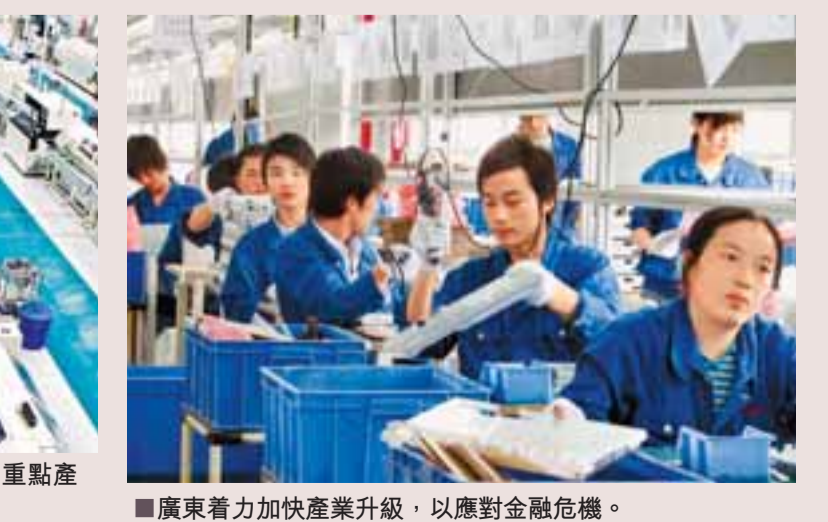
■廣東省力加快產業升級，以應對金融危機。