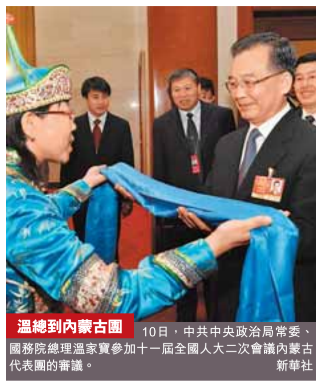
溫總到內蒙古團 10日，中共中央政治局常委、國務院總理溫家寶參加十一屆全國人大二次會議內蒙古代表團的審議。

金離海嘯衝擊下農民工就業面臨巨大壓力，致公黨中央「001」號的提案就提出，在長期戰略上中央要確立以城鄉統籌就業為核心的長期產業發展政策，並確立以就地就業為重點的短期扶持政策，有效緩解農民工返鄉務工壓力。