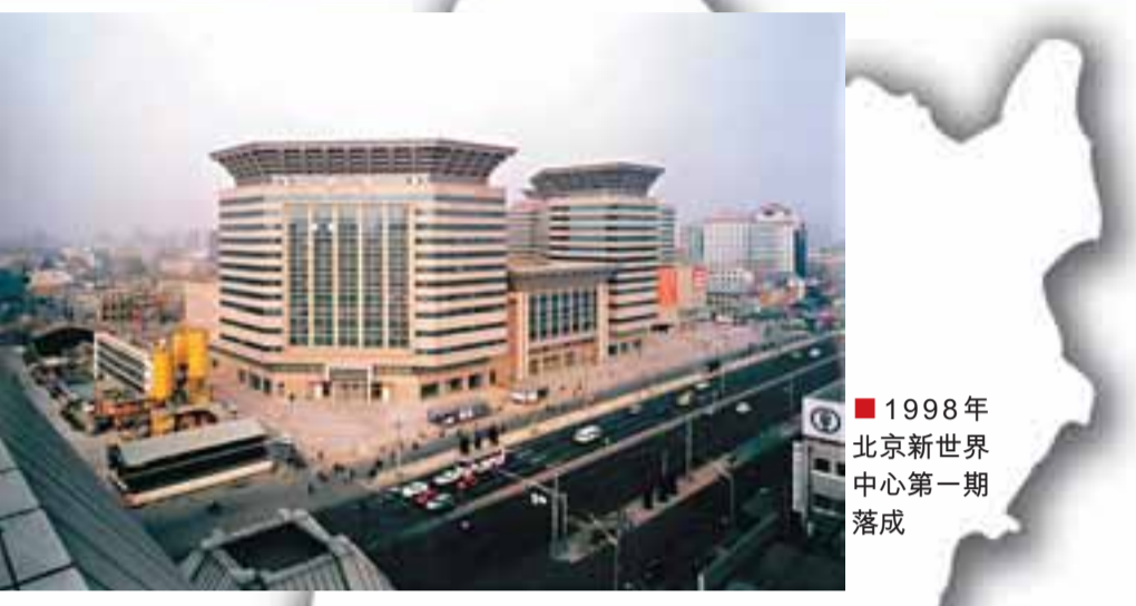
1998年北京新世界中心第一期落成