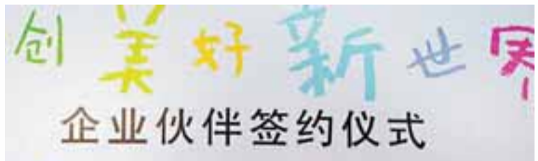
鄭志剛(右二)代表新世界中國地產與聯合國兒童基金會簽署三年伙伴合作計劃