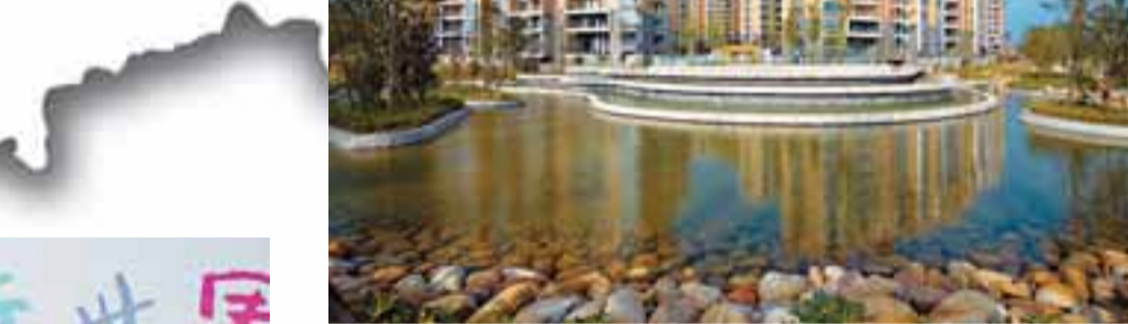
貴陽金陽新世界一期

經過了20年的蟄伏，新世界中國地產的全國性發展商品品牌逐漸得到了市場的認同。從2004年至今，新世界中國地產已在「中國房地產品牌價值TOP10」中連續4年名列十強。在2007年更以56億的品牌價值獲選為「2007海外在中國投資房地產公司領導品牌」；在所有香港及海外發展商中品牌價值名列首位。同期獲「2006中國藍籌地產企業」稱號，成為唯一入選的香港及海外發展商。此外亦於2007年榮獲「2007年最具社會責任獎」，同時於2007年及2008年榮獲「中國最佳企業公民獎」。