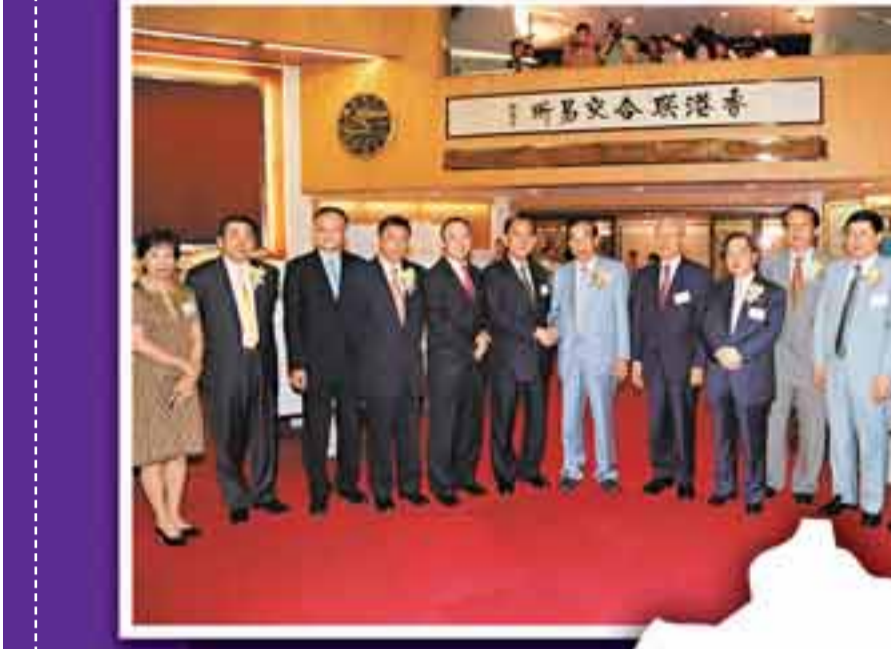
1999年7月新世界中國地產有限公司在香港聯合交易所上市