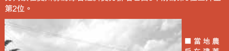
賓川白肋煙種植標準化示範區項目已被國家標準化管理委員會列為「第六批全國農業標準化示範區」。

當地農戶在建產標準晾房，一座標準的、建築材料較好的晾房建設需7000多元的投入。