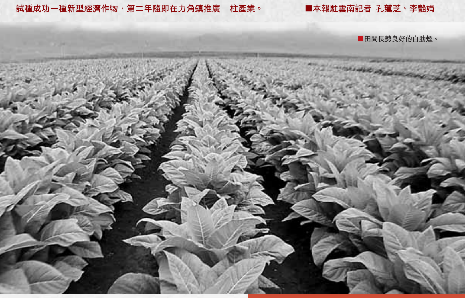
賓川白肋煙種植標準化示範區項目已被國家標準化管理委員會列為「第六批全國農業標準化示範區」。