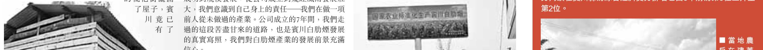
賓川白肋煙種植標準化示範區項目已被國家標準化管理委員會列為「第六批全國農業標準化示範區」。

讓記者頗感意外的是，成立近7年的賓川白肋煙公司是在倉庫辦公的，一種兩層的樓房，儘管經過改造依然看得出最初的倉庫模樣。但公司員工敬業務實的工作狀態卻給記者留下了深刻的印象。陪同記者採訪的公司生產部部長褚會非常詳細地介紹到每一家種植戶的種植情況，清晰地說出了有關煙水工程與晾房建設的數據，但竟