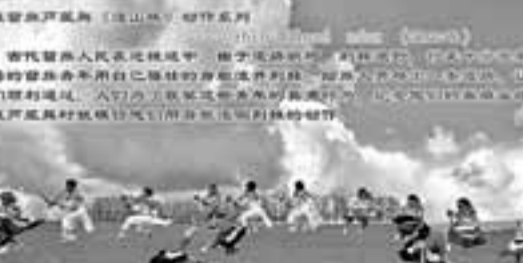
納雍苗族姊妹