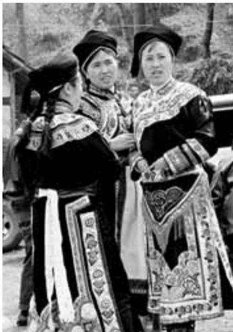
納雍苗族服飾

滾山珠源自苗族遠徙的故事。相傳，黔西北苗族從他鄉遷來這片熱土時，必經之處林深葉茂，荊棘叢生，智慧勇敢的苗家兒女便以身滾地，從荊棘叢中滾出了一條道路。