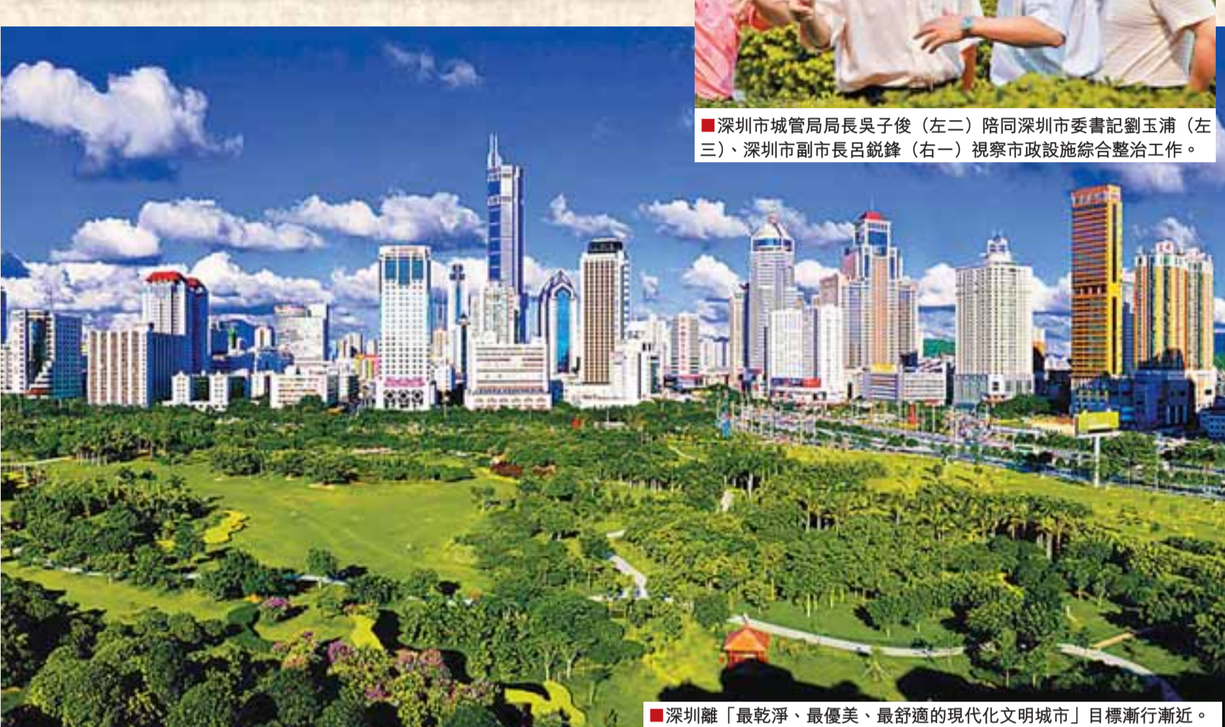
深圳離「最乾淨、最優美、最舒適的現代化文明城市」目標漸行漸近。