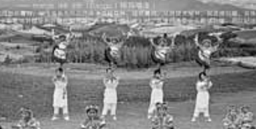
納雍苗族姊妹