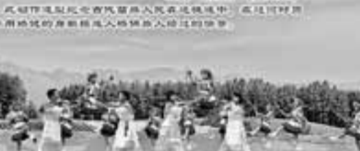
納雍苗族姊妹