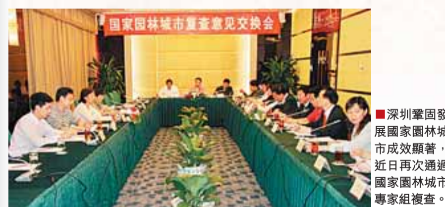
深圳鞏固發展國家園林城市成效顯著，近日再次通過國家園林城市專家組複查。