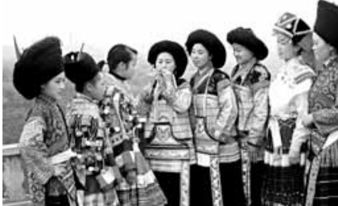
納雍苗族姊妹