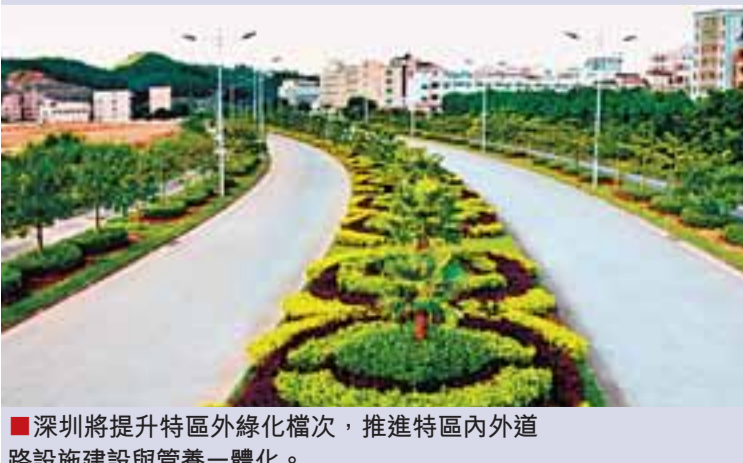
深圳將提升特區外綠化檔次，推進特區內外道路設施建設與管養一體化。

另外，深圳還將盡快制訂出台《深圳市綠化條例》，為全市綠化的規範管理奠定法律基礎。