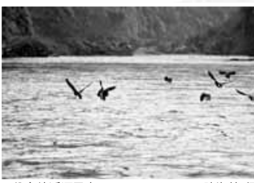
納雍總溪河風光