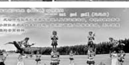
納雍苗族姊妹