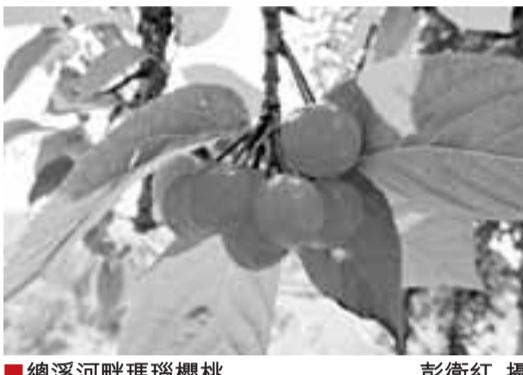
總溪河畔瑪瑙櫻桃