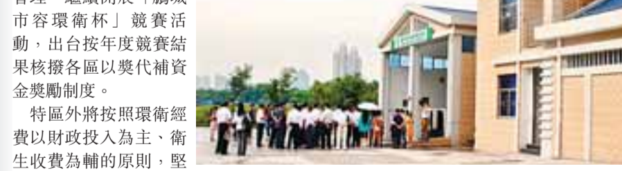
深圳已建成幾百座現代化的新型垃圾轉運站。