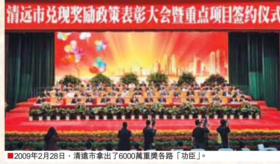
■2009年2月28日，清遠市拿出了6000萬重獎各路「功臣」。