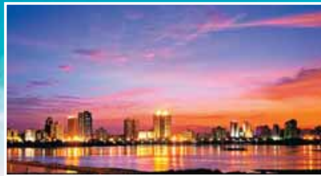
■中國優秀旅遊城市