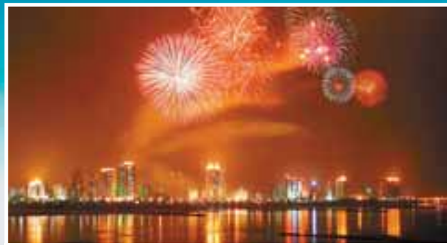
■中國生態休閒旅遊城市