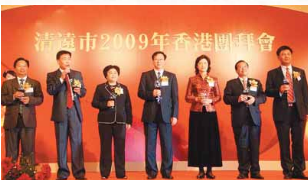
■在2009年新年團拜會上，陳家記書記、徐萍華市長率市四套班子成員，向在清遠投資的港澳企業家表示感謝！

初步統計，2008年全市實現生產總值746.6億元，增長18.4%，增幅高出全省0.3個百分點。其中第一產業增加值99.6億元，增長6.5%，第二產業增加值429.4億元，增長25.9%，第三產業增加值217.7億元，增長10.8%。人均GDP突破2萬元，增幅由上年的14.1：54.3：31.5發展到13.3：57.5：29.2，第二產業，尤其是工業對經濟增長的主導作用更加突出。