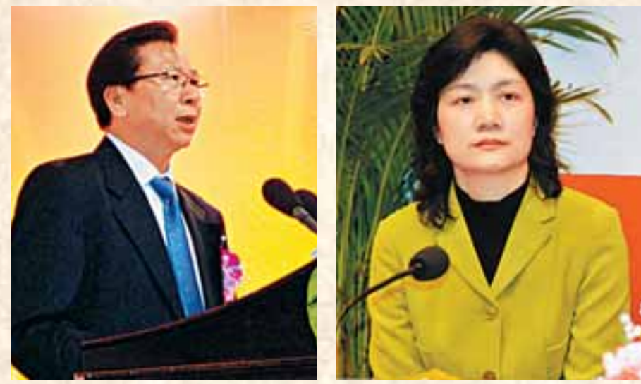
■清遠市委書記陳家記。 ■清遠市委副書記、市長徐萍華。