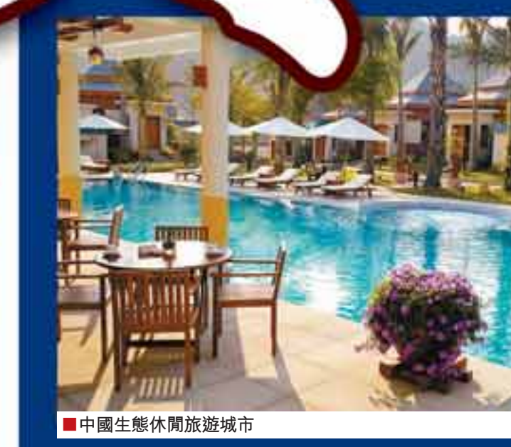
■中國生態休閒旅遊城市

五是嚴格落實工作責任制，實行績效評估、過錯追究、獎優罰劣制度，健全組織考核和群眾評議相結合的激勵約束機制，提高政府建設的公眾參與度。