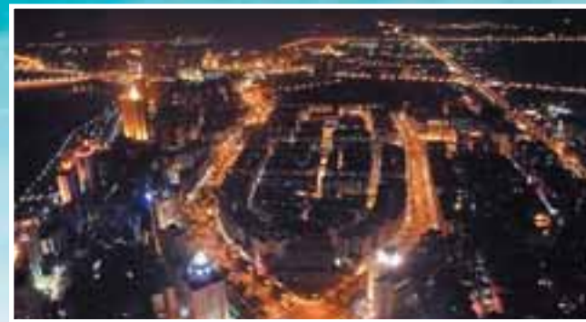
■中國生態休閒旅遊城市