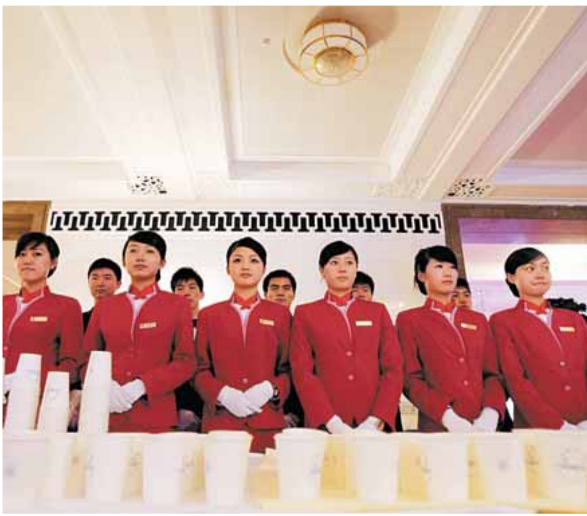
服務員正為參加人大二次會議的代表們準備茶水。

在嚴厲打擊嚴重刑事犯罪、從嚴查處嚴重職務犯罪方面，全國檢察機關以確保北京奧運會、殘奧會安全順利舉辦為重點，依法嚴厲打擊危害國家安全犯罪、涉恐、涉暴、涉黑、涉毒等嚴重刑事犯罪，走私、集資詐騙、非法吸收公眾存款等嚴重破壞市場經濟秩序犯罪，共批捕、起訴上述嚴重犯罪268,630人和287,813人。