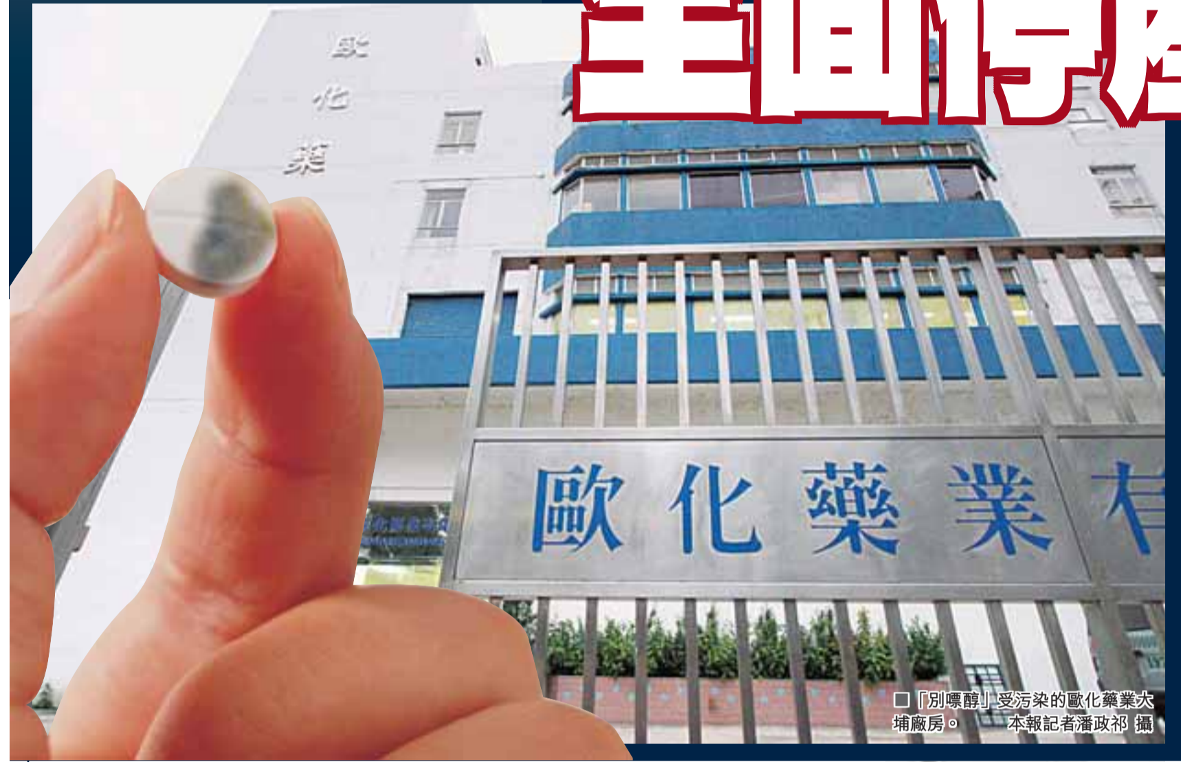
別嘌醇(受污染)的歐化藥業大埔廠房。