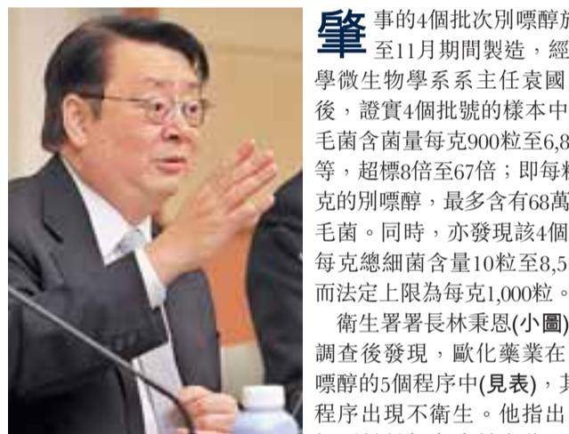
衛生署署長林秉恩(小圖)昨稱，調查後發現，歐化藥業在製造別嘌醇的各個程序中(見表)，其中一個程序出現不衛生。他指出，藥廠把原料打磨成粉末後再製成顆粒，顆粒在等待化學測試期間，放置在室溫攝氏25度至14天，因而滋生毛霉菌。他說：「如果放下一杯茶幾天不動它，自然會生菌，藥內有大量菌存在，即代表該藥不潔，品質不好。」不過他強調，法例沒有要求藥粉顆粒在完全消毒環境下處理，全球亦沒有指引，顆粒放置多久便要製成藥丸，「只有些廠快查好。」該廠廠有些藥粉顆粒在數小時內製成藥丸，只有這些16天內製成、至於別嘌醇為何放置至14天才製丸，他說要進一步調查。

【本報訊】(記者 李見安)歐化藥業生產的痛風藥「別嘌醇」(Purinol)驗出毛霉菌，每克含菌量超標最多達67倍。衛生署調查後，發現藥廠製造「別嘌醇」時，把藥粉顆粒放置在室溫長達5至14日，因此滋生毛霉菌，已通知藥廠全港回收。但毛霉菌危機並未完全消除，醫管局目前採用歐化旗下41種藥物，使用者涉及逾40萬人；而根據該局的新指引，除了新症、血痛及淋巴癌病人，現行病人毋須停用該41種藥。歐化藥業晚上發表聲明表示，已主動聯絡公立醫院、私家醫院、私家醫生及零售藥房回收別嘌醇，為解除公眾疑慮，藥廠更會暫停生產及銷售所有藥物，直至衛生署再有另行發布。