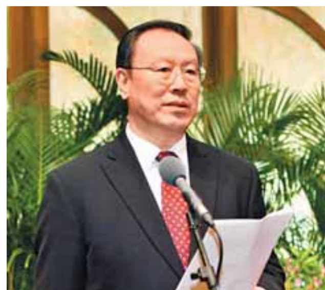
■全國政協副主席、中央統戰部部長杜青林在招待會上致辭。

【本報兩會報道組北京9日電】僅有13名代表的全國人大台灣代表團毫無疑問是35個代表團中最「迷你」的，下午開