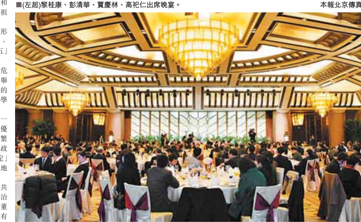
■全國政協辦公廳、中央統戰部舉行招待會，招待港港澳區全國政協委員。