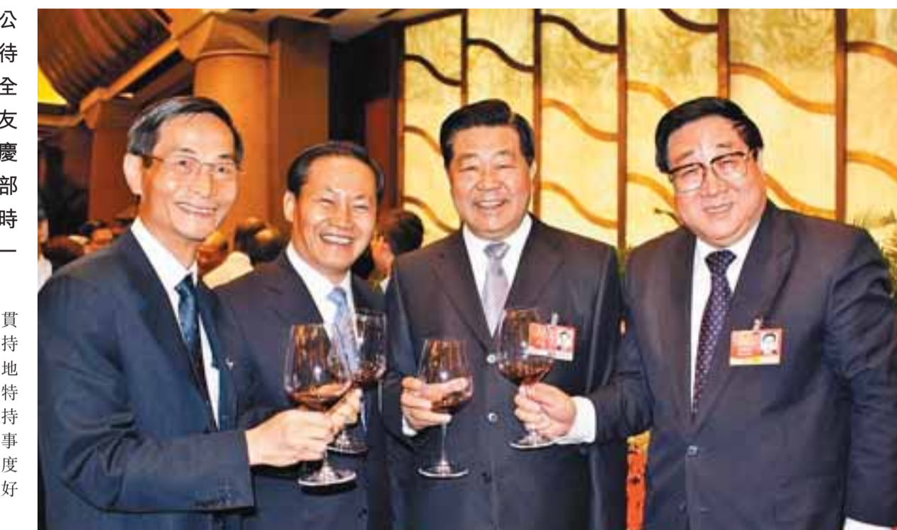
■(左起)黎桂康、彭清華、賈慶林、高仁仁出席晚宴。

【本報兩會報道組北京9日電】全國政協辦公廳、中央統戰部今晚假釣魚台國賓館舉行招待會，招待出席全國政協11屆2次會議的港澳區全國政協委員及家屬，逾300人歡聚一堂，共敘友情。中共中央政治局常委、全國政協主席賈慶林出席了晚宴。全國政協副主席、中央統戰部部長杜青林受賈慶林委託，在招待會上致辭時指出，今年是港澳地區應對金融危機的關鍵一年，但中央對香港、澳門的前途充滿信心。