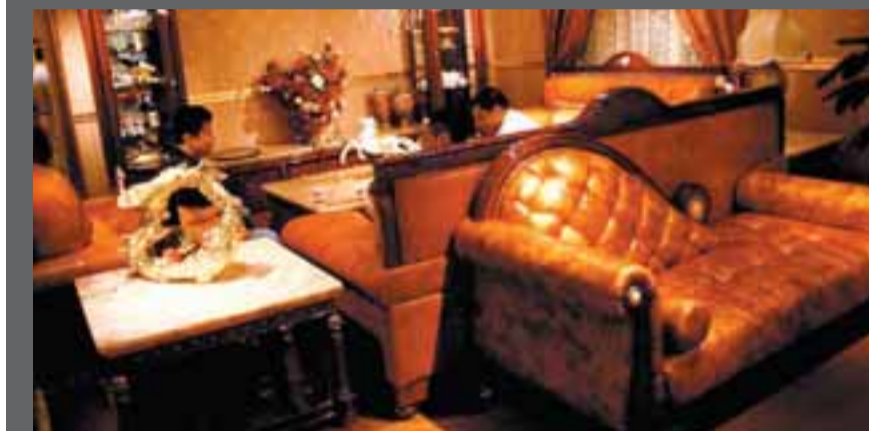
■東莞港企的傢具、服裝、玩具等產品的內銷市場有望繼續擴大。