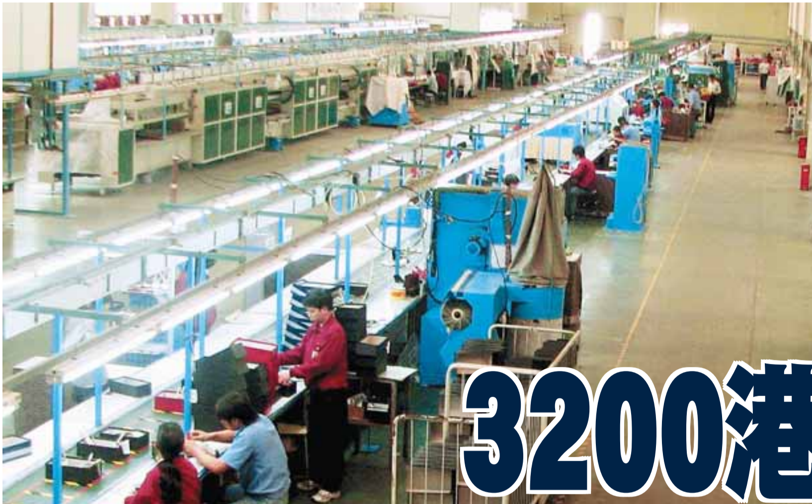
■部分珠三角港資企業開工不足，生產線處於半停頓狀態。