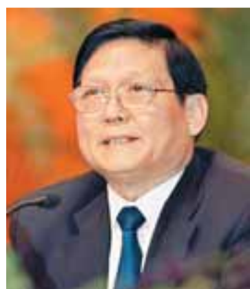
北京市委書記 劉淇