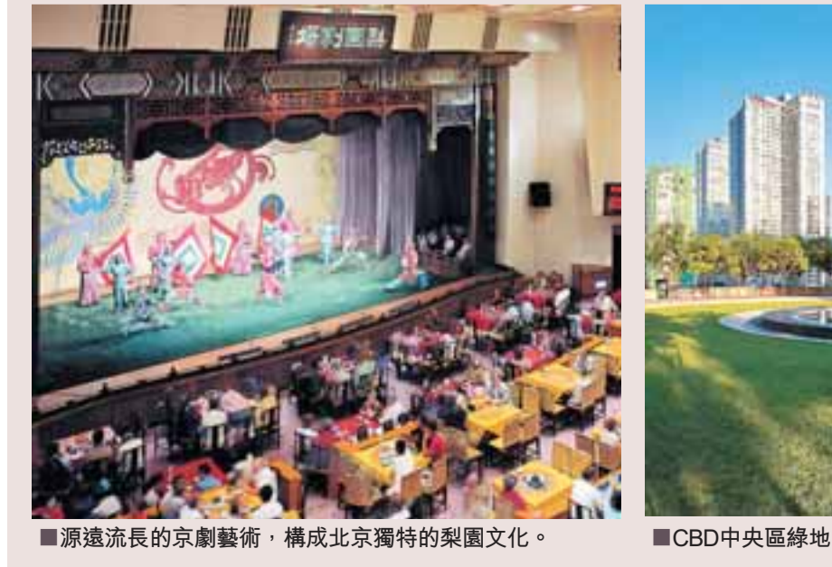
源遠流長的京劇藝術，構成北京獨特的梨園文化。