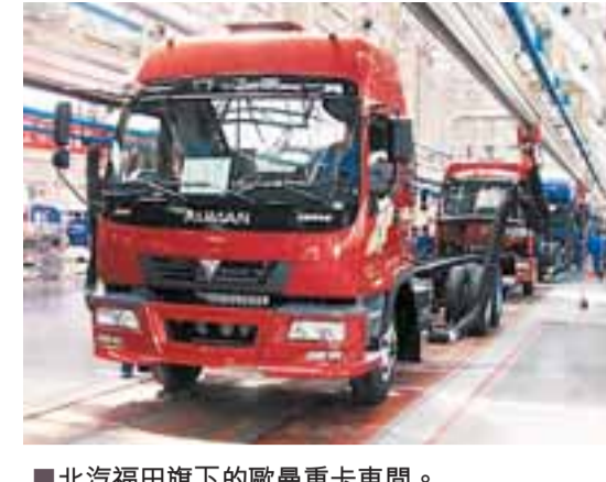
北汽福田旗下的歐曼重卡車間。