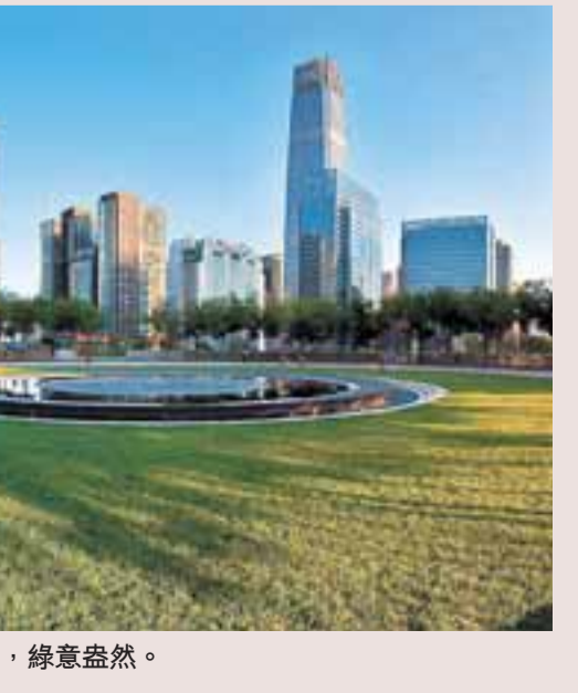
CBD中央區綠地，綠意盎然。