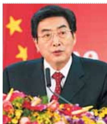
北京市市長 郭金龍

北京市領導名單 市委書記：劉淇 市長：郭金龍 市人大主任：杜德印 市政協主席：陽安江 市委副書記：郭金龍、王安順 副市長：吉 林、蔡赴朝、劉敬民、苟仲文、黃 衛、丁向陽、陳 剛、程 紅、夏占義