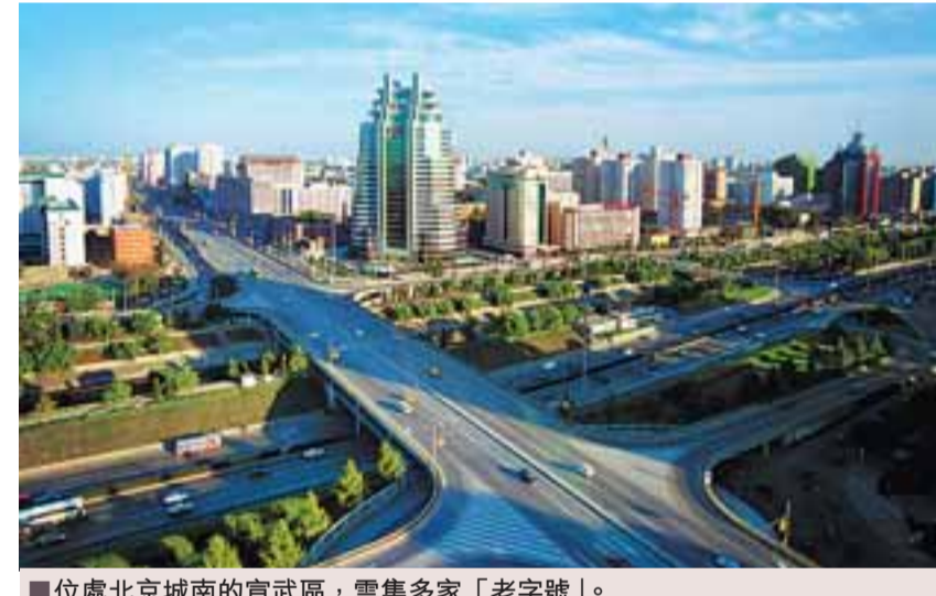
位處北京城南的宣武區，雲集多家「老字號」。

千六億與基建 主打軌道交通 為促進投資增長，北京市已制定29條具體措施，今明年政府計劃投資1,400億元，預計由此可帶動社會投資1萬億元。2009年北京市政府固定資產投資計劃安排305億元，重點向以軌道交通建設為主的基礎設施建設傾斜，向以改善民生為核心的公共服務領域傾斜，向新城、南城、西南部地區、生態園發展區和新農村建設傾斜。