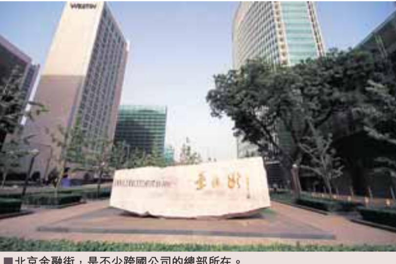
北京金融街，是不少跨國公司的總部所在。