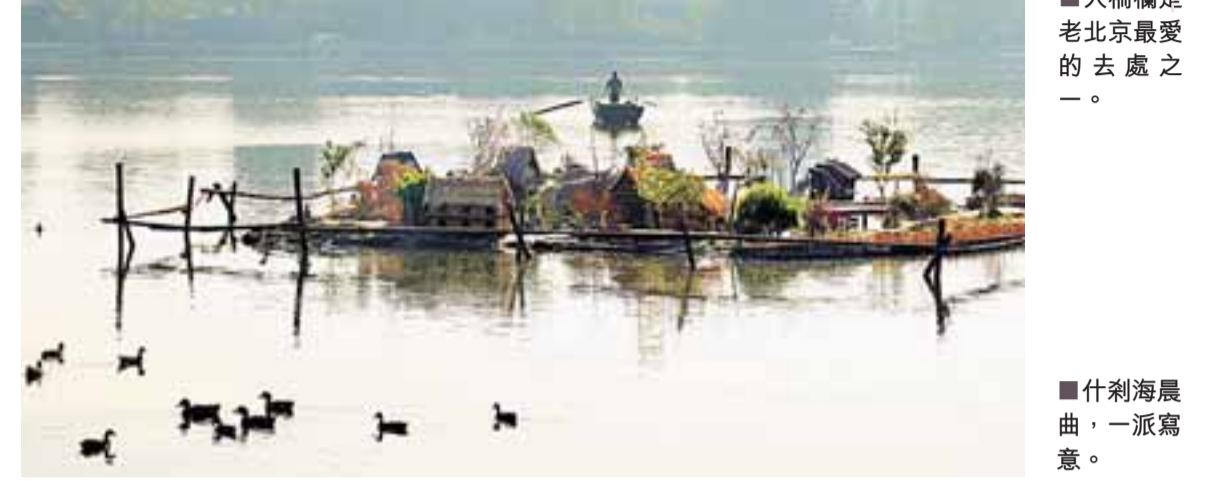
什刹海晨曲，一派寫意。

新年伊始，北京市政府即對外公佈，2009年北京市擬辦57件重點實事，涉及市民關注的住房、醫保、交通、空氣質量、教育、食品安全、就業、社保、奧運場館利用等多個方面。此外，還將安排補貼資金171.3億元，加大對城市公用企業和居民生活必需品儲備的補貼力度，降低市民出行、採暖、用氣、用電等生活成本。 據悉，2009年，北京市財政將繼續加大對民生領域的投入，其中，教育投入141.7億元，同比增長8.8%；衛生投入44.8億元，同比增長9.1%；文化投入17.3億元，同比增長8.1%。北京市還將初步完成本市「社會保障卡」工程，基本實現就醫實時報銷。全年社會保障和就業支出將達69.6億元。