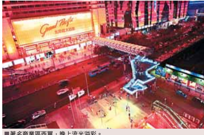
著名商業區西單，晚上流光溢彩。