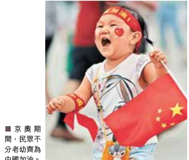
京奧期間，民眾不分老幼為中國加油。