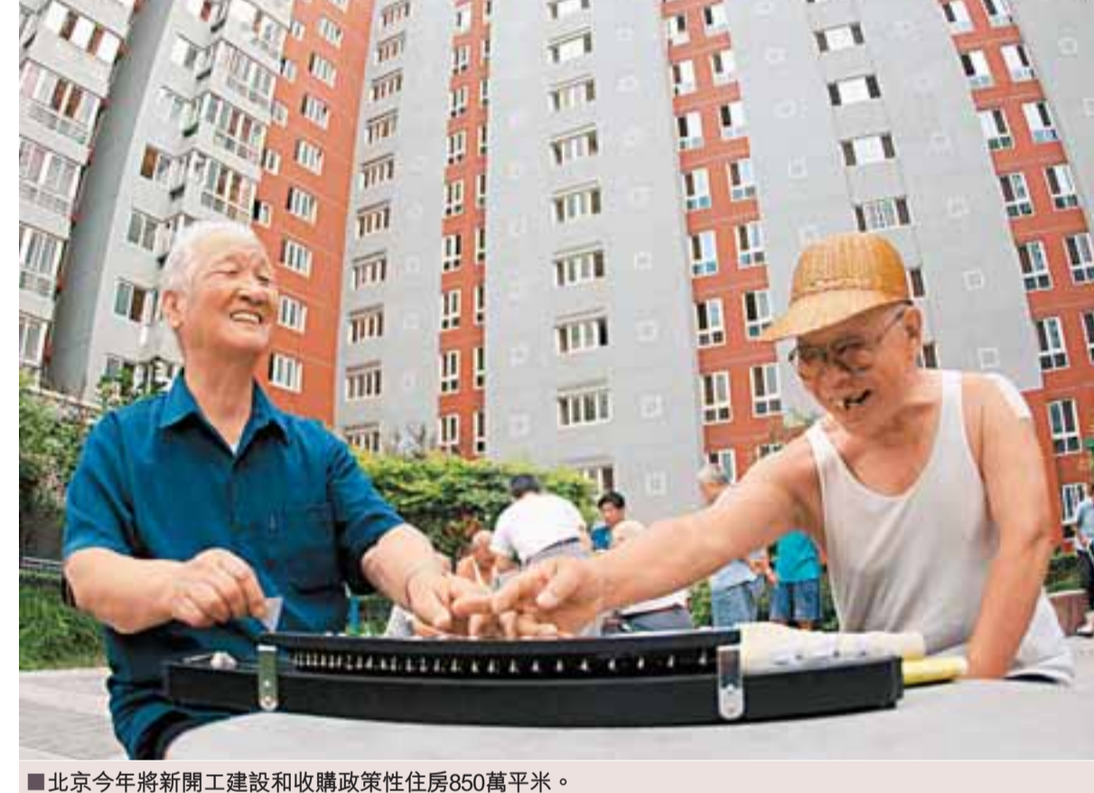
北京今年將新開工建設和收購政策性住房850萬平米。

新年伊始，北京市政府即對外公佈，2009年北京市擬辦57件重點實事，涉及市民關注的住房、醫保、交通、空氣質量、教育、食品安全、就業、社保、奧運場館利用等多個方面。此外，還將安排補貼資金171.3億元，加大對城市公用企業和居民生活必需品儲備的補貼力度，降低市民出行、採暖、用氣、用電等生活成本。 據悉，2009年，北京市財政將繼續加大對民生領域的投入，其中，教育投入141.7億元，同比增長8.8%；衛生投入44.8億元，同比增長9.1%；文化投入17.3億元，同比增長8.1%。北京市還將初步完成本市「社會保障卡」工程，基本實現就醫實時報銷。全年社會保障和就業支出將達69.6億元。