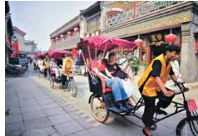
大柵欄是老百姓最愛的去處之一。