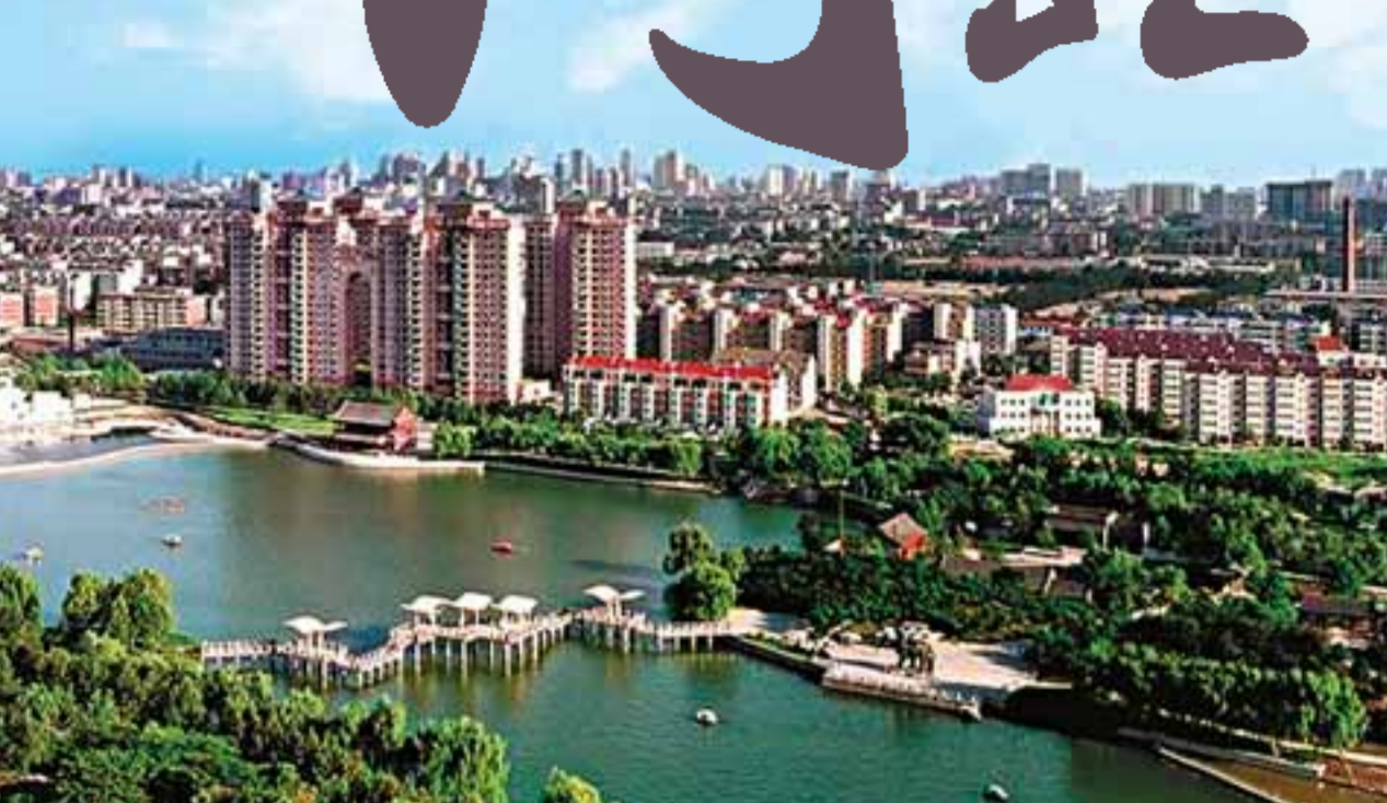
■河北省會石家莊市。