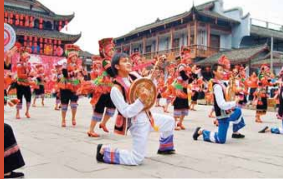
■首屆中國成都國際非物質文化遺產節