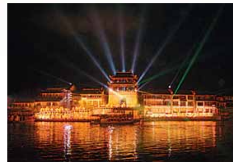
■黃龍溪國際古鎮風情節大型水上實景晚會