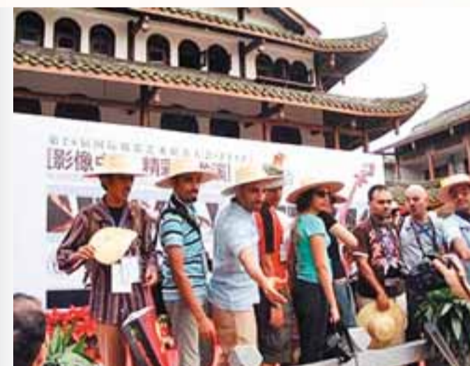
■第28屆菲亞普攝影大賽