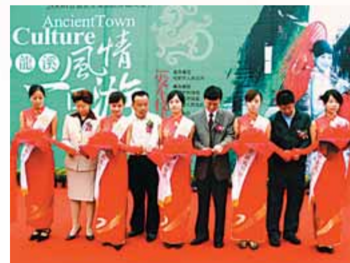
■風情節一日遊發車儀式