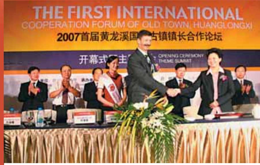
■黃龍溪國際古鎮鎮長合作論壇開幕式暨主題峰會