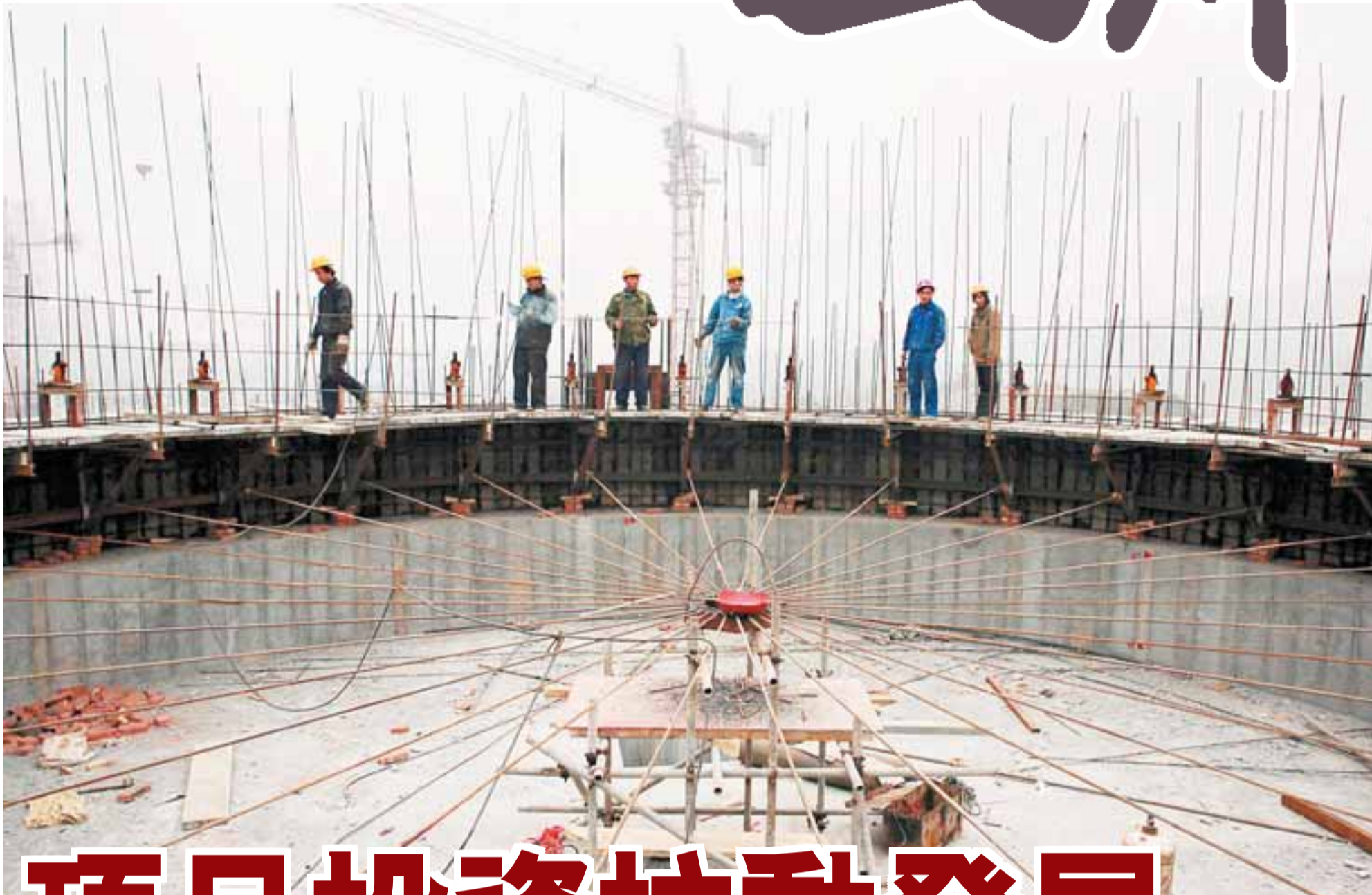
■四川省正加快災後重建步伐，力爭今年完成重建任務的72%。

大震災、汶川大地震、國際金融海嘯接踵來襲……辭別不平凡的2008年，巴蜀大地上又打響了一場「保增長、保民生、保穩定」的攻堅戰。今年，四川省將抓住災後重建、擴大內需、西部大開發三大機遇，以500個重大項目為引擎，加快建設災後美好家園，打造西部經濟高地。 ■本報駐四川記者 張旗、刁繼成、宋濤、聶偉