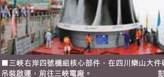
■三峽右岸四號機組核心部件，在四川樂山大件碼頭順利吊裝啟運，前往三峽電廠。

最新統計資料顯示，08年四川省規模以上工業企業共11,946戶，實現規模以上工業增加值4,939.3億元，增長17.9%。其中，裝備製造業為1,879戶，08年，他們的工業總產值為2,033億元，銷售收入1,958億元，上繳稅利192億元，實現利潤達109億元，對全省GDP的貢獻率為21.2%。