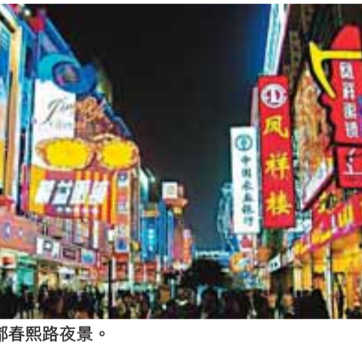
■繁華的成都春熙路夜景。

抵禦國際金融海嘯，擴大內需主要靠擴大投資。為此，四川省委、省政府明確提出，當前各項工作要服從服務於「止滑提速、爬坡上行」這個當務之急，須通過投資拉動，項目牽引，達到擴大內需、促進經濟增長的目的。 今年以500個重大項目為引擎，強力推進「兩個加快」這一圍繞擴大投資的決策，就成為了四川拉動增長的助推劑。這動力十足的500個重大項目，包括重大基礎設施、重大產業、重大民生和社會事業三大類，總投資21,591億元，年度計劃投資2,805億元。