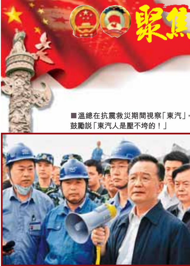
■溫總理在抗災救災期間視察「東汽」，鼓勵說「東汽人是壓不垮的！」