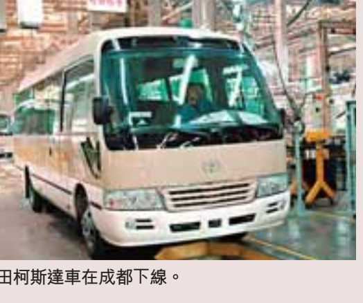
■豐田柯斯達車在成都下線。

四川省委、省政府今年在以500個重大項目為引擎，強力推進「兩個加快」的同時，還提出了打造「一樞紐、三中心、四基地」，以顯著提升四川產業競爭力、要素轉化力、市場競爭力及區域帶動力的「一樞紐」，就是要建設貫通南北、連接東西、通江達海的西部綜合交通樞紐，優先安排各類出川大通道。「三中心」是建設西部物流、商貿、金融三大區域性中心。「四基地」着力建設重要戰略資源開發基地、現代加工製造業基地、科技創新產業化基地、農產品深加工基地等四大基地。