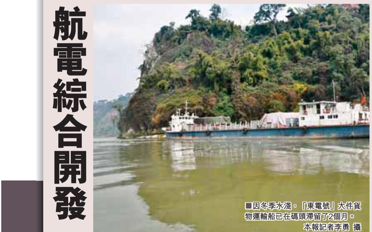
■因冬季水淺，「東電號」大件貨物運輸船已在碼頭停泊了2個月。

涉及40分項101小項 將深入實施的「八項民生工程」，條條明晰，句句貼心：全省城鎮新增就業62萬人；解決20萬農村絕對貧困人口溫飽問題；改善60萬農村低收入貧困人口生產生活條件；建設改造400所留守兒童寄宿制學校的教學用房和學生宿舍；全省新型農村養老保險試點覆蓋範圍達到20萬人；新型農村合作醫療制度覆蓋176個縣(市、區)；解決2.5萬農村特困無房戶和受災群眾住房困難；解決2萬戶民族地區特困農牧民住房困難；綜合治理水土流失面積1,200平方公里；解決240萬農村人口飲水安全等。