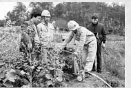
灌氣保苗，四川電力服務在田間地頭。