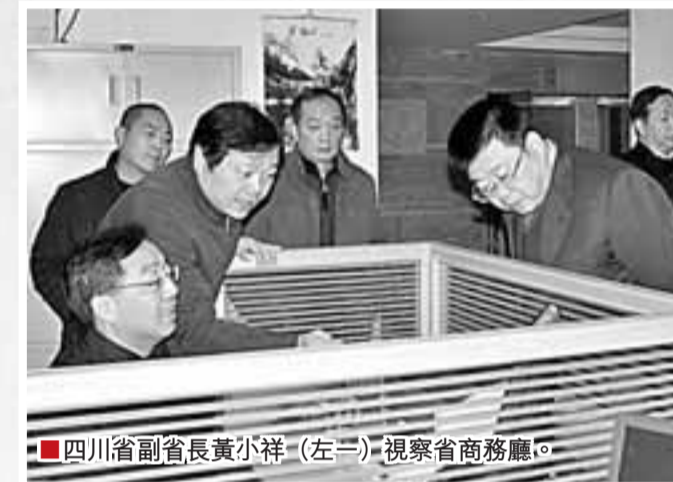
四川省副省長黃小祥(左三)視察省商務廳。

2008年，世界金融和經濟形勢風雲突變，美國次貸危機引爆了一場席捲全球的金融危機，世界各國經濟如多米諾骨牌紛紛傾倒。中國以擴大內需作為保增長之根本途徑應對金融危機。經濟下滑成為四川省經濟發展中最主要的矛盾。長期制約經濟發展的體制性、結構性矛盾依然存在，同時又面臨特大地震災害和國際金融危機帶來的巨大壓力，經濟下行風險加大。如何最大可能降低金融危機的影響，同時提升經濟發展質量爬坡上行，是當前四川經濟面臨的最大課題。 ■本報記者 宋 濤