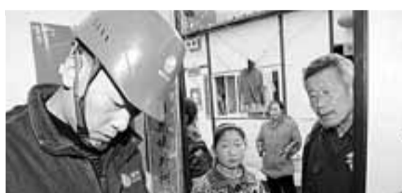
全力為災民、板房過暖冬。

災難錘煉勇氣，信心鑄就輝煌。2009年，四川電網不僅要「扭虧為盈」，還要以發展的加速度融入四川「兩個加快」的脈動——投資。在連續3年投資超100億元基礎上，今年安排電網投資180億元，開工建設110千伏以上輸變電項目222個，着手打造多條電力「出入川」新通道，構築新的能源「高地」；實現四川與西北聯網；確保向家壩—上海、錦屏—蘇南輸電項目四川境內工程順利推進；完成雅安—綿陽—荊門工程前期……災後恢復重建。確保板房群眾用電，積極推進映秀灣發電總廠恢復工作。力爭6月底前實現映秀灣電站全面恢復運行；年底前實現漩子溪電站首台機組恢復發電；全力加快取電站恢復；加快災後重建小型基建項目實施步伐。此時的映秀灣，決戰仍在繼續，高高的二台山作證：四川電力人經得起挑戰與考驗！