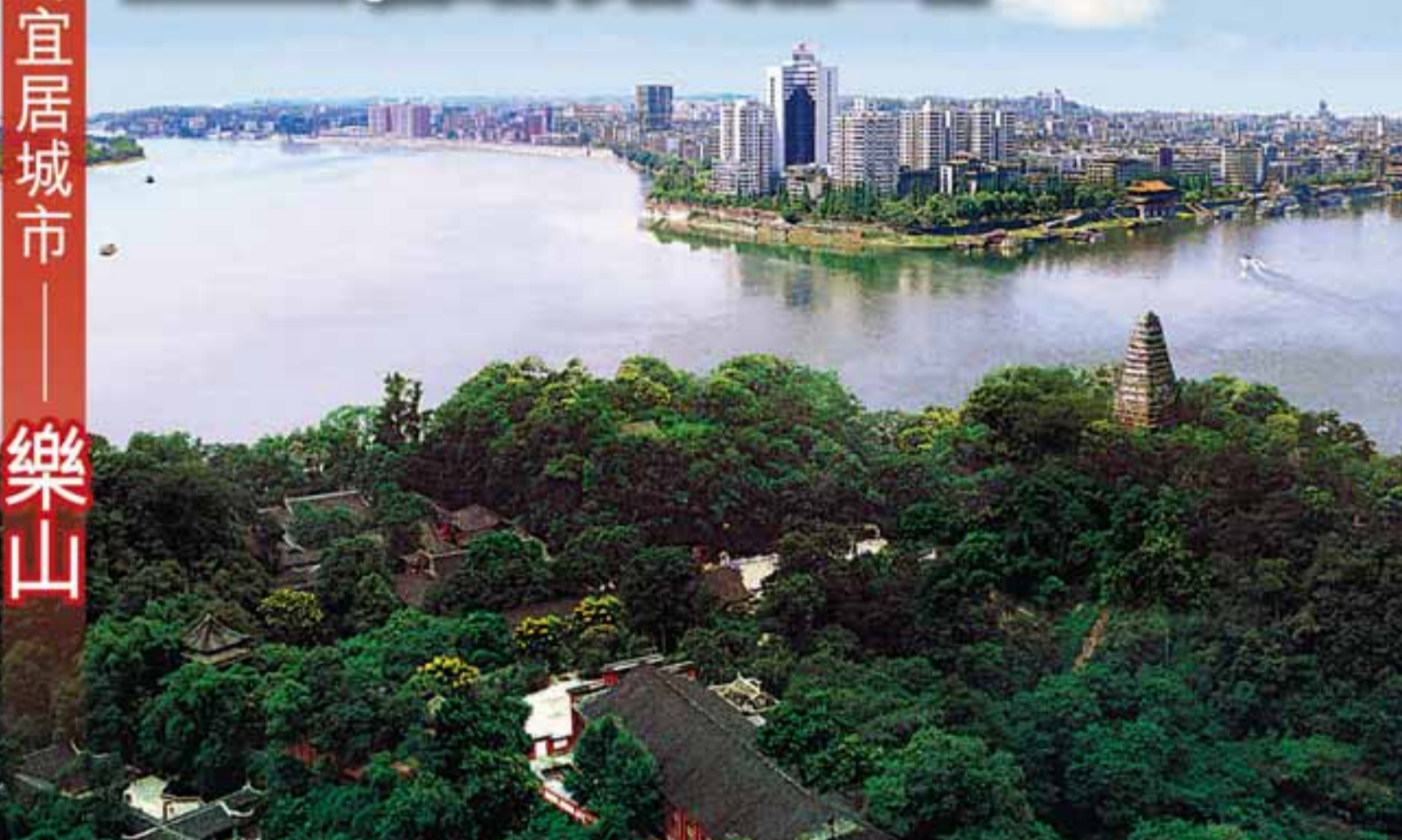
■岷江、青衣江、大渡河三江匯流處的樂山城。