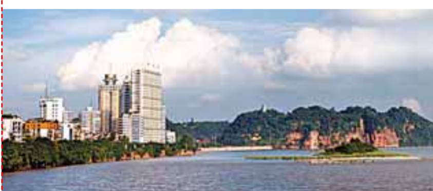
■與佛爲伴，臨江而居。