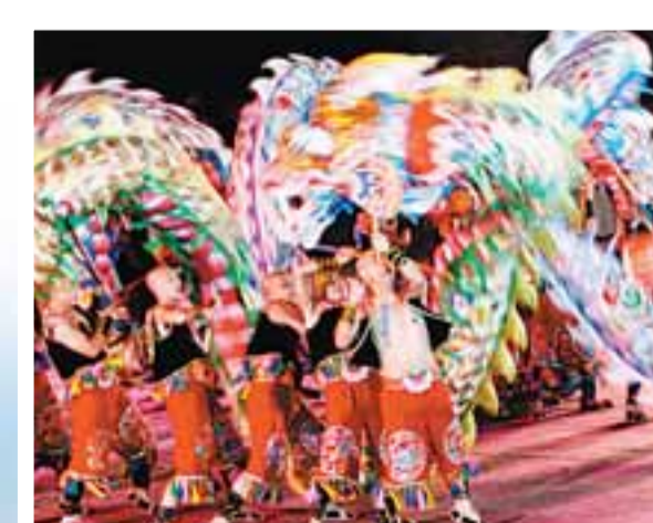
具有十分傳統特色的市民文化活動。