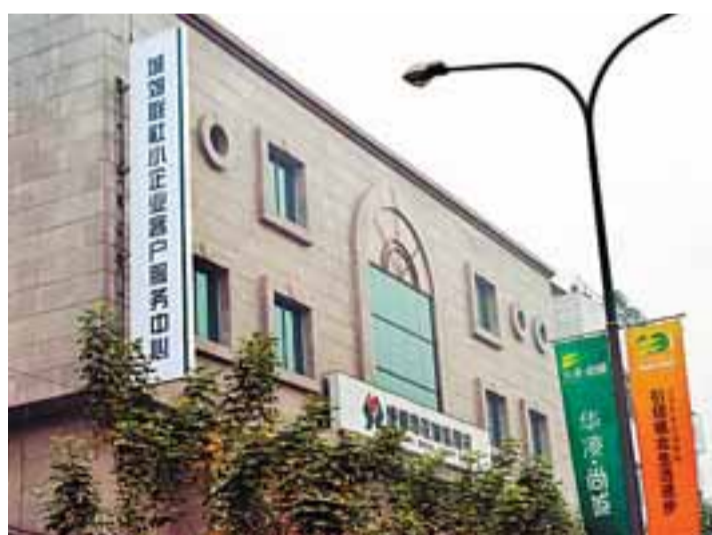
■成都市農村信用聯社網點遍佈全市城鄉。