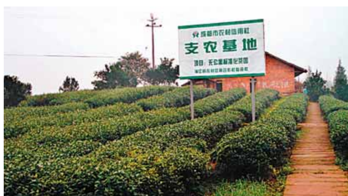
■成都市農村信用聯社大力支持成都城鄉統籌實驗區建設。

新時期，新階段，新發展。成都市農村信用合作聯社股份有限公司在新的機遇和挑戰面前，迎難而上，攻堅破難，邁步美好未來！