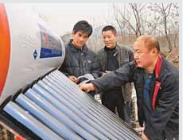
太陽能「下鄉」 山東樂莊啟動農村太陽能普及工程，技術人員在為農戶安裝太陽能熱水器。

目前園方已聯繫了死者家屬，並已將咬人的老虎禁閉。為防止類似事件再次發生，動物園方面正考慮加強防護。