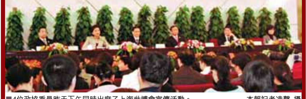
4位政協委員昨下午同時出席了上海世博會宣傳活動。