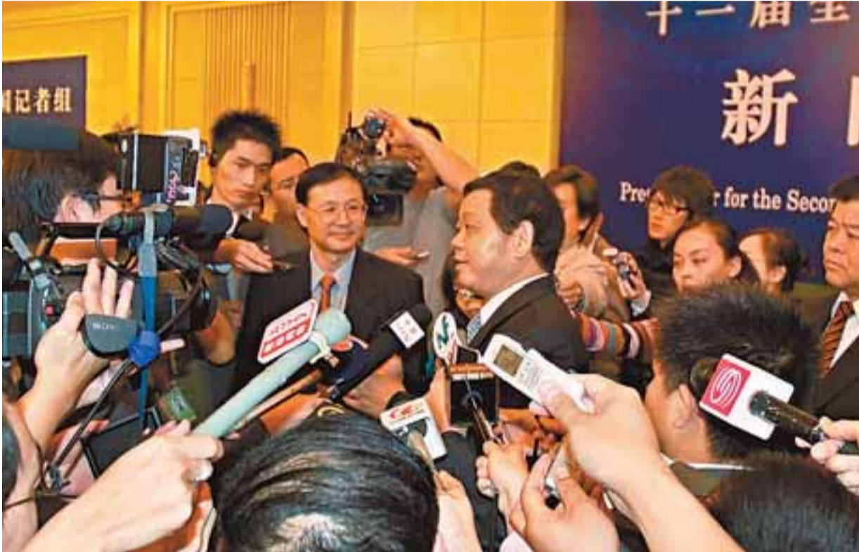
深圳市市長許宗衡在集體採訪結束後，仍然被傳媒圍堵採訪。

許宗衡表示，深圳下一步將會加大住房的結構調整，對土地要實行有效供給，並依法引導房地產市場健康發展，同時加快社會保障體系的建設。