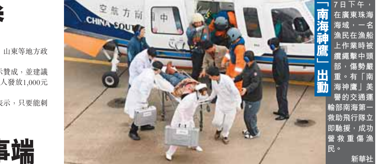
7日下午，在廣東珠海海灣，一名漁民在漁船上作業時被纏網擊中頸部，傷勢嚴重。有「南海神龍」美譽的交通運輸部南海第一救助飛行隊立即馳援，成功營救重傷漁民。

【本報訊】據《廣州日報》8日報道：7日，廣州市天河區發生一起罕見交通意外，一名女乘客登上一輛288號巴士時投了10元，並要求司機找回6元。司機拒絕，女乘客便要求打開投幣箱找錢。「我肯定不同意吧！」巴士司機趙先生說。該女乘客不肯罷休，一直站在司機旁與他爭吵，推搡，女最後更奪過方向盤，車頭一定，巴士猛地衝向馬路中間的防護欄，滑行了近30米後才停下來，衝擊力將10個鐵閘撞斷連欄鐵起。車上當時載有四五十名乘客，但只有司機受傷。