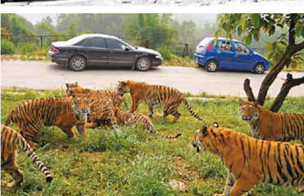
事發後，園內老虎被關回籠裡。