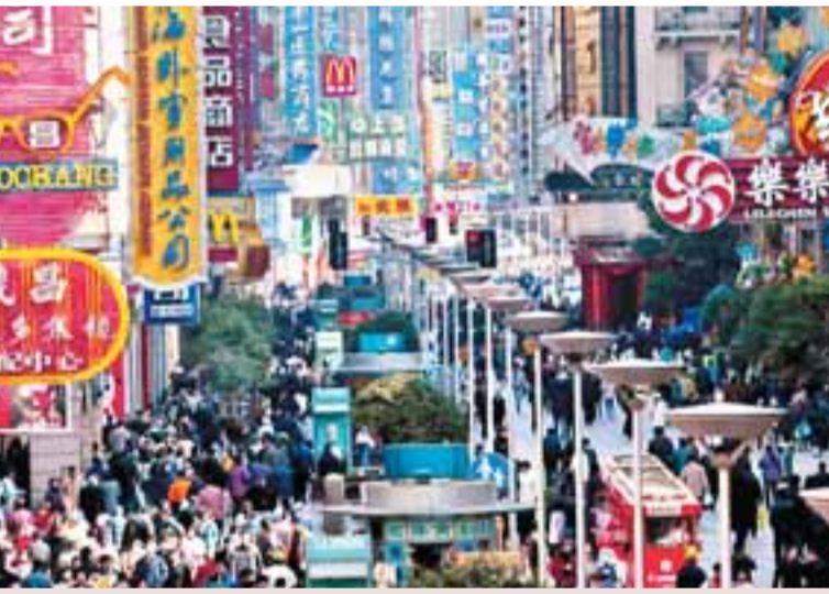
■上海著名商業步行街南京路上一派熱鬧。