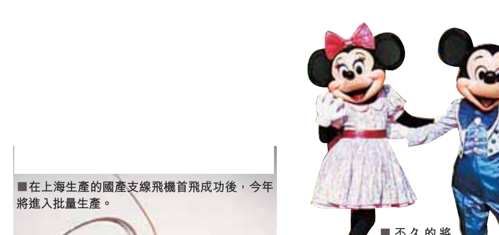
■不久的將來，米奇老鼠將在浦東安家。