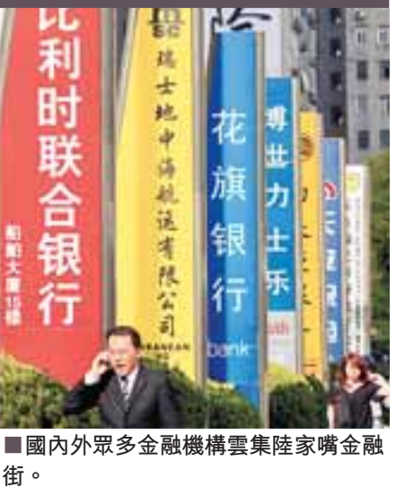
■國內外眾多金融機構雲集陸家嘴金融街。

浦東綜合配套改革今年的重點，是在先進製造業和現代服務業突破發展的制約和瓶頸上找出新路子。上海市政府法制辦等部門已傳出消息，10餘項行政性收費將於近期停徵，試點再次放在浦東。去年8月1日，浦東首批停止徵收62項行政事業性收費，此次10餘項收費項目，因涉及市財政，在獲得各委辦局支持後也將實行。