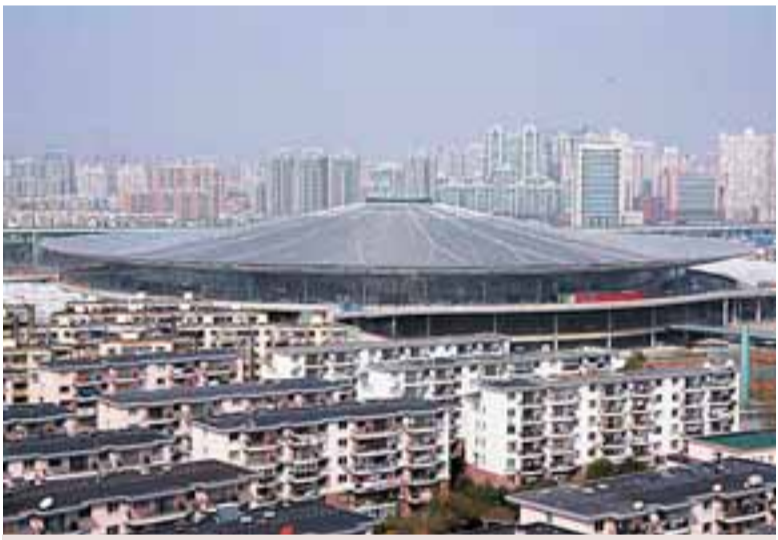
■上海鐵路南站是世界最大的圓頂透光火車站。

「上海將以國際金融、航運中心建設作為突破點，在今年第一季度就會有相關突破性政策出台；「世博會是一個很好的拉動，迪士尼項目對我們的預期也是一個很好的推動。對於上海經濟走出低迷的路徑，上海市委書記俞正聲和市長韓正給出了上述答案。