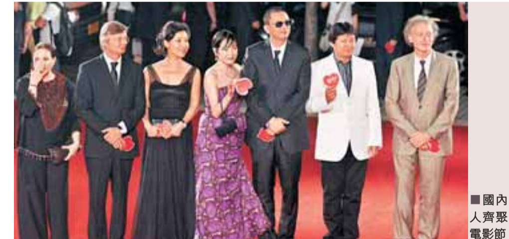
■國內外著名影人齊聚上海國際電影節。