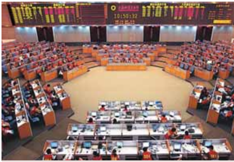
■上海期貨交易所近期獲得了鋼材期貨的「上崗證」。