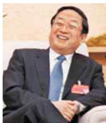
上海市委書記 俞正聲