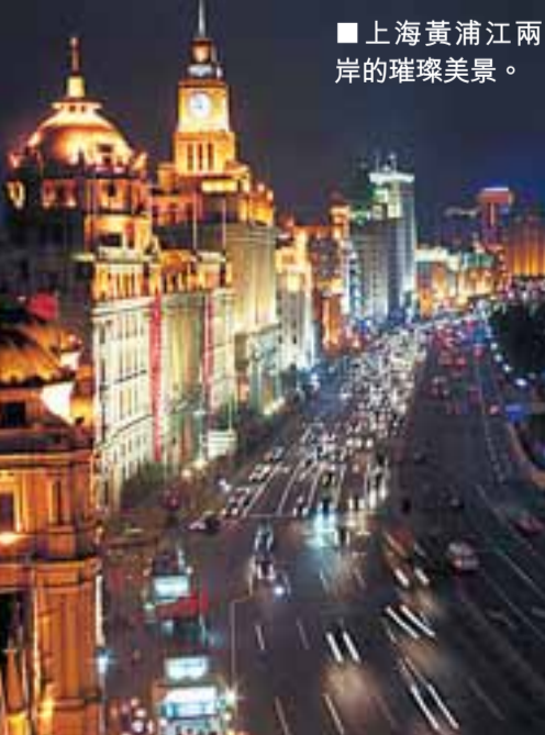
■上海黃浦江兩岸的璀璨美景。