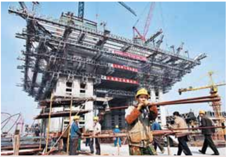
■世博工程建設進入高潮。