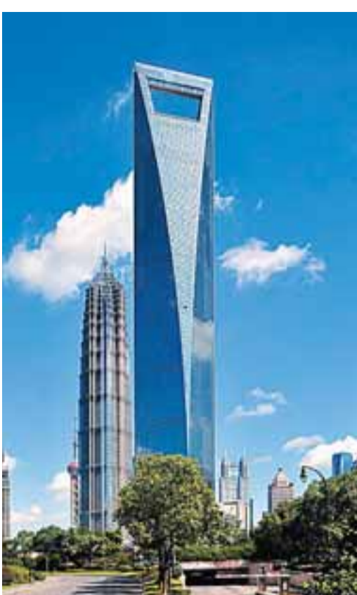
■上海環球金融中心。

據悉，在全國刺激經濟的四萬億計劃中，上海也將有「大動作」。市長韓正在上海人大做補充報告時透露，為保證經濟增長，當地將採取抓重大產業項目等六大措施，包括提前實施「十二五」期間(2011年至2015年)的部分符合規劃的基礎設施項目，預計總投資在1,700億元左右。