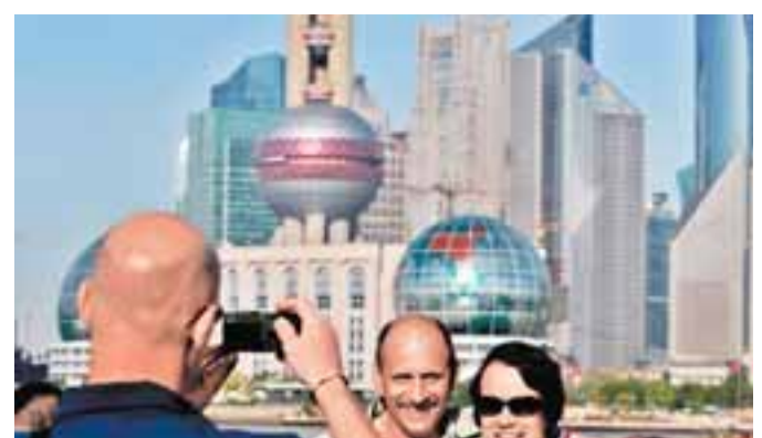
■上海吸引了大量國外遊客。