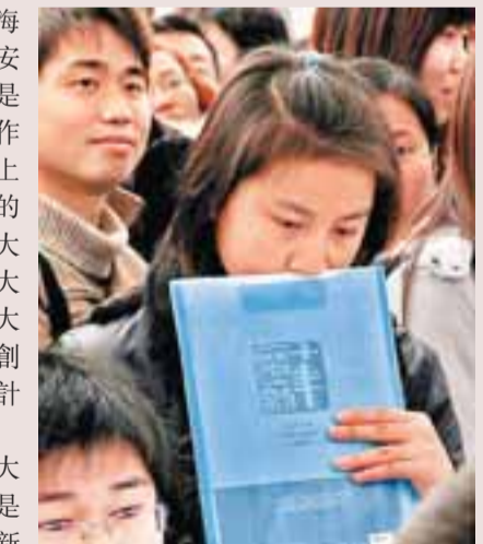
■今年，上海有15.8萬高校畢業生面臨就業。

在一系列措施中，大學生創業「零首付」是上海最受關注的「新政」，即「畢業兩年內的高校畢業生投資設立註冊資本50萬元以下的有限責任公司「零首付」註冊」。到2月13日為止，上海已有8名大學生創立的6家公司通過這種方式領取了營業執照。副市長屠光紹則承諾：畢業生如果「不挑不揀」，能夠保證他們實現全部就業；而上海全市09年的目標則是將失業率控制在4.5%以內。