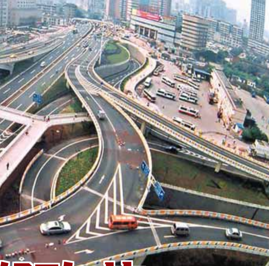
■重慶今年投入70億元人民幣用於城市交通大提速。