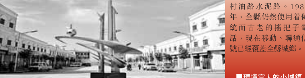
■環境宜人的小城鎮

治、X光定位下骨科手術、微創手術等27個診療項目在鄉鎮衛生院得到普及。縣級衛技人員專科以上學歷、鄉級人員中專以上學歷者, 率達到100%, 縣鄉兩級共有衛技人員512人, 其中高級職稱9人, 中級職稱168人。 文化事業日益繁榮。建成了高標準的現代化的文化活動中心, 全縣10個鄉鎮文化中心也相繼投入使用。全縣現有文學刊物《西山文苑》、《鄉寧博覽》2種, 文化市場逐步繁榮。全縣90%以上學生達到國家學生體質健康標準。2008年6月由省文化廳牽頭組成的「山西省農村流動書庫」為全縣160個村委建圖書室並送書48000冊, 為縣圖書館配置一輛圖書圖書車, 極大地改善了圖書條件。 環境保護成效顯著。先後關閉污染嚴重企業50多家, 改造煤礦130餘座, 取締土小磚窯、石灰窯、土焦高爐230餘家, 並於1998年關閉了轄區內所有土焦、改良焦。鄉寧縣緊鑼密鼓藍天碧水工程, 以和諧宜居為目的, 以生態文明為理念, 以節能減排為重點, 重拳出擊, 科學治理, 一手抓治污, 一手抓綠化, 傾力推進山川秀美鄉寧建設進程。 道路通訊暢通便捷。鄉寧縣先後架通了黃河大橋, 打通了斷山嶺隧道, 構建起了便捷通暢的交通網路, 10個鄉鎮全部通公路, 125個建制村實現村村通。今年規劃建設32條村村通公路, 兩年內全部實現村村通水泥路。1989年, 全縣仍然保持着傳統而古老的搓子電話, 現在移動、聯通信號已經覆蓋全縣鄉鎮。