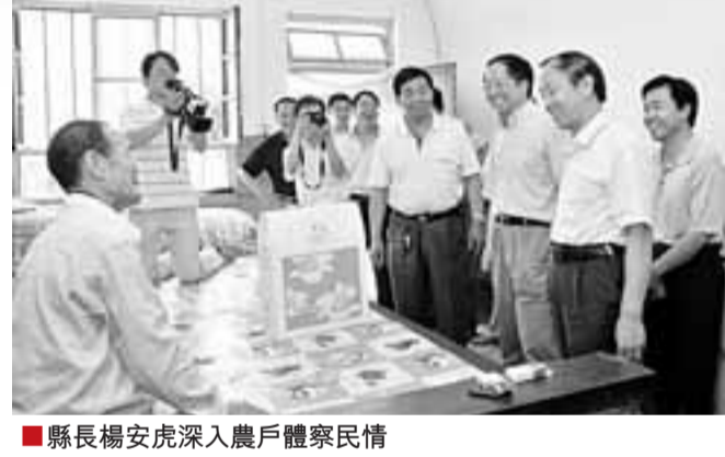
■縣長權安虎深入農戶體察民情