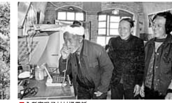
■全縣實現了村村通電話

■小花椒做成大產業 鄉寧縣委、縣政府多方籌集資金, 不斷加大基礎建設力度, 全縣城鄉面貌煥然一新。經多年建設, 鄉寧縣城已發展成為一座擁有城市人口近10萬、城區面積10平方公里的臨汾西山明珠城市。全縣城鎮化率也由1978年的12.73%增加到2008年的26.03%。 城鎮建設步伐加快。1978年全縣城區道路長1.42千米, 面積2.2萬平方米。1991至1996年, 完成29條巷道硬化, 1999至今先後改造了明珠大橋、連心橋、鄂河大橋, 架通了幸福橋、水利橋、迎地大橋和印台橋, 城區面積由1978年的0.0683平方公里增加到如今的10平方公里。 小城鎮建設成績顯著。1978年以前, 全縣各鄉鎮小城鎮只有鄉政府辦公樓、零散的小商店, 街道狹窄且是土路。改革開放以後, 小城鎮建設力度不斷加大, 共編制完成了30餘個城鎮規劃項目, 建成各種住宅樓、行政辦公樓、寫