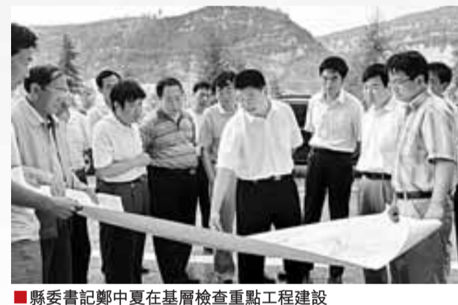
■縣委書記鄭中夏在基層檢查重點工程建設

鄉寧縣域經濟不斷實現跨越式發展, 特別是近年來經濟實力位次連續前移。2008年全縣國內生產總值完成45.5億元, 財政收入15.2億元, 城鎮居民人均可支配收入11659元, 農民人均純收入3763元, 在全省同類縣、市、區中位居前列。工業方面, 全縣工業實現了由無到有, 由弱到強, 由小向大向精的轉變。1978年前後, 全縣工業經濟以小煤礦、小火電、小化肥、小煉鐵和小土焦企業等「五小」企業為支撐。改革開放以來, 全縣工業進入了黃金發展時期, 以煤炭為主的工業生產已經成為縣域經濟最重要的支柱, 產業鏈條不斷延伸, 規模不斷壯大, 效益不斷提升。以煤炭為主的工業生產已經成為縣域經濟最重要的支柱, 產業鏈條不斷延伸, 規模不斷壯大, 效益不斷提升。全縣超億元納稅企業3家, 超5000萬元企業1家, 超3000萬元企業2家, 超1000萬元企業5家, 超500萬元企業8家, 超300萬元企業11家, 超百萬元企業31家, 總納稅額達9.7億元, 佔全縣稅收總額的89%。全縣商貿經濟也逐步形成了一個大流通、大市場、開放式的商品流通體系。一是流通網路日趨完善。目前, 全縣有批發貿易業、餐飲業活動單位2659個, 零售網點1259個, 從業人員14520人, 分別比1984年增8.58倍、2.91倍、5.71倍。多種經濟成份、多層次、多形式商業共同發展。二是個體私營經濟不斷發展壯大。全縣累計建成各類規模經營市場20個, 流通體系的發育促進了流通規模不斷擴大與城鄉集市貿易的日益興旺。