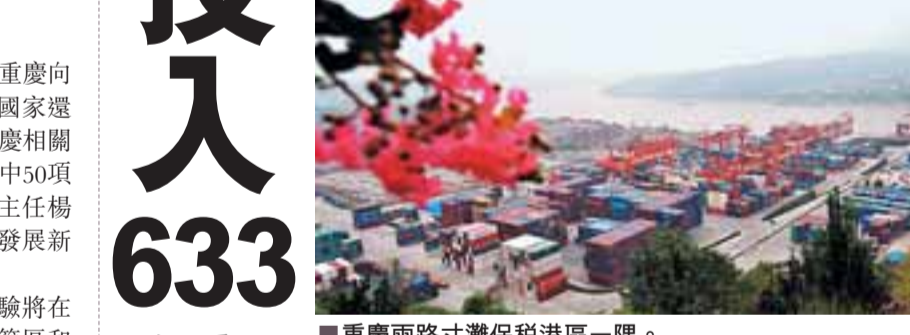
■重慶兩路寸灘保稅港區去年底掛牌。

今年將在大規模方面投入78.4億元。市財政局官員說, 特別要擴大對低收入和困難群體的民生保障範圍, 其中, 7.8億元用於支持大專畢業生、返鄉農民工、下崗失業人員等就業再就業培訓; 安排45.6億元提高社保待遇; 25億元則用於完善醫療保障政策, 將高校全日制學生納入城鄉居民合作醫療保險, 實現城鄉居民合作醫療保險制度全面覆蓋。 今年將投入131.3億元, 鑄就投資家「放心區」, 63.7億元優先發展教育和促進文化繁榮, 主要用於鞏固義務教育經費保障機制; 落實義務教育階段教師績效工資政策等。