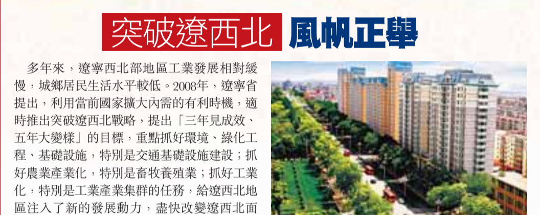
■遼寧瑞瑪之都阜新

隨着城際間特色產業帶的快速崛起，一座座以新型產業為支撐、佈局合理、功能完備的新型生態城市形勢初具規模。以瀋撫工業走廊為支撐，15.7%的水域面積、湖河交錯、橋樑縱橫的鐵嶺新城真正成為建在濕地上的中國北方水城。「兩條碧水穿城過，十里湖山盡入城」、「蓮花亭亭魚戲水，凡河森森柳隨風」鐵嶺市長張敬強的詩句堪為這座特色十足的江南水城——鐵嶺新城的真實寫照。這裡將成為風景秀美、有強大的新型產業支撐的東北地區商務、會展、休閒度假中心。