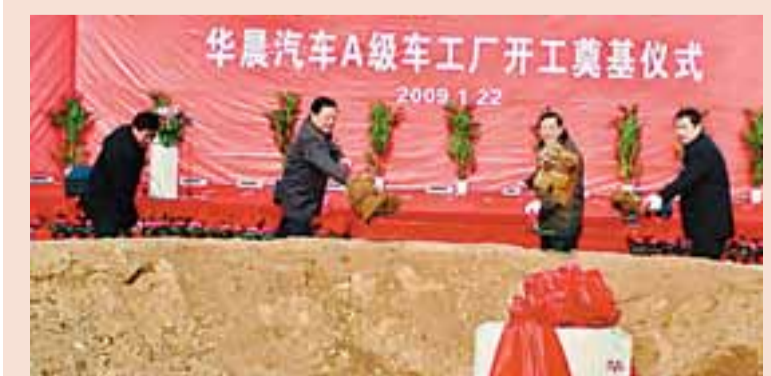
■瀋陽華晨汽車投資30億元、年15萬輛產能的A級車工廠開工奠基。該生產線將生產華晨自主研發的多數節能減排型綠色精品小排量系列A級家用轎車。

遼寧(本溪)生物醫藥高新產業基地已有70多個項目落地，預計投資84.6億元，可實現銷售收入264.9億元。先後投資8500多萬元建設的生物醫藥產業基地研發中心和生命健康產業孵化中心將有效整合基地的創新資源，加快科技成果向生產力的轉化。如今，已有19家科技企業研發機構和技術企業入駐。落戶基地的高新技術企業將得到100萬至500萬元的「科研三項費」支持，遼寧省科技廳還史無前例地投入了7000多萬元科技扶持資金。目前，「北方藥谷」已成功申報了省級醫藥高新技術產業基地，國家綜合新藥研發大平台已經獲准籌建，國家科技部「火炬計劃」也將本溪列為國家現代中藥產業基地。將率先實現連接帶的024區號共享。