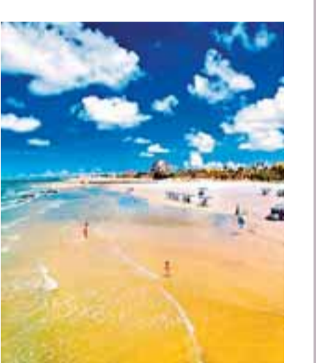
■天下第一灘北海銀灘

廣西壯族自治區領導名單 自治區黨委書記、區人大主任：郭聲琨 自治區政府主席：馬 飈 自治區黨委副書記：馬 飈、陳際瓦 自治區人民政府副主席：李金早、陳章良、楊道喜、陳 武、林念修、高 雄、李 康、梁勝利