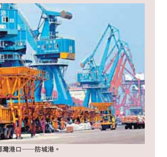
■繁忙的北部灣港口——防城港。

交通投資是廣西今年擴大投資規模的主戰場。全年爭取開工的交通項目有257個，總投資3,600億元。其中公路水路交通固定資產投資將增長30%以上，力爭達到400億元，比去年多了近170億元。全年力爭開工建設高速公路14條，投資總規模785億元，這意味着國道主幹線廣西境內路段、廣西高速公路網項目全部在今年開工建設。此外，還計劃開工路網項目公路500公里，開工農村公路7,200公里以上，開工水運重大項目11個，年底新增沿海萬噸級泊位9個。 在鐵路方面，廣西年內新開工建設12條鐵路，全年完成投資243.6億元，是去年的10倍。這些項目完成后，廣西快速鐵路網將初步形成，南寧到梧州等較偏遠的城市2個小時內就可到達，廣西將形成「3小時鐵路經濟圈」。