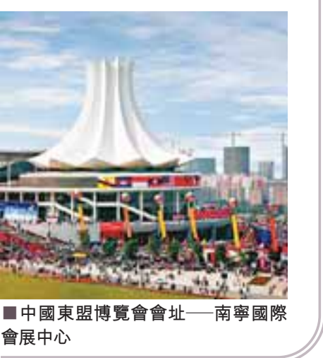
■中國東盟博覽會會址——南寧國際會展中心

2008年年初召開的廣西壯族自治區經濟工作會議上，宣佈2009年廣西全社會固定資產投資將達6000億元，比去年增長62%。在今年廣西「兩會」上，自治區政府工作報告中又進一步提出，為了把擴內需保增長的各項投資舉措落到實處，廣西在全力推進項目建設中，將把今後幾年開工的项目集中提前到今年開工，力爭實現全社會固定資產投資的重大突破。