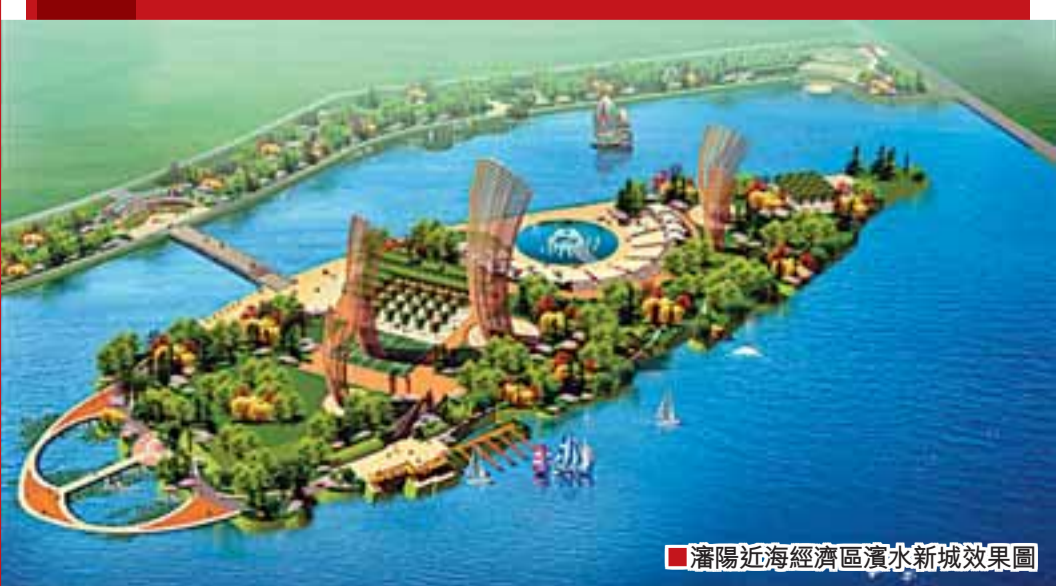
■瀋陽近海經濟區瀋水新城效果圖

2009年，遼寧確定了GDP增長11%的目標，日前遼寧省長陳政高在聽取省內十城市市長的工作匯報後提出六項保增長措施。我們有理由相信，「關鍵時刻，遼寧人能行！」 科學判斷形勢。既要看到國際金融危機尚未見底，我們要趨利避害，積極應對；又要看到危中有機，我們完全有條件憑借遼寧的優勢和基礎戰勝危機，實現大發展、快發展。 狠抓項目不動搖。要狠抓重大工業項目和產業集群，各地區都要加快建設和發展一批牽動力強的重大工業項目和一批超千億元的產業集群；要狠抓服務業特別是房地產業，推進房地產業平穩健康發展；加快基礎設施建設和公共設施建設。 圍繞企業抓好經濟運行。要深入調研，幫助企業解決難題；採取有力措施搞活房市和車市，擴大消費需求；積極創造條件，為經濟運行提供生產要素保障。 擴大開放。加大招商引資力度，以開放促改革、促調整、促發展，認真做好國外科技型企業併購和國外研發團隊引進工作，加快產業結