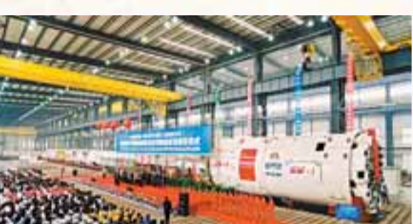
■瀋陽北方重工集團生產的世界最大直徑16米的大型隧道挖掘機——盾構機下線儀式