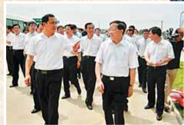
■遼寧省長陳政高(前右)視察瀋撫同城化核心區瀋陽市東陵區，前左為東陵區委書記沙波濤。

2008年，遼寧省繼續推進「五點一線」沿海經濟帶開發建設，將遼寧中部城市群確定為瀋陽經濟區，並適時提出突破遼西北戰略，三大戰略推動區域協調發展的局面開始形成，沿海與內陸互動發展邁出新步伐。