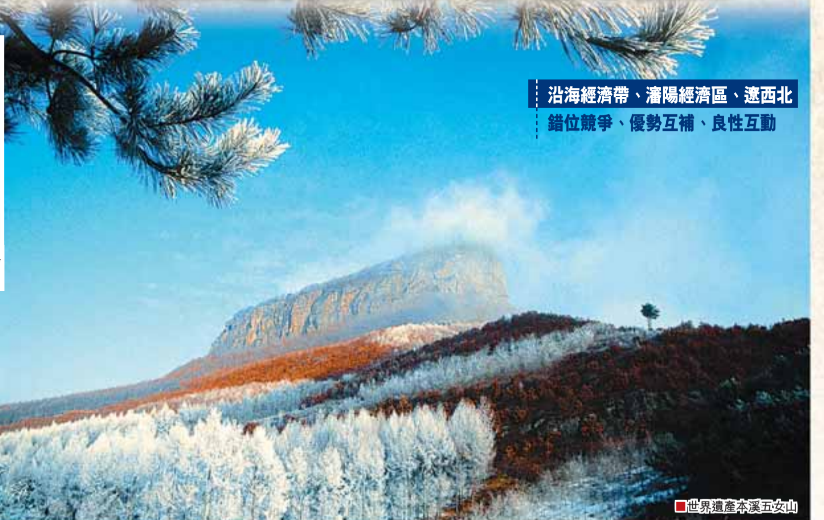
■世界遺產本溪五女山