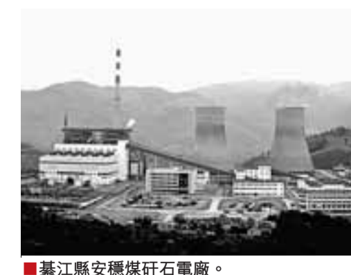
綦江縣安穩煤礦石電廠。

在綦江縣委、縣政府的領導和部署下，綦江縣全力推進招商引資工作取得巨大成就。2008年全年共簽約231個，協議引資210億元，到位資金23億元，分別同比增長305%、352.6%和91.7%。重慶直轄11年來，綦江縣作為「渝南門戶」，加上不可複製的能源、區位和交通優勢，其經濟社會得到了快速發展，但與發達地區相比，以及對照「314」總體部署的要求來看，綦江存在著較為明顯的差距。經過冷靜分析後，綦江縣委、縣政府不斷思索變革，提出「要把招商引資作為當前重要、緊迫的工作來抓。要搶抓機遇，主動出擊，實現綦江招商引資的大突破，推動綦江發展的新跨越。」