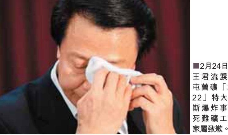
2月24日，王君流淚向屯蘭礦「2·22」特大瓦斯爆炸事故死難礦工及家屬致歉。

「屯蘭煤礦瓦斯爆炸事故影響極壞，我們對不起……死難礦工，也……對不起……他們的家屬……」山西省省長王君哽咽著向屯蘭礦「2·22」重特大瓦斯爆炸事故死難礦工及礦工家屬致歉。這是王君執掌山西五個多月來第二次流淚。距此僅僅半個月前，礦工出身的王君在山西省人代會上高票當選山西省省長後，立即前往襄汾看望「9·8」潰壩事故的受害家庭，當他看到陶寺鄉雲台村兩個孤兒痛哭時，自己也禁不住潸然淚下。對於山西的礦難頑疾，王君多次強調：「寧聽罵聲，不聽哭聲。」