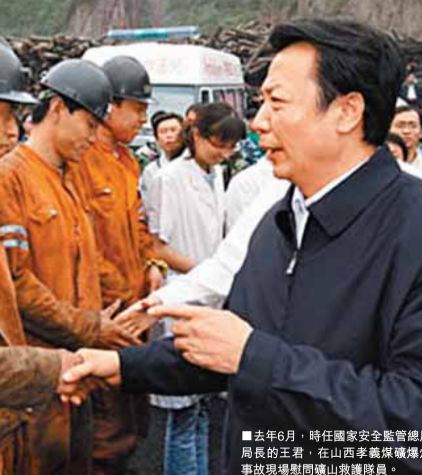
去年6月，時任國家安全監管總局局長的王君，在山西孝義煤礦爆炸事故現場慰問礦山救護隊員。

「發言不要超過十分鐘，要乾脆利索，不能說成績只說哪裡做得不夠、打算怎麼做。今年安全工作必須幹出個名堂來。」這是王君在1月20日山西省安全生產工作會議的閉場白。據透露，往年安全會只有分管副省長出席，今年不僅省長王君親自參加，而且除兩位副省長因職務在身未能前往，其餘5位副省長全部到會，全省11個市和119個縣的市長也全部參會。