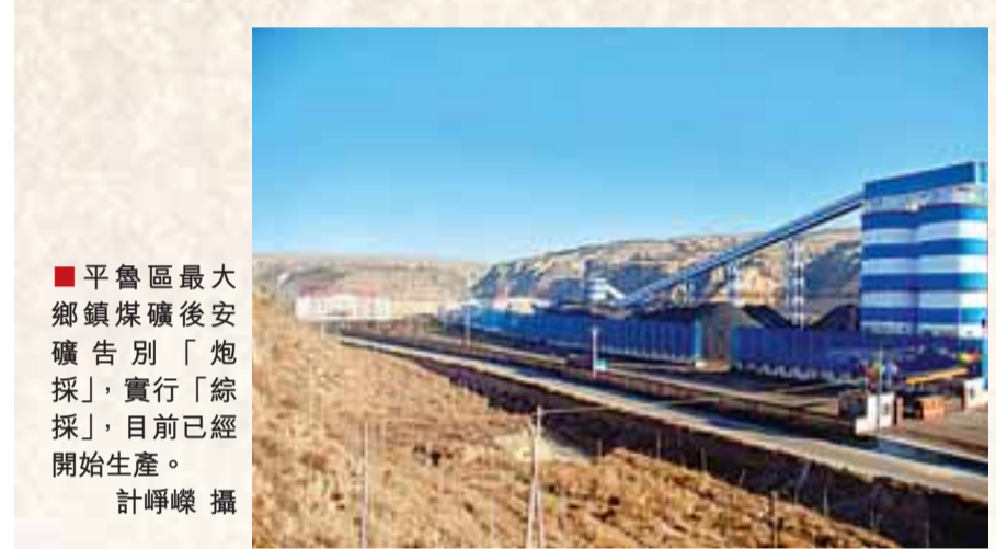
■平魯區最大鄉鎮煤礦後安礦別「炮採」,實行「綜採」,目前已經開始生產。計呼礦 攝