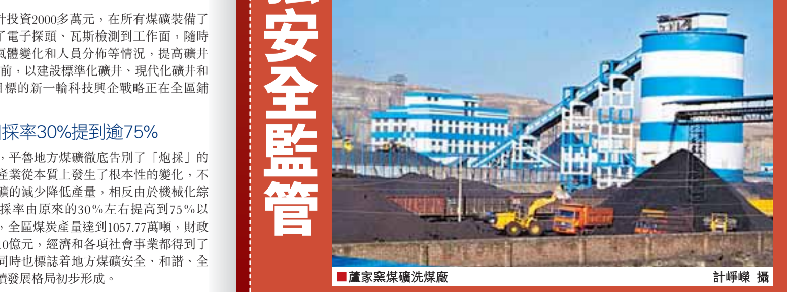
■董家窯煤礦洗煤廠

幹部可能連帶免職 與此同時,該區涉煤鄉鎮加強對轄區煤礦的安全監管,針對停產礦井委派副科以上幹部駐礦盯守,發現一次煤礦違法違規擅自組織生產、基建,免去駐礦領導幹部職務;發現兩次,免去鄉鎮長、書記職務。嚴禁煤礦擅自組織生產、基建,一經發現責實立即切斷全部供電,關閉礦井,沒收煤礦,並處以非法所得五倍罰款,對礦主及當事人移送司法機關嚴肅處。