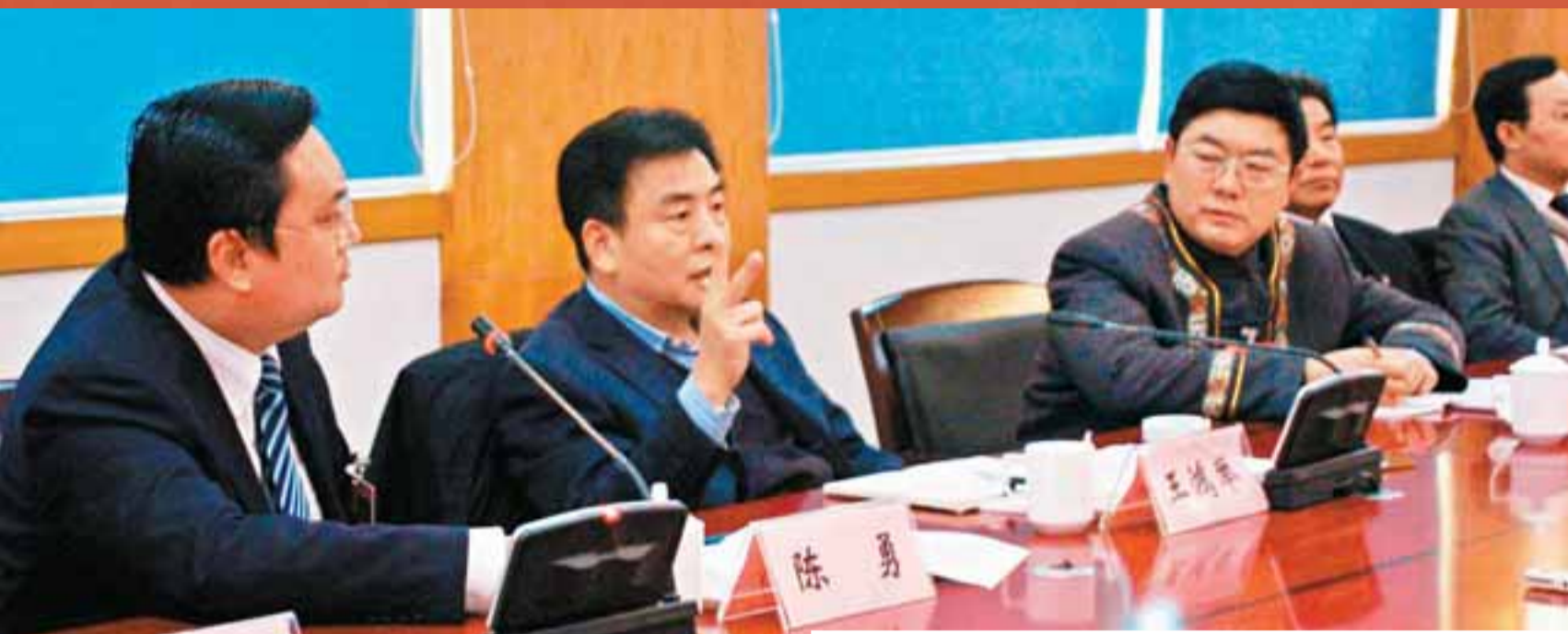
■重慶市委副書記、市長王鴻舉為酉陽的經濟發展支招。