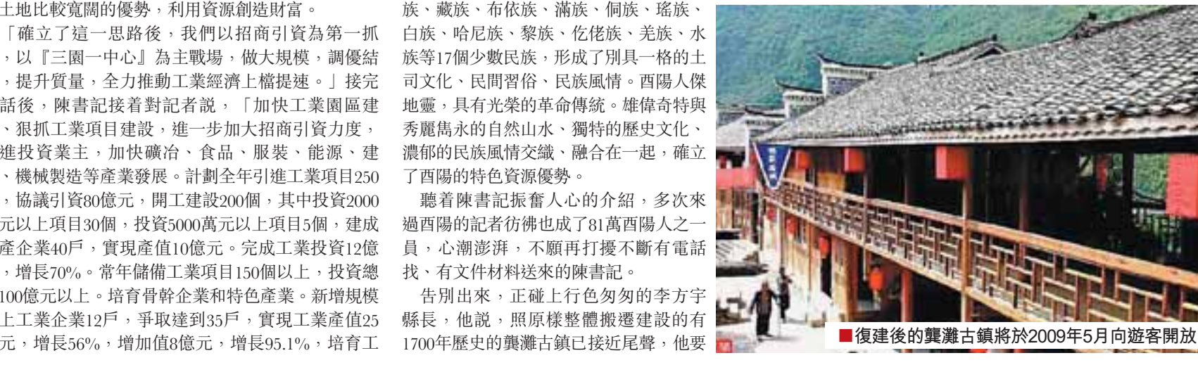
■復建後的麗灘古鎮將於2009年5月向遊客開放。

剛說完,一個電話叫住了陳書記。此時,記者的思維飛回到了市人代會上:到酉陽代表團座談的市長王鴻舉對這六大目標,做了很高的評價:「酉陽幹部精英明顯提升,全縣上下發展、謀發展、快發展的積極局面已經形成,令人感到十分欣慰。」王市長還給酉陽的發展支了招:酉陽要想實現突破性發展,招商引資是頭等大事,必須充分利用自身政策地帶的優勢,加大招商引資力度;要與沿海發達地區結成「姊妹對」,積極尋找合作夥伴,利用自身土地、電價、勞動力成本低廉的優勢,承接產業轉移;要聯繫自身條件,想辦法盡量發揮鐵路交通比較便捷和土地比較寬闊的優勢,利用資源創造財富。「確立了這一思路後,我們以招商引資為第一抓手,以「三園一中心」為主戰場,做大規模,調優結構,提升質量,全力推動工業經濟上檔提速。」接完電話後,陳書記接着對記者說:「加快工業園區建設,狠抓工業項目建設,進一步加大招商引資力度,引進投資業主,加快礦冶、食品、服裝、能源、建材、機械製造等產業發展。計劃全年引進工業項目250個,協議引資80億元,開工建設200個,其中投資2000萬元以上項目30個,投資5000萬元以上項目5個,建成投產企業40戶,實現產值10億元。完成工業投資12億元,增長70%。常年儲備工業項目150個以上,投資總額100億元以上。培育骨干企業和特色產業。新增規模以上工業企業12戶,爭取達到35戶,實現工業產值25億元,增長56%,增加值8億元,增長95.1%。培育工