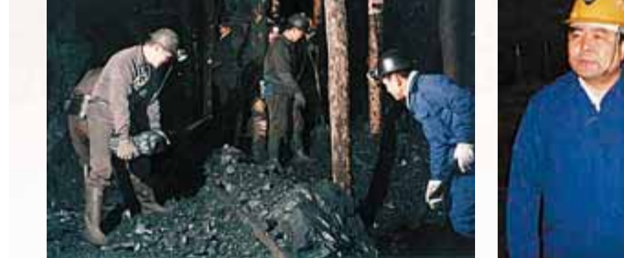
■平魯區地方煤礦實行「綜採」後,百萬噸死亡率劇降。