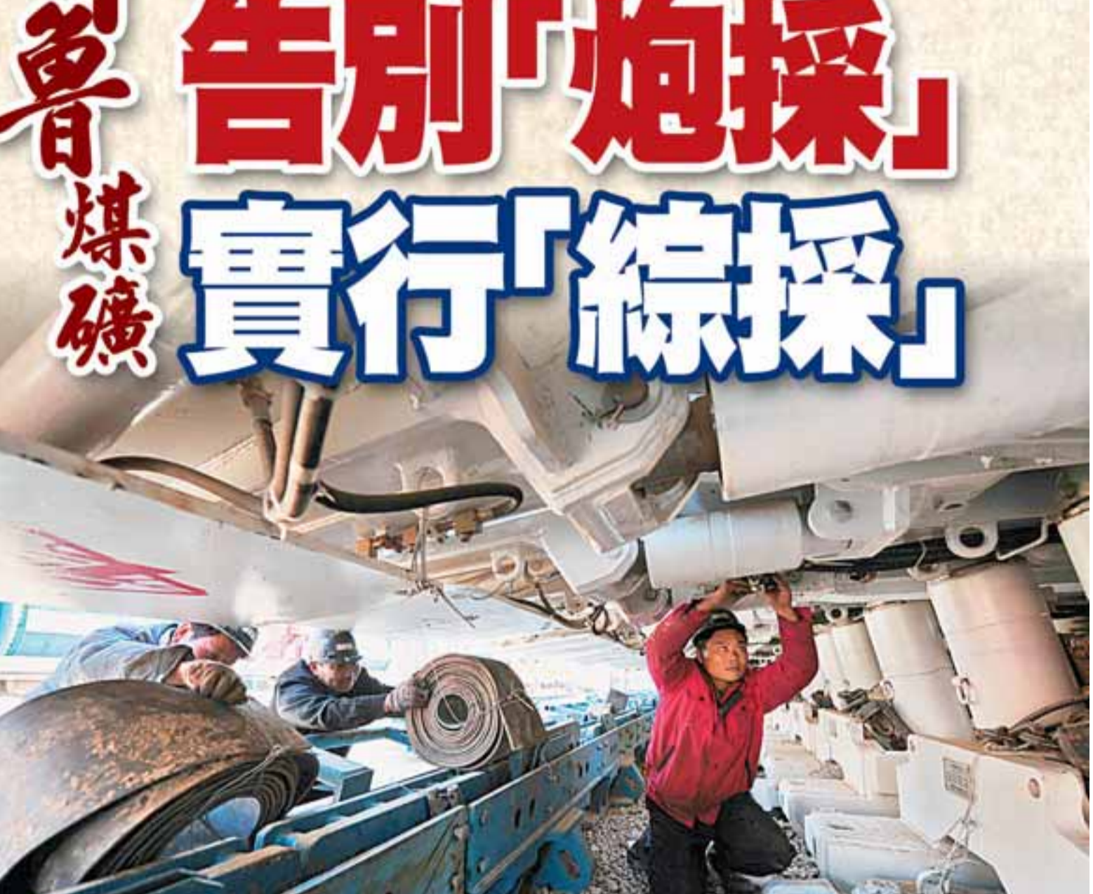
■平魯區地方煤礦徹底告別「炮採」,改為「綜採」。圖為技術人員正在試驗機械設備。

近年來,平魯區以科學發展觀為指導,堅持「富民優先、教育優先、生態優先、環境優先」的發展理念,大力實施「新型工業化、特色城鎮化、農業產業化」的發展戰略,除了煤炭工業通過整治改造和整合重組,走上了安全、高效、節約的路子外,城鄉統籌、教育事業、社會保障等方面也取得了巨大成就,使該區農民人均分配收入從1978年全省倒數第一的20.1元增至2008年逾3000元。■城鄉統籌。平魯土地貧瘠,農民居多,教務落後,為從根本上改變貧富懸殊、城鄉差距,該區以移民搬遷為突破口,規劃建設「一城十鎮百村」。預計到2010年,平魯將以1個10萬人的中心城區、10個5000人左右的中心集鎮、100個新建整治的村莊的新形態展示在世人面前。■教育優先。平魯區李林中學新校園的投入使用成為教育版圖變革的突破點。撤銷鄉鎮初中,新建鄉鎮寄宿制小學,調整學校佈局,整合優化資源,在2008年召開的全省寄宿制小學建設現場會上,平魯區發展教育的模式和做法得到充分肯定。平魯當年在版圖的大變革、佈局的大調整中,正在實現質量的大飛躍和人民群眾滿意度的大提升。■社會保障。建立健全了覆蓋所有城鎮鄉民的社會保障體系,實現了應保盡保。