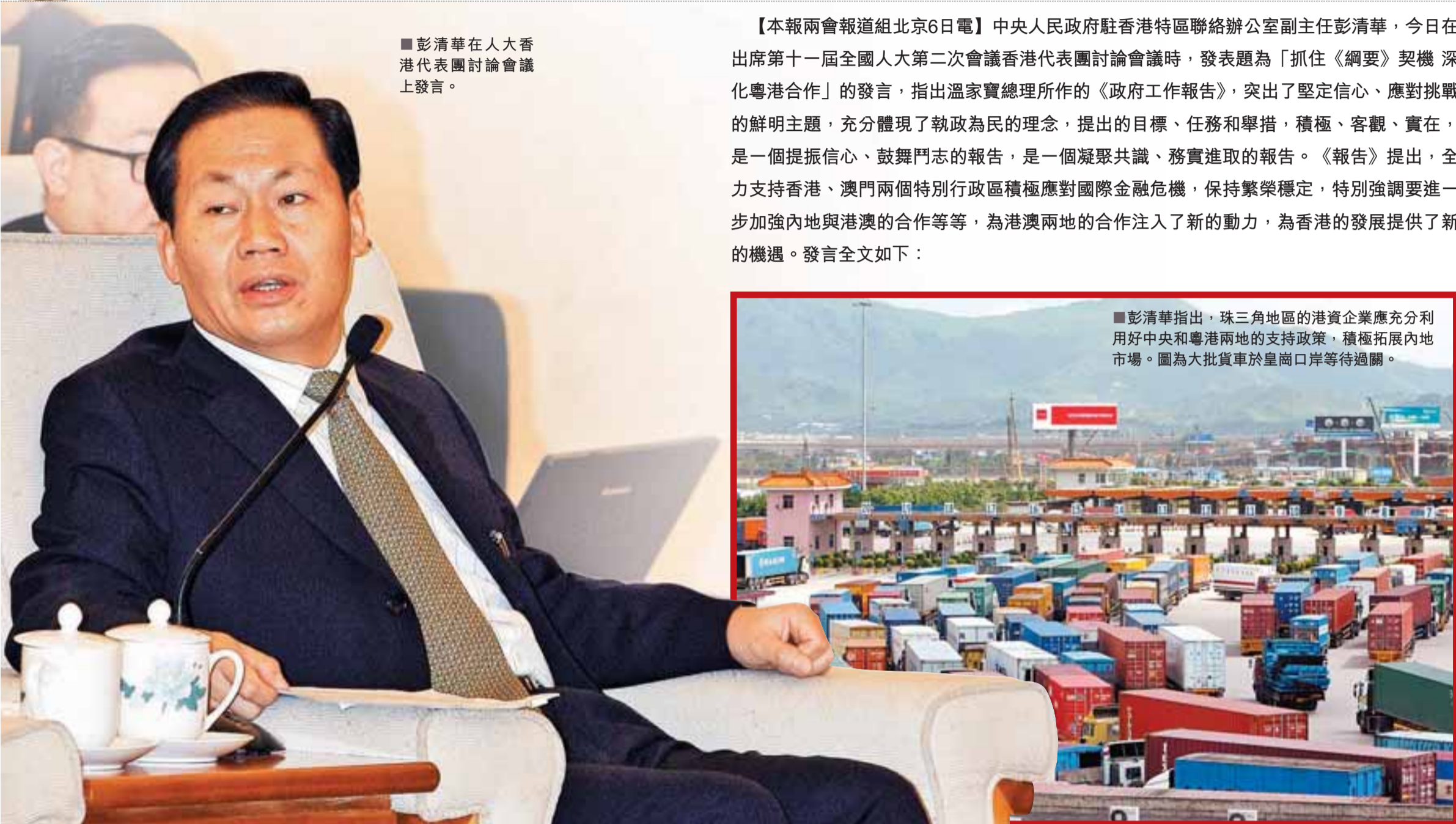
■彭清華在人大香港代表團討論會議上發言。

四是市場主導與政府引導並重。 兩地合作是一個龐大的系統工程，市場力量將始終發揮主導作用。隨着兩地合作的不断深化，政府引導作用也越來越重要。這次全球金融危機也再次顯現了政府在經濟發展中的重要作用。兩地應盡快建立健全落實《綱要》的實體性的聯繫協調機制，及時協調解決兩地合作中的重大問題，着手開展區域規劃的編制工作，加強在跨境基礎設施建設、城鎮體系發展、重大產業布局、生態環境保護等領域的統籌協調。要以提升區域國際競爭力為目標，加強軟硬件建設，有效整合各種資源，積極為要素流動便利化創造更好的條件，為大珠三角地區的發展提供一流的商環境。《綱要》雖好，終究是一紙藍圖，要把它變成現實是一項長期艱巨的任務，有大量艱苦細緻的工作要做。時不我待，任重道遠。（小題為本報編輯所加）