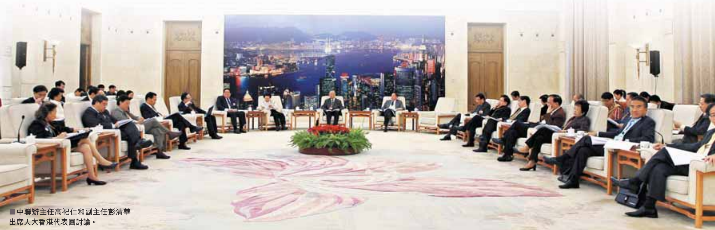
■中聯辦主任高祀仁和副主任彭清華出席人大香港代表團討論。