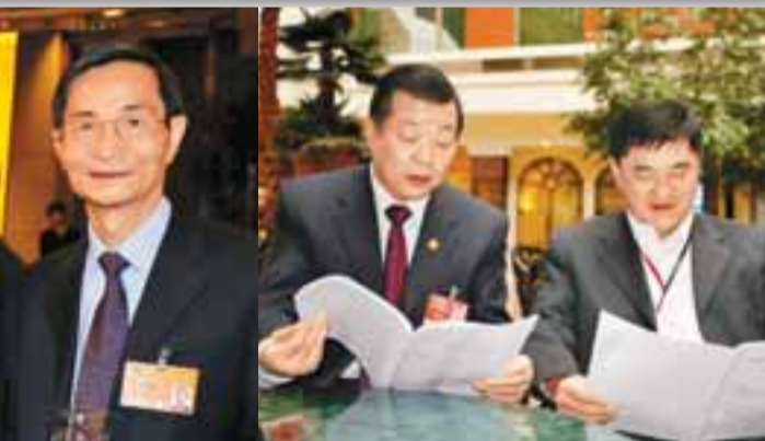
■(左至右)黎桂康、張國良和黃楚標聯合提案建議港深合作建立「深圳前後創新自貿區」。

由港區全國政協常委、香港中聯辦副主任黎桂康，全國政協委員、東海（聯合）集團有限公司董事長黃楚標及全國政協委員、香港新聞聯席主席張國良聯合提出的「港深合作建立『深圳前後創新自貿區』」的提案，獲得108名全國政協委員聯署支持。