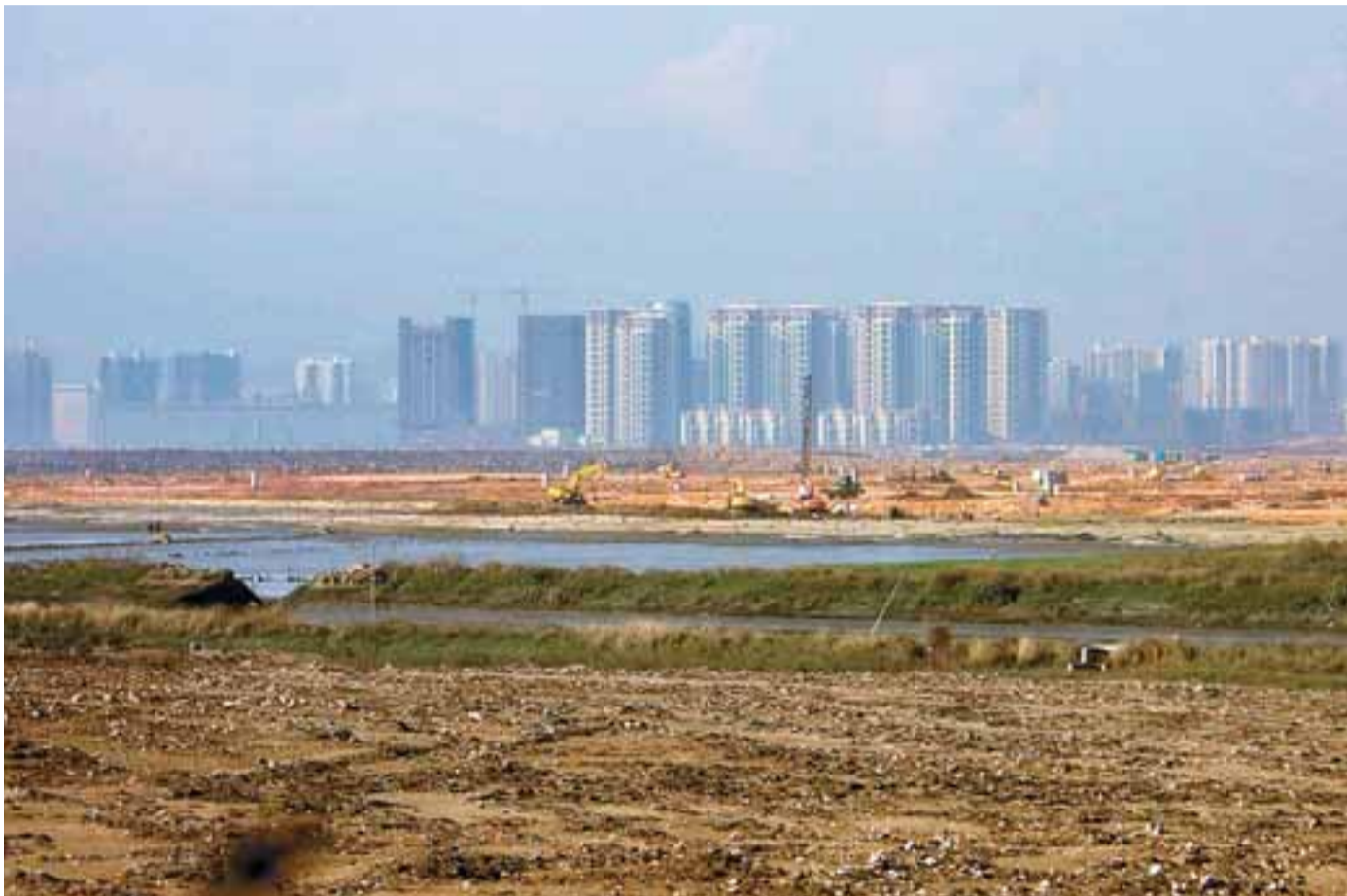
■前後海灣區交通便利，周邊也有不少高檔住宅，無疑是港深合作新的探索。

《珠三角改革發展規劃綱要》提出「規劃建設廣州南沙新區、深圳前海灣地區、深港邊界區、珠海橫琴新區、珠澳跨境合作區等合作區域，作為加強與港澳服務業、高新技術產業等方面合作的載體」，進一步明確了前後海灣地區的發展定位。消息人士指出，早在今年初「國家綜合配套改革試驗區」在國家層面獲得認可之前，深圳即有意在前後海灣區作為試點。官方授意規劃單位對前後海灣區進行「特別合作區制度創新與產業研究」，並計劃展開前海中心綜合規劃國際諮詢。粵港雙方對前海灣區寄予厚望，盼深港攜手再現30年前蛇口工業區的輝煌發展路徑。上百名港區全國政協委員的提案，正是在這樣的背景下提出。