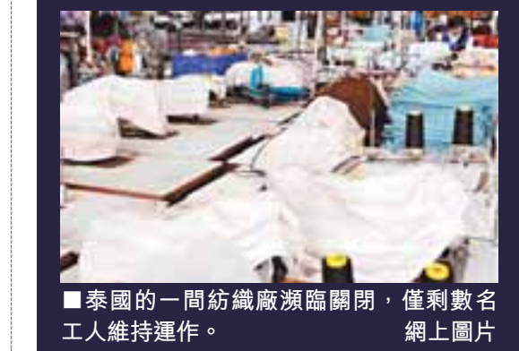
泰國的一間紡織廠瀕臨關閉，僅剩數名工人維持運作。

「全球化」指全球性的貨物、資本及就業自由流動，推動國際貿易，刺激經濟增長。「去全球化」指全球化的每一個過程逆轉，出現資本撤出、外勞回流、保護主義興起的局面。「去全球化」將令全球貿易額大幅下降，環球人才和資本流動停滯，威脅未來各個經濟體發展。「去槓桿化」指一間公司或個人減少使用金融槓桿，把原先通過各種方式(如衍生工具)「借」來的錢退回。現時的金融海嘯便觸發整個金融市場進入「去槓桿化」過程，原先支撐市場的複雜投資組合被迫解離，導致市場萎縮、相關行業受創，市場流動性更將大幅縮減，令經濟連連衰退。