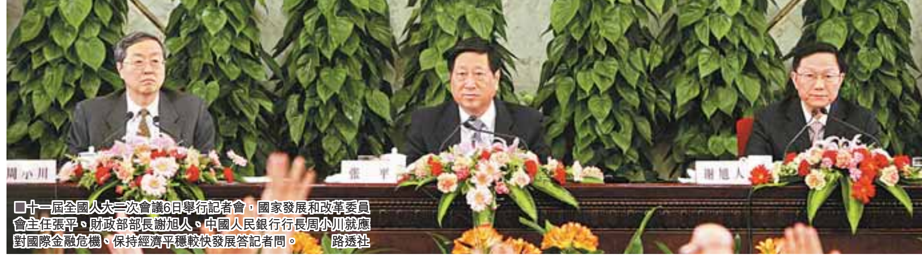
【本報兩會報道組北京6日電】國家發改委主任張平6日在記者會上公佈，4萬億元投資大體由7方面構成。與此前公佈的資訊相比，投資結構進行了比較大的調整，削減基礎設施投資，增加了結構調整和技術改造投資以及民生工程和社會事業方面的投入。對於3萬億元地方配套資金，張平提出通過地方發債、政策性貸款及發行企業債3管道來解決。

專家分析指出，與2008年11月27日張平在國新辦記者會公佈的4萬億元投資方案相比，新公佈的4萬億元投資和資金分配有明顯變化。其中，基礎設施投資明顯減少，比重由45%降至37.5%；節能減排和生物工程投資也明顯減少，由8.73%降至5.25%；結構調整和技術改造投資則從4%提高到9.25%；民生工程和社會事業方面投資也分別從7%、1%增加至10%、3.75%。