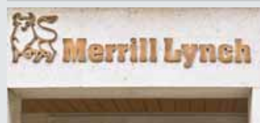
《紐約時報》昨日報道，美林(見圖)一名倫敦外匯交易員，涉嫌在去年進行不當外匯交易，導致美林損失超過1.2億美元(約9.3億港元)。此外，據報亦有多名美林交易員涉嫌參與信貸違約掉期(CDS)交易，造成數億美元虧蝕。