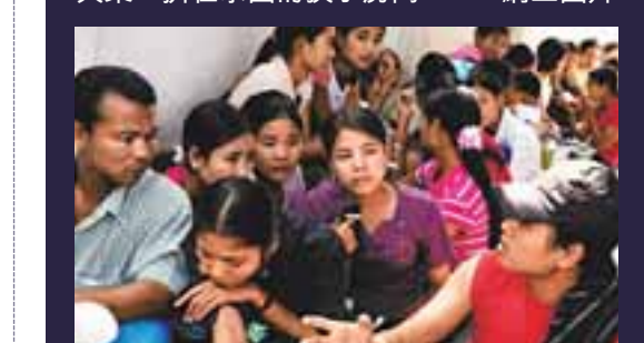
緬甸外勞在泰國勞工處門口，要求破產的廠商歸還欠薪。