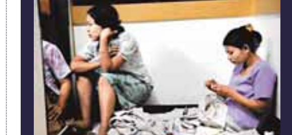
失業的緬甸勞工在狹窄的房間做散工，維持生計，每小時僅賺0.2美元。