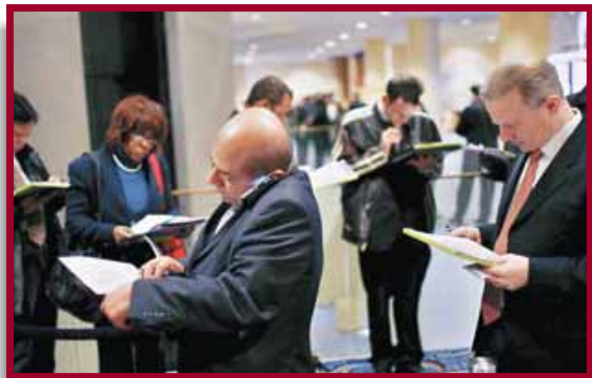
紐約招聘會上，中產人士排隊填表，等待面試。

新失業數據反映美國經濟衰退惡化。美國勞工部長失言會盡一切努力打破「職位流失的破壞性循環」。