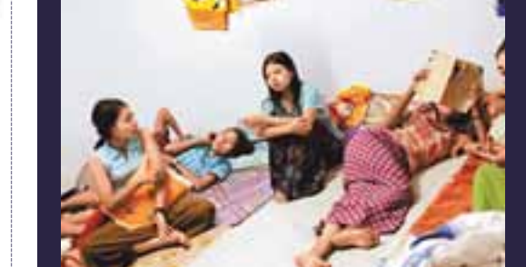
泰國邊境的製衣廠閉門令大批緬甸外勞失業，擠在泰國的狹小房間。

分析員估計將有20萬外勞於2010年底前撤走。內閣資政李光耀昨日表示，當地經濟今年最多會收縮10%，情況遠差於2001年衰退的情況。馬來西亞 驅逐10萬名印尼外勞，保障國民就業。吉蘭丹 外勞收入佔國內生產總值27%，外勞回流對國內經濟影響甚大，甚至要向聯合國求助。韓國 外資大舉撤走令國家外債儲備大減，到今年底可能不足以償還短期債務。東歐 外資撤走令多國出現財困，但歐盟內部卻是是否提供援助陷於分歧。英國 工人示威抗議外資公司聘請廉價外勞。