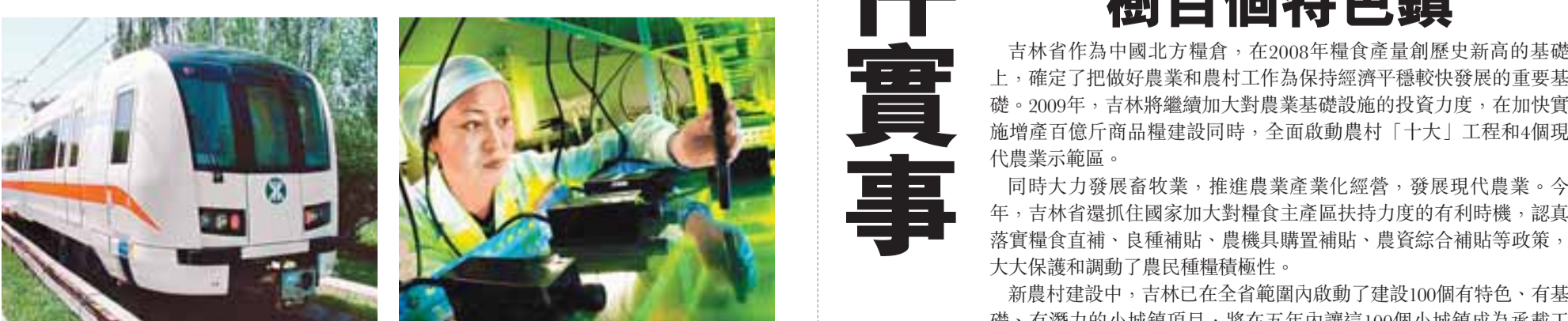
長春軌道客車生產技術全國領先。

量體裁衣 多渠道保就業 就業是民生之本，吉林省失業率連續多年保持在4.3%以下的較低水平，城鎮零就業家庭保持動態為零。但隨着金融危機影響進一步蔓延，新增就業難度開始加大。擴大就業成為當前和今後吉林長時期重大而艱巨的任務。為此吉林省從實際出發，分別制定了符合不同就業群特點的措施，穩定就業局勢。