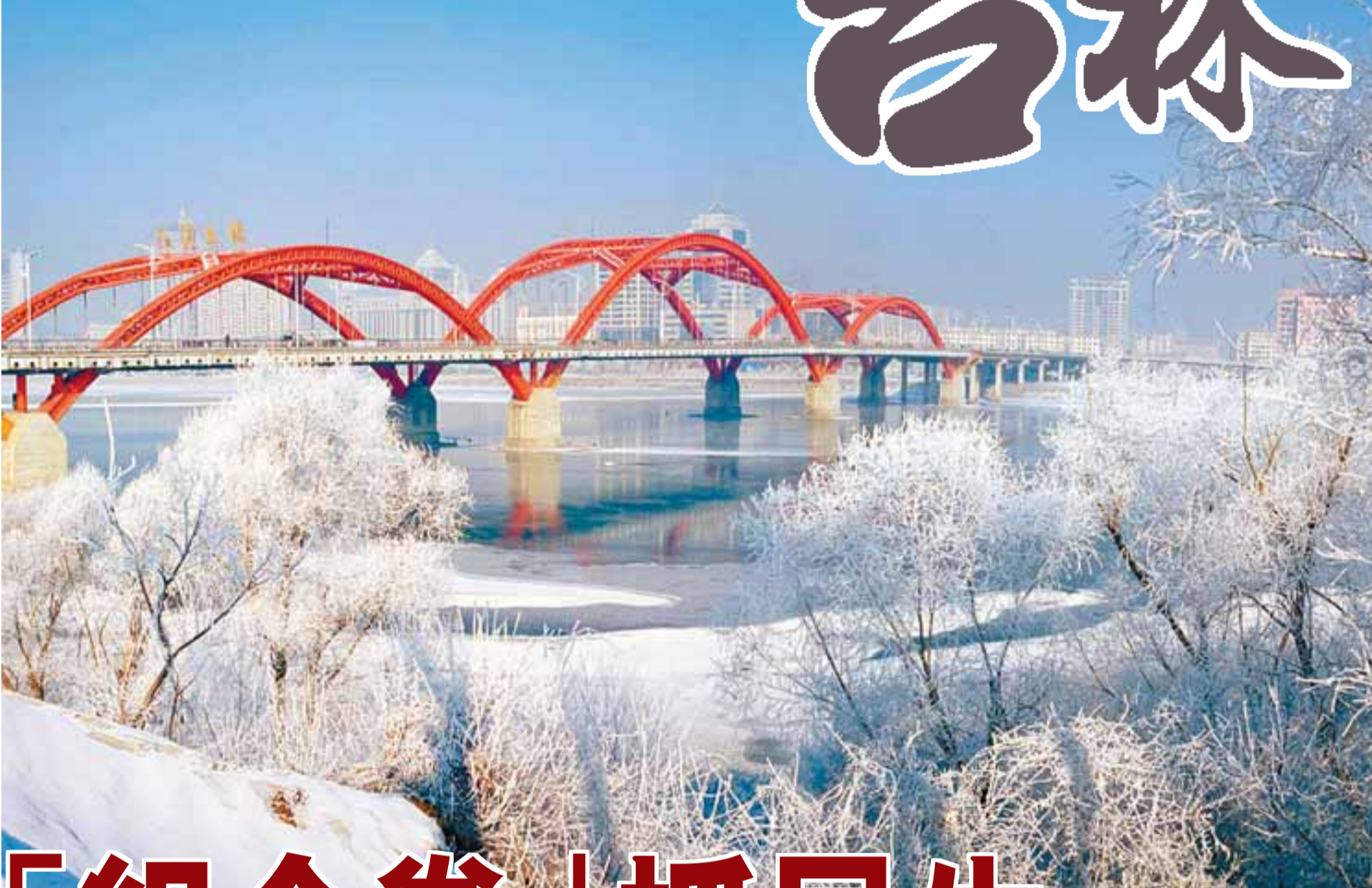
吉林市的霧凇是中國四大自然奇觀之一。

中央振興東北老工業基地政策實施5年來，吉林省已逐漸擺脫老工業基地舉步維艱的困難局面，近年來實施的一大批重大工程項目使吉林省投資拉動的效應集中顯現，成為中國經濟增長最快的地區之一。2008年在全球遭遇金融危機的大背景下，吉林省仍取得GDP增長16%的好成績。進入2009年，雖然不利因素增多、經濟下滑壓力加大，但吉林省圍繞經濟發展戰略打出「組合拳」，使一系列穩經濟、抓民生、促就業的措施落到實處。