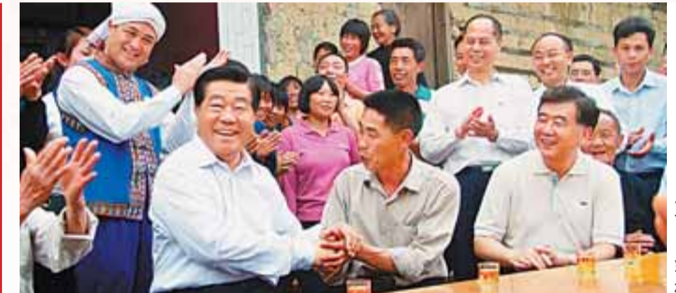
■中共中央政治局常委、全國政協主席賈慶林（前排左一）在乳源大橋鎮調研。

另外，他強調，乳源在新一輪科學發展中明確實施「科教興縣」戰略。在過去的發展中，這方面已有一些先進的經驗，如每年都送教師到國外交流學習，提升該縣教育者的國際眼力。科技方面，該縣在韶關也是首屈一指，建立了韶關市第一個博士後工作站。