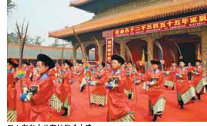
■山東省曲阜市的祭孔大典。

山東省今年《政府工作報告》顯示，山東將把發展服務業作為擴大內需、優化結構、促進就業的重要舉措，並將引導外資和社會資本投入服務業，使服務業投資增幅要繼續高於全省固定資產投資平均水平。此間人士指出，香港服務業發展，兩地可就此加強溝通和合作。