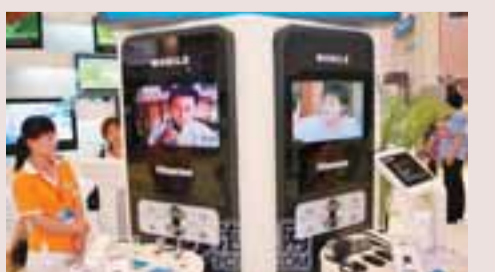
■山東海信集團的高新產品。

此前，山東省已正式出臺《關於促進外經貿平穩較快發展的意見》，從八大政策扶持力度、擴大優勢產品出口等18個方面推動山東省外經貿發展。據此《意見》，山東今年在鞏固傳統市場的同時，將積極開拓南亞、中東、中亞、南美、東歐等新市場。在出口商品結構方面，將重點擴大電機產品和高新技术產品出口。在吸引外資方面，將引導