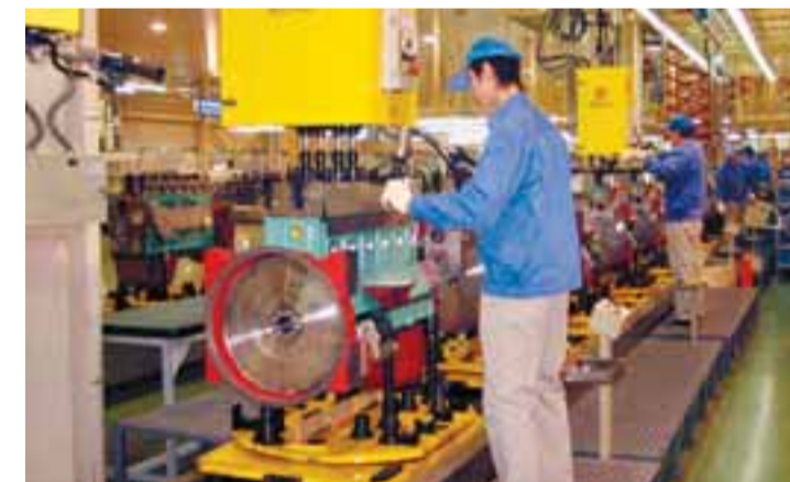
■濰柴動力是全國最大的汽車零部件企業集團。