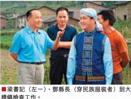
■梁書記（左一）、鄧縣長（穿民族服裝者）到大橋鎮檢查工作。