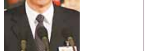
江蘇省省長 羅志軍

江蘇省領導一覽 省委書記、省人大主任：梁保華 省長：羅志軍 省政府主席：張運珍 省委副書記：羅志軍、王國生 副省長：趙克志、張衛國、黃莉新、何權、徐鴻、史和平、李敏、曹衛星