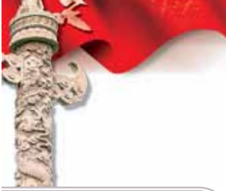
寧夏自治區黨委書記 陳建國