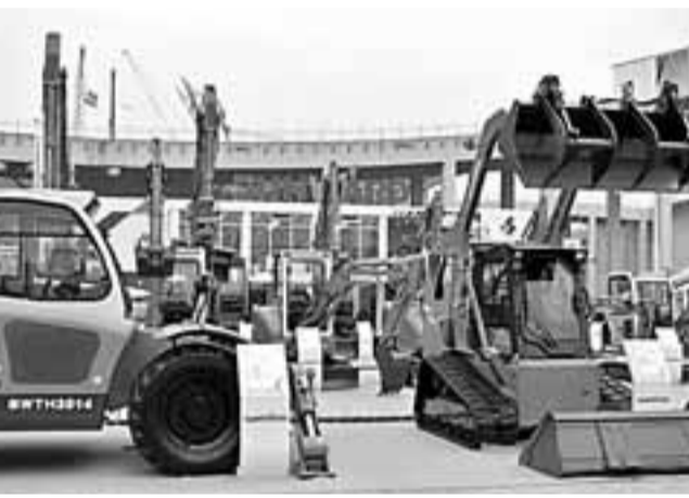
山河智能公司生產的小型挖掘機，長沙通過產業集群打造中國機械之都。

「生物產業大會」等豐富多彩的招商引資活動，集中向外推介六大產業群和服務外包項目，取得了積極成效。全市有進出口實績的各類加工貿易企業為55家，涉及電子信息、工程機械、汽車及其零部件、紡織服裝等產業。全市加工貿易企業參與國際競爭的意識不斷增強，整體實力日益提升，湧現出了三一重工、中聯重科、LG飛利浦曙光、寶力奧汽車拉羅、博世汽配、山河智能等一批加工貿易龍頭企業。