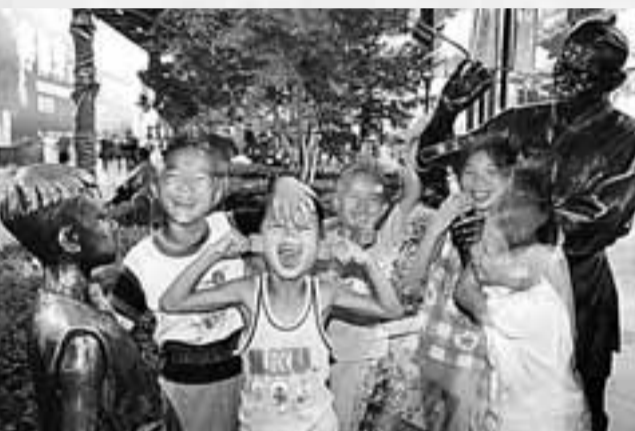
努力打造創業之都、宜居城市、幸福家園，是長沙的發展目標。

從側重經濟增長的「發展」，到以人為本的「科學發展」，長沙市民越來越體會到民生時代的幸福。一項項暖到百姓心窩裡的民生政策領先瀟湘乃至全國，讓長沙市民實實在在享受改革開放帶來的甜蜜生活。不久之後，在召開聽證會徵求市民意見的基礎上，長沙市政府又決定終止岳麓山風景名勝區或麓湖景區西湖漁場約600畝土地的出讓合同，並在原址修建一個讓長沙市民滿意的文化公園。這兩次「還湖於民」是長沙市政府以人為本、尊重民意的真實寫照。