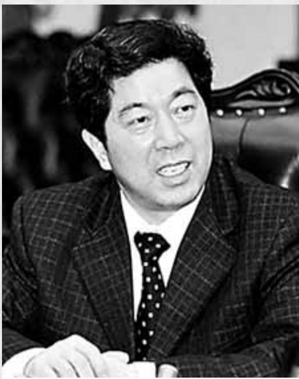
長沙市委書記陳濟兒