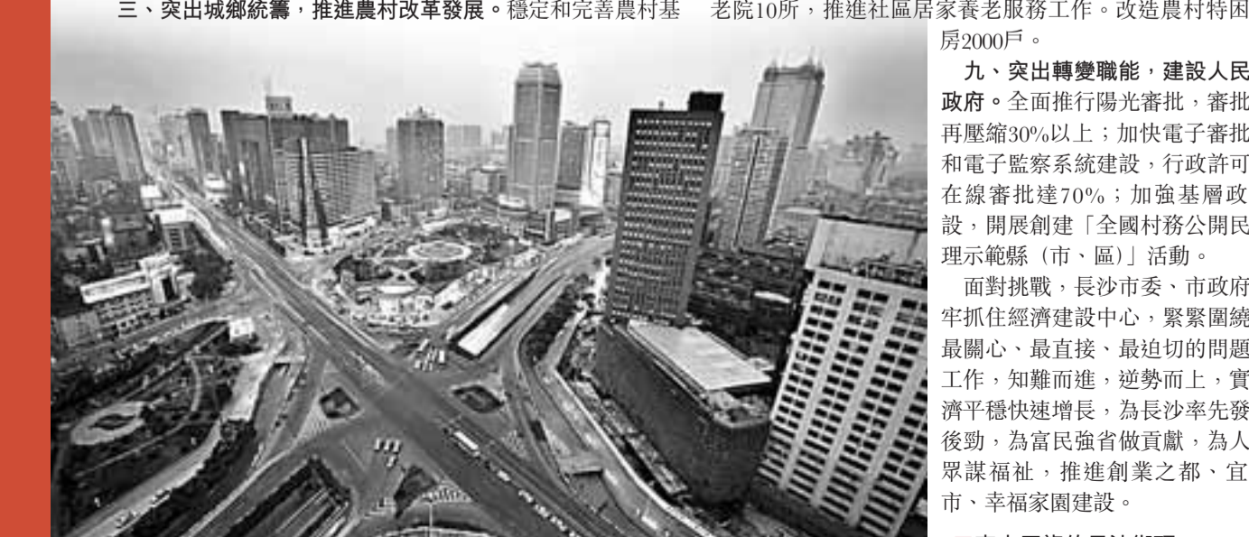
車水馬龍的長沙街景

突出創業富民，建設創業之都。認真落實推進創業富民有關政策，加快留學生創業園等創業基地建設，幫扶困難企業和勞動密集型企業穩定就業崗位，實施公益性就業崗位援助，突出關心大學畢業生、返鄉農民工和新增就業人員就業，新增城鎮就業8萬人，保持城鎮零就業家庭動態清零。