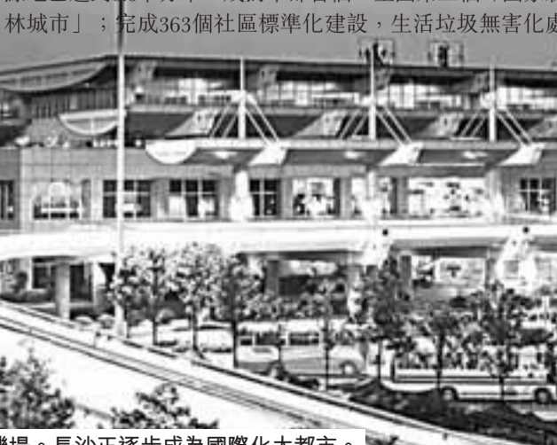
長沙黃花園國際機場。長沙正逐步成為國際化大都市。

2008年長沙市堅持高起點規劃，完善城鄉規劃編制體系，共編制並落實城市景觀、建築色彩等11個專項規劃。堅持精心建設，以「一江兩岸」和片區開發建設為重點，城鄉重點工程投資136億元，完成長沙大道、年嘉湖陸運、湘江防洪道路等市政工程，建成金洲大道、橘子洲風景區等精品工程。堅持精細管理，突出治堵、治亂、治差，抓好小區、小巷、小院、小店改造，實施樓棟美化、亮化和綠化提質工程，改造棚戶區60萬平方米，加強供水、供電、供氣和公共客運保障，提升賞文行業文明服務水平。