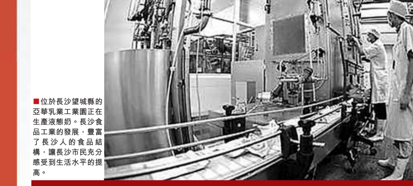
位於長沙望城縣的亞華乳業工業園正在生產液態奶。長沙食品工業的發展，豐富了長沙人的食品結構，讓長沙市民充分感受了生活水平的提高。

「2009年將是新世紀以來經濟發展面臨困難最大、挑戰最嚴峻的一年。長沙也處在一個關鍵的時點上，挑戰與機遇並存，只要我們萬眾一心，迎難而上，就一定能夠戰勝各種困難和挑戰！」在今年初舉行的湖南省十一屆人大二次會議上，長沙市長張劍飛在謀劃長沙新一年的發展時信心百倍、豪情滿懷。