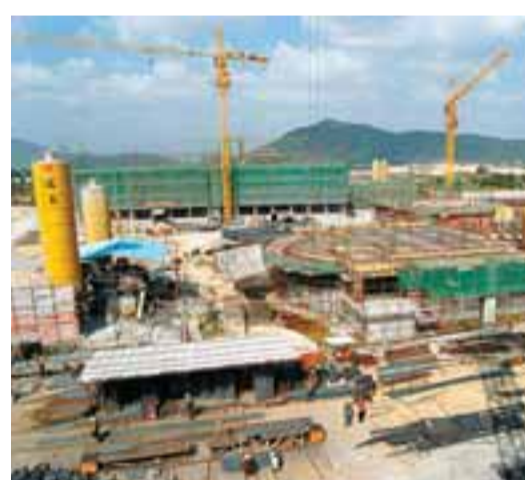
海南島東海岸一批高檔度假酒店工地建設如火如荼。

目前，海南省以國際旅遊島建設，全面提升海南旅遊業的國際化水平，為國內外遊客提供具有國際水準的旅遊產品和旅遊服務，作為全省經濟發展的新輪戰略目標，將通過推動旅遊業開放，帶動全局開發，進而為自由貿易區建設創造條件。當前全省正重點實施四大項工作：一是積極爭取將國際旅遊島建設納入國家整體發展戰略；國家主體功能區規劃及國家「十二五」規劃綱要；二是全力以起爭取國家賦予海南更加開放的旅遊產業政策；三是加快編制國際旅遊島建設規劃；四是加大旅遊要素的國際化改造，真正實現海南旅遊的轉型升級。