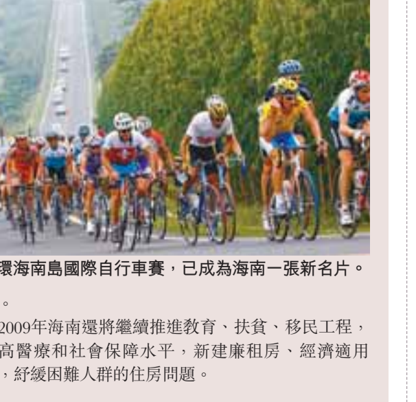
環海南島國際自行車賽，已成為海南一張新名片。

農業是海南傳統的支柱產業，海南政府今年將確保投入農業補貼資金10億元；擴大發展農業的小額貸款10億元。政府還將從今年起每年預算安排3,000萬元，與金融機構共建省級信用擔保平台，解決中小企業融資難問題。同時，加快發展海洋經濟，支持在海南建設國家南海海洋基地；紮實推進節能減排工作，確保18個污水和18個垃圾處理項目竣工，新開工6個污控和7個垃圾處理項目。