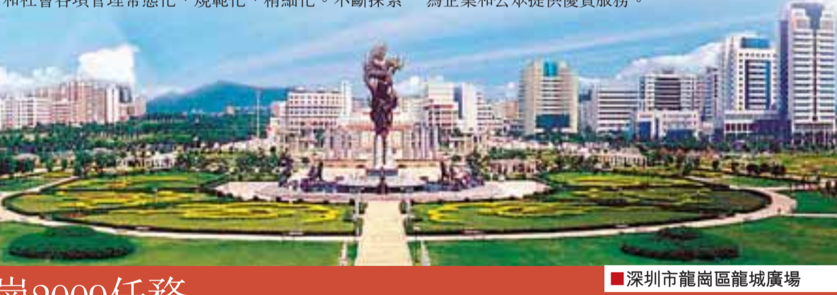
深圳市龍崗區龍城廣場

城市化後的龍崗區正處在大建設、大發展時期。同時，也因為社會轉型、產業結構調整、基礎設施薄弱、人口結構嚴重倒掛、重大項目拆遷任務繁重等，一系列社會矛盾日趨凸顯。為尋求突破困局的良策，龍崗進一步解放思想，改革創新，構建了集綜合治理、綜合管理、綜合服務「三位一體」，並通過整合條塊管理力量，形成「指揮是一個系統，防範是一張網絡，打擊是一個拳頭，執法是一個整體，服務是一個平台，管理是一個機制，應急是一支力量」的「七個一」大綜管工作新格局。