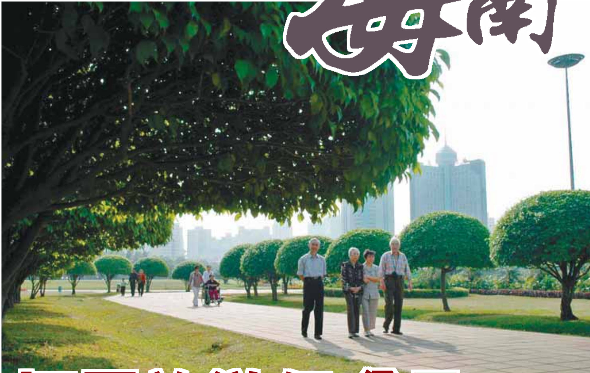
海口被譽為國內最宜居宜旅的熱帶海濱城市。

作為典型的島嶼型經濟，海南經濟總體上屬於投資拉動型、島外需求型。在當前國際金融危機衝擊的嚴峻形勢下，海南省委、省政府清醒地認識到，擴大有效需求是海南應對危機、保增長的根本途徑，當前更應高舉經濟特區旗幟，施非常之策，作非常之為。