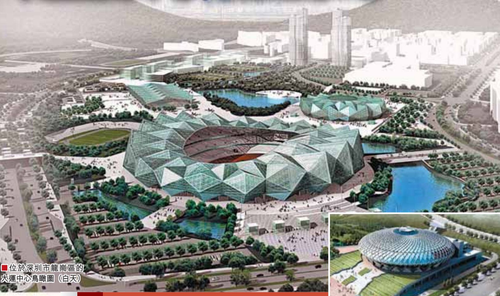
位於深圳市龍崗區的大運中心鳥瞰圖 (白天)