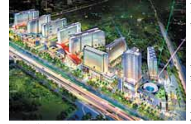
天安龍崗項目夜景

合作，尤其是加快推動南澳旅遊口岸建設。此外，在文化教育和高管理學院等方面加強交流，爭取香港社會也到龍崗來開設分校。