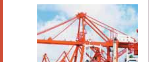
洋浦保税港區已正式開關運作。圖為繁忙的洋浦港。

人口：830萬 土地面積：全省陸地(含西、中、南沙群島)總面積3.54萬平方公里，其中海南島陸地面積3.39萬平方公里，海域面積約200萬平方公里 08年GDP：1,466億元，同比增長9.8% 地方財政一般預算收入：145億元，同比增長33.9% 09年發展目標：全省GDP增長9%左右；地方一般預算收入增長13%；全省固定資產投資增長12%；城鎮居民人均可支配收入增長8%、農民人均純收入增長7.5%；城鎮登記失業率控制在4%以內；居民消費價格總水平漲幅控制在5%以內；人口自然增長率控制在千分之9.38以內；萬元GDP能耗下降1個百分點。