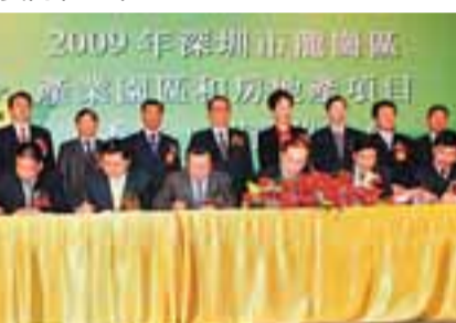
2009年1月6日，深圳市龍崗區產業園區和房地產項目(香港)招商推介會項目簽約儀式。