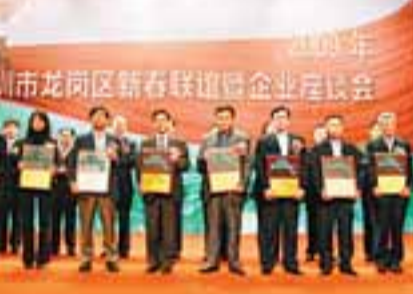
2009年深圳市龍崗區在新春聯誼暨企業座談會上表彰了一批投資商和企業。