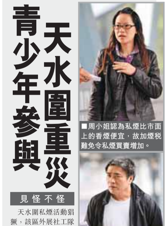
天水圍重災青少年參與

天水圍私煙活動猖獗，該區外展社工隊長擔心，不法分子聘請雙失青年販賣私煙的情況會因此增加，故提醒隊員密切注意有關情況，以免更多青少年誤入歧途。有市民直言，煙稅增加令區內兜售私煙情況增加，「經濟不景氣，私煙買賣增加都好正常」。