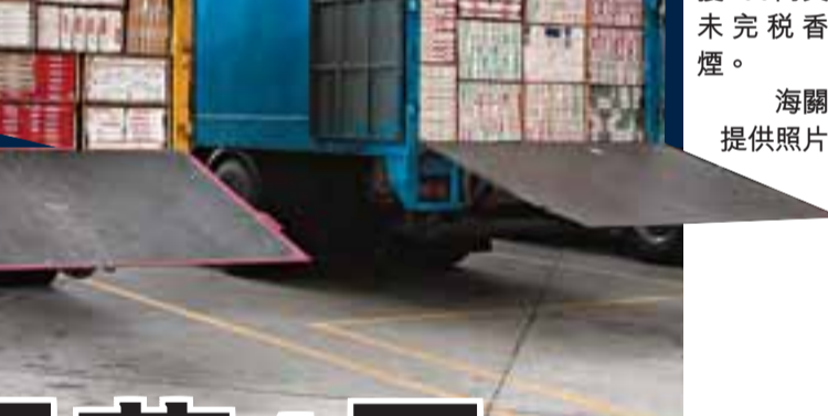
海關於3月2日在落馬洲管制站獲兩輛貨車，搜獲255萬支未完稅香煙。

【本報訊】販賣私煙屬違法行為，購買私煙亦會觸犯法例，自政府調高煙草稅後，海關在過去1周破獲40宗街頭私煙買賣案件，拘捕46人，當中26人是購買私煙的市民；另在各管制口岸，破獲6宗較大規模的走私活動。海關表示，暫時未發現私煙活動有上升趨勢，會繼續嚴厲打擊私煙，重申任何人士參與買賣私煙的活動，最高刑罰為罰款100萬元以及監禁2年。