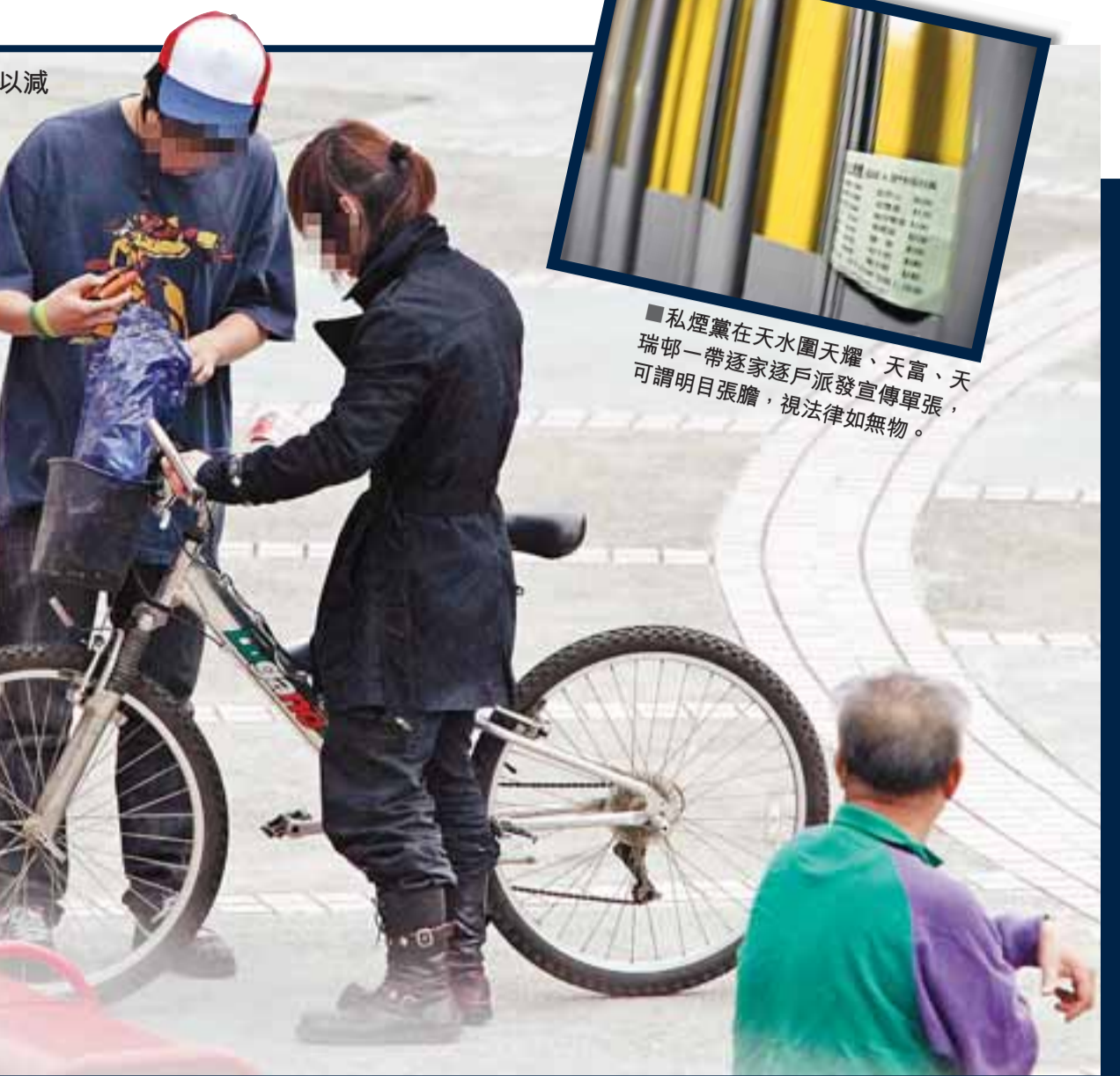
私煙黨在天水圍天耀、天富、天瑞一帶逐家逐戶派發宣傳單張，可謂明目張膽，視法律如無物。

【本報訊】政府冀「重鎚」增加50%煙草稅，以減少本港煙民數目，惜「未見其利，先見其弊」，反而「益蝕」私煙販子。在完稅煙售價飆升10元的情況下，有私煙集團看準市民「不願捱貴煙」的心理，明目張膽在偏遠地區的公共屋邨如天水圍，逐家逐戶大派宣傳單張，以「點對點」的方式經營香煙外賣上門的生意，甚至聘用懷疑未成年人士送貨。有知情人表示，自政府加煙稅後，私煙亦同步加價，每包由15元加至18元，但仍比完稅煙便宜超過20元，私煙生意即時升2、3成，每月盈利超過6位數字。