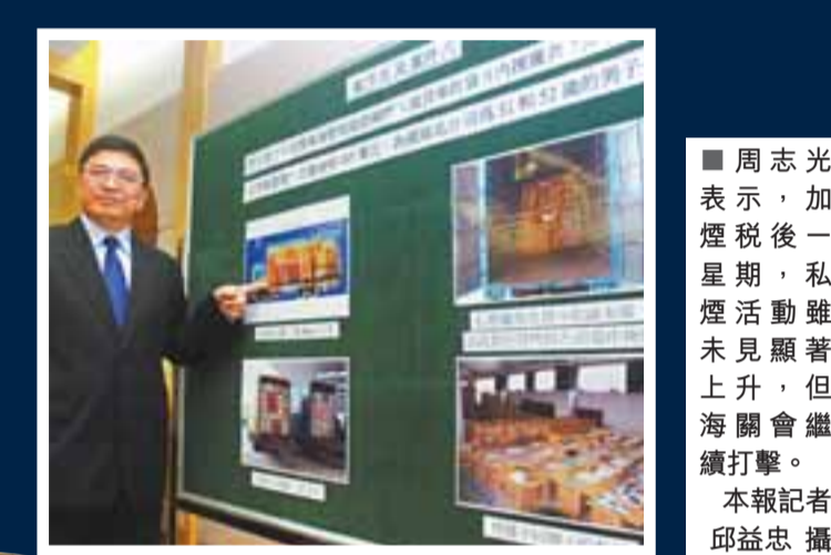
周志光表示，加煙稅後一星期，私煙活動雖未見顯著上升，但海關會繼續打擊。