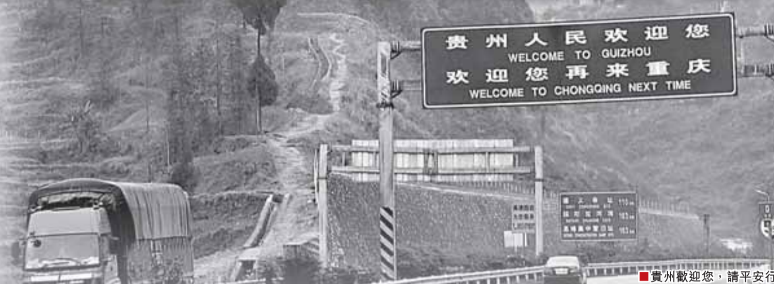
■貴州歡迎您,請平安行車。本報記者周亞明攝

剛剛過去的09春運,是對貴州交警「保平安、保暢通、保穩定」綜合能力的又一次嚴峻考驗。數據顯示,貴州交警交出了一份令人滿意的答卷。與去年春運相比,儘管各類上報交通事故次數上升了7.0%,但死亡人數、受傷人數則分別下降了24.3%、9.3%,其中一次死亡3人以上的特重大事故發生12起,死亡40人,同比次數持平,死亡人數則下降了60%。