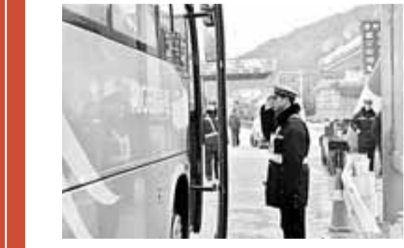
■春運期間,7座以上客車,逢車必查。

春運期間,各地交警部門加大了安全宣傳工作的力度。一是作好春運啟動日儀式。在1月11日春運啟動日當天,各地開展形式多樣的「春運」啟動儀式。當全省共舉行春運啟動主題宣傳日活動近90場,發放各類宣傳資料30餘萬份,播放宣傳光碟300餘場,擺放宣傳展板6400餘塊,受教育群眾達近20萬人次,各地新聞媒體對活動啟動儀式進行了現場報道。