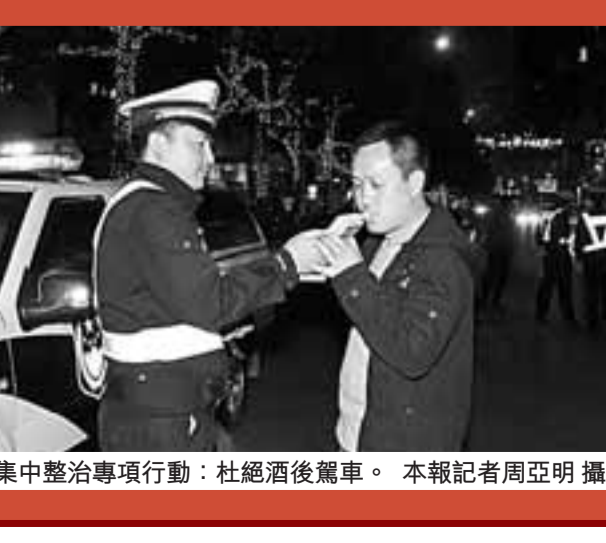
■集中整治專項行動:杜絕酒後駕車。

為破解地處邊遠、警力不足、警力分散的矛盾,貴新四大隊在全系統中較早啟動了科技強警戰略。以落實上級黨委關於信息化發展部署為契機,通過深入開展信息化培訓、深度運用、規範運用工作,下大力氣培養民警的警察意識、程序意識和證據意識,以「三基」信息化建設帶動執法規範化建設和執法質量的逐步提升。