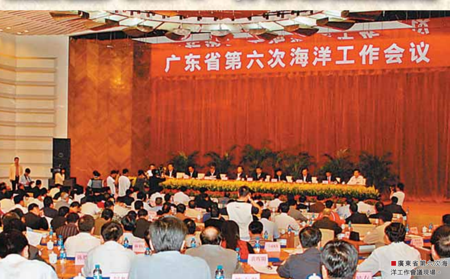
廣東省第六次海洋工作會議現場。