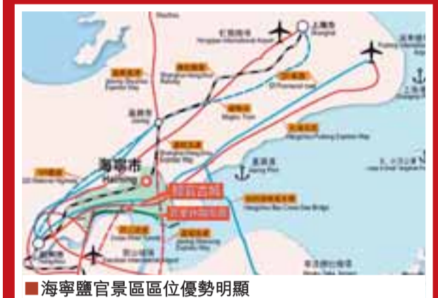
海寧鹽官景區區位優勢明顯

未來的海寧鹽官景區將建設成為世界級著名觀潮景區、國家級歷史文化名城、長三角休閒度假勝地。千年古城，休閒勝地，百里江濤，錦繡長廊，熱忱歡迎海內外投資者品味海寧鹽官觀潮景區、體驗海寧鹽官觀潮景區、投資海寧鹽官觀潮景區！