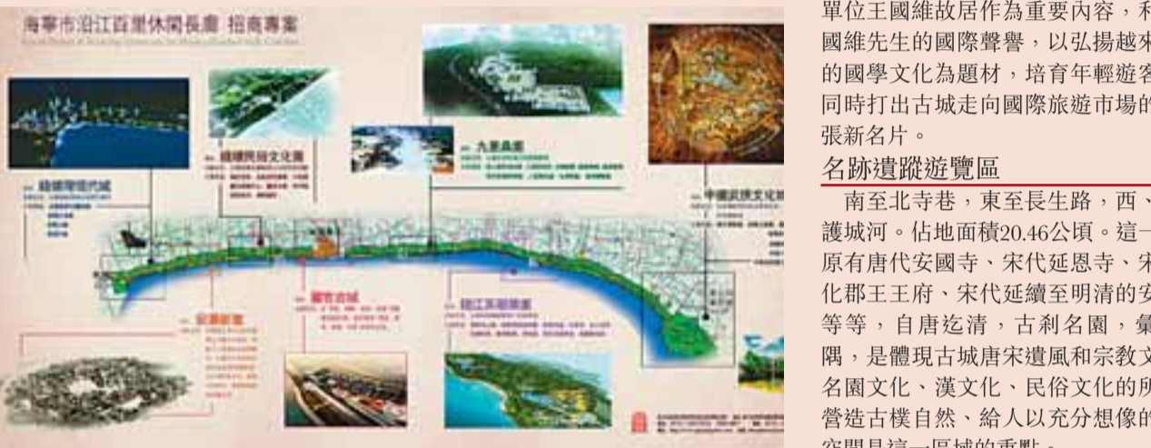
沿江百里長廊項目分佈

以錢江潮為主題，從而營造「悠遠、追尋、風雅、生活」的休閒古城，將投資約20億元，分2009-2011、2012-2013、2014-2015三期實施投資開發。